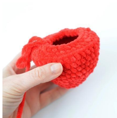
6. Szydełkuj przez tylną pętelkę, aby uzyskać płaski spód