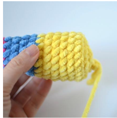
16. Szydełkuj w TPO, aby utworzyć dolną część