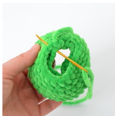
4. Zszyj 1-sze i ostatnie okrążenie razem