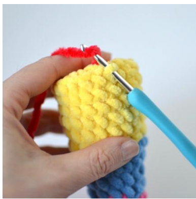
17. Szydełkuj w PPO