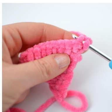
10. Szydełkuj w TPO