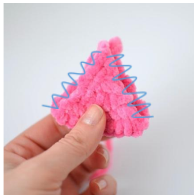
12. Zszyj boki trójkąta