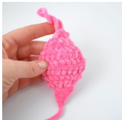
11. Druga strona ukończona