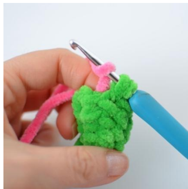
14. Zakończ psł nowym kolorem