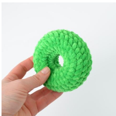
5. Pierścień gotowy