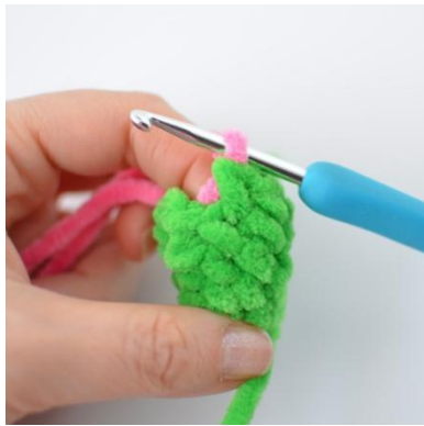
15. Zmień kolor