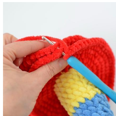
20. Połącz części oś