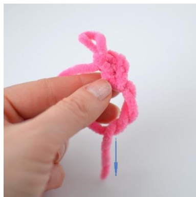
8. Zaczynij od zrobienia magicznego pierścienia