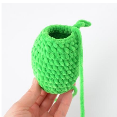
3. Wszystkie okrążenia wykonane