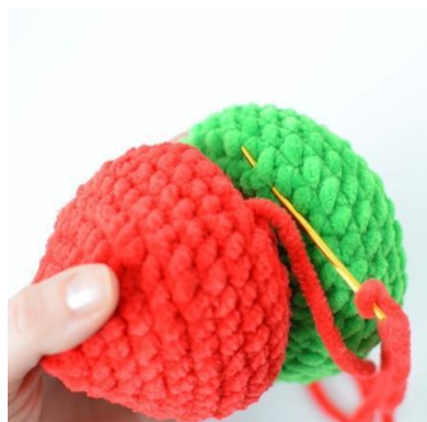
7. Przyszyj przednie pętelki do pierścienia