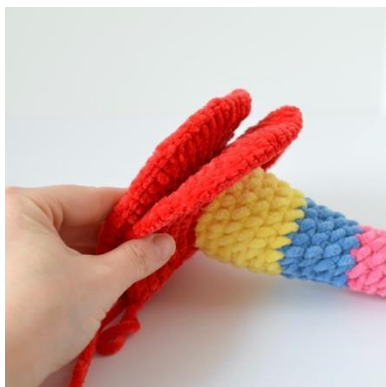
19. Umieść podstawę na dolnej części słupka