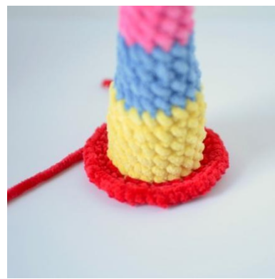
18. Szydełkuj w PPO