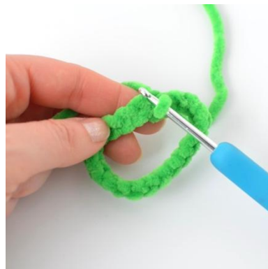
2. Połącz 1-sze i ostatnie o.