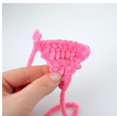
9. Pierwsza strona ukończona