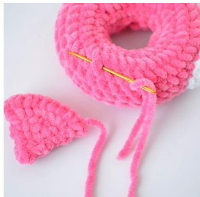
13. Przyszyj skrzydło do pierścienia