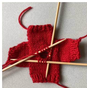
Nabieranie oczek na plisę dekoltu