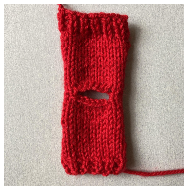
Gotowy przód i tył