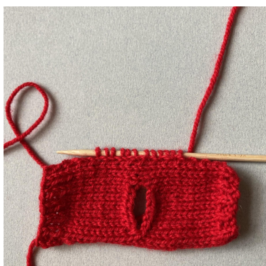
Nabieranie oczek na rękaw

Drugi rękaw wydziergaj w taki sam sposób.