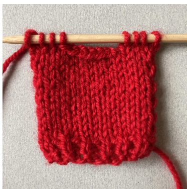
Zamykanie oczek dekoltu przodu

Na dekolt zamknij oczka: Dziergaj 4 o, zamknij 6 o, dziergaj 4 o