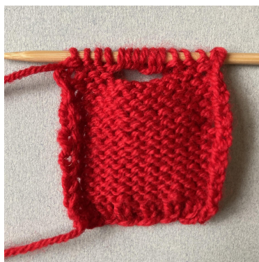
Nabieranie oczek dekoltu tyłu