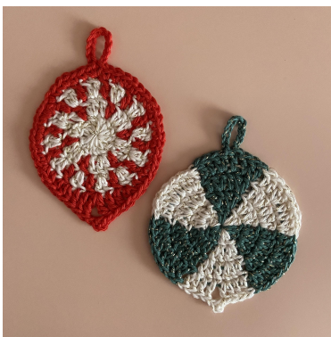
Ozdoba miętowa i zielony wiatraczek

Okrażenie 4: [2 o.ł. (liczą się jako pierwszy sł.), psł.n.]. 2 sł., [2sł., 3, o.ł. psł. w pierwsze o.ł., 2sł.]. 2 sł., [2 psł.n.], 2 psł.n., {[2 psł.], 2 psł.}, powtórz { } jeszcze 3 razy, [psł., 10 o.ł., o.ś w psł., psł.], 2 psł., powtórz { } jeszcze 3 razy, [2 psł.], 2 psł.n. Zamknij o.ś. w wierzchołek 2 o.ł. i odetnij włóczkę (48 o. i 2 prz. z o.ł.).