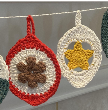
Ozdoba Popcorn i z gwiazdką

Okrażenie 4: 3 o.ł., 2 sł., [2 2sł.], [2 2sł.], 3 sł., [2 psł.n.], psł.n., 6 psł., 3 psł.n., [2 psł.n.], 3 sł., [2 2sł.], [2sł., 10 o.ł., o.ś. w 2sł., 2sł.], 3 sł., [2 psł.n.], 3 psł.n., 6 psł., psł.n., [2 psł.n.], o.ś. w wierzchołek 3 o.ł., odetnij nitkę (48 o. + prz. z 10 o.ł.).