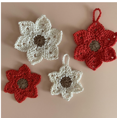
Mała i duża Poinsecja

Okrażenie 3: 1 o.ł. (liczy się jako pierwszy psł.), sł. W prz. z 3 o.ł. [2 sł., 15 o.ł., psł. w pierwsze z 15 o.ł., 2 sł.], sł., psł.. {Psł., sł., w prz. z 3 o.ł. [2 sł., 3 o.ł., psł. w pierwsze z 3 o.ł., 2 sł.], sł., psł.}. Powtórz { } jeszcze 4 razy. Zamknij o.ś. w 1 o.ł. i odetnij włóczkę (48 o. + 6 prz. z o.ł.).