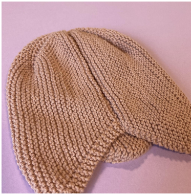
Zszycie brzegu nabierania oczek i brzegu zamykania oczek