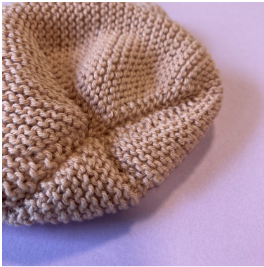
Łączenie części 1-6