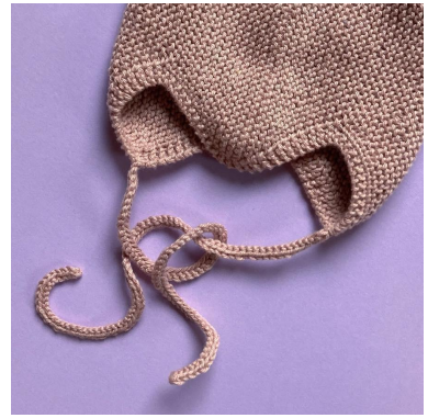
Tasiemka do wiązania