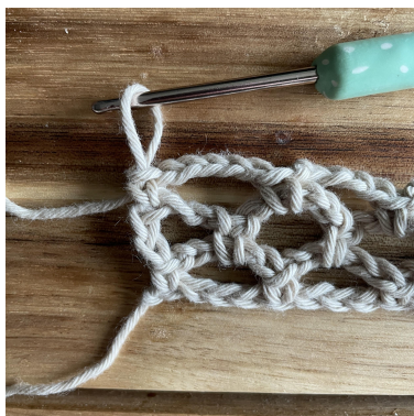
Zdjęcie pokazuje koniec Rzędu 3.