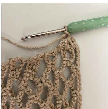
Zdjęcie pokazuje początek Rzędu 1.

Rząd 1 (PS): Będziesz przerabiać wzdłuż szwów bocznych. Obróć robótkę o 90 stopni. Będziesz przerabiać wokół każdego łuku. O.ł.-1, psł. w pierwszą prz.-5 o.ł. *(3psł.n. razem, o.ł.-1). Powtarzaj od *( ) wzdłuż. Psł. w ostatnie o. Odwróć. (20 o.)