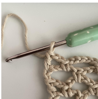
Zdjęcie pokazuje koniec Rzędu 4.

Rząd 4: o.ł.-6. w pierwszą prz. z o.ł., psł. *(o.ł.-5, w następną prz. z o.ł., psł.). Powtarzaj od *( ) we wszystkie prz. z o.ł. O.ł.-2, sł. w 2. o.ł. o.ł.-6 poniżej. (21 łuków)