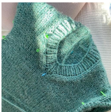
Przerabianie ściągacza na dekolcie V.