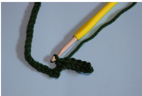
3. Zaczynając od drugiego oł od szydełka zrób 6 oś