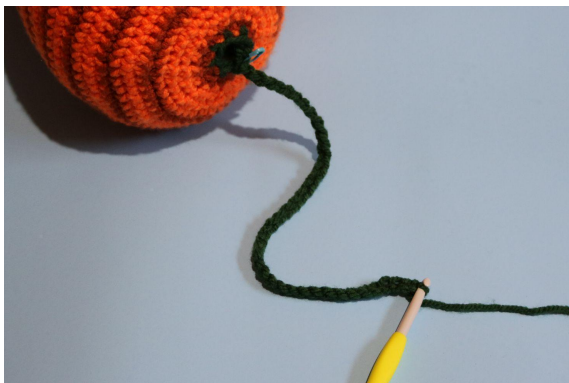
1. Liść A.) 1 psł w ppo, 40 oł