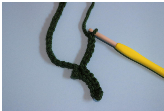
4. Oś w następnym oł, 7 oł, zaczynając od drugiego oł od szydełka zrób 6 oś