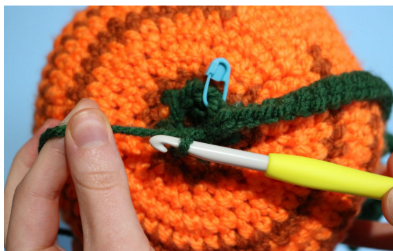
6. Oś w ppo w następnym o (następnie zacznij liść B)