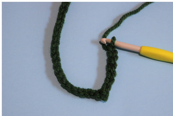
2. W drugie oł od szydełka, oś i 7 oł