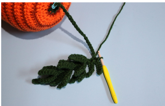
5. Powtórz krok #8 jeszcze 18 razy (w sumie 19 liści) zrób oś w pozostałych 20 oł