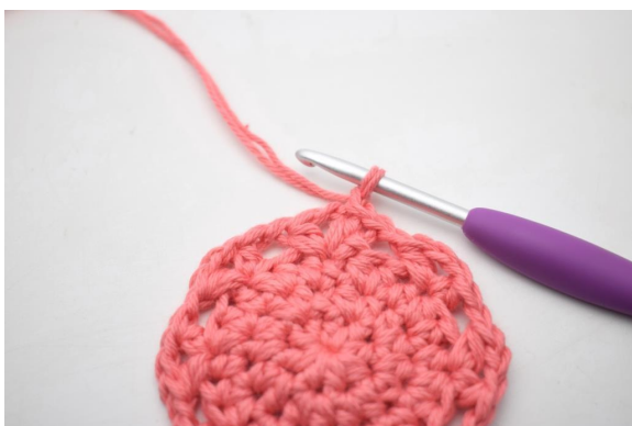
16. Zrób 1 oł.