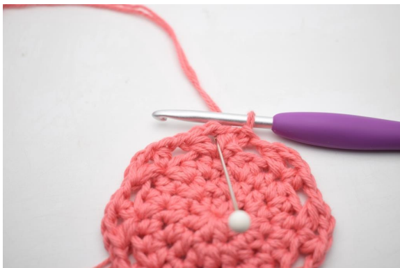
14. Zrób oś do pierwszego oł-łuku.