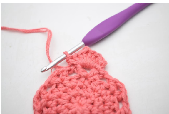
18. W ten sposób.