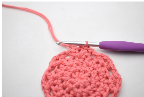
15. W ten sposób.