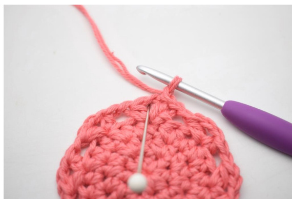
17. "Szydełkuj 4 psn, 1 oł i 4 psn w oł-łuku".