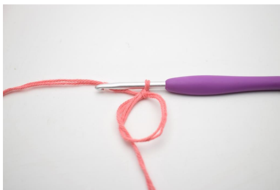
1. Zrób mr i zrób 1 oł.