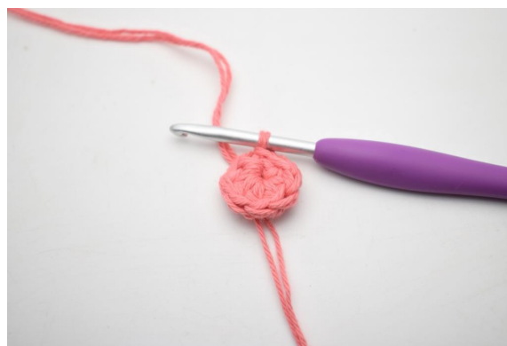
2. Szydełkuj 8 psn w kółeczku. Zakończ 1 oś. (8)