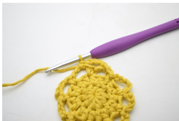
16. W ten sposób.