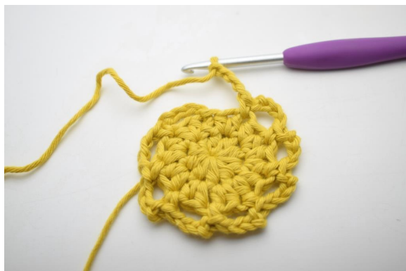
10. Powtórz "do" w okrążeniu.