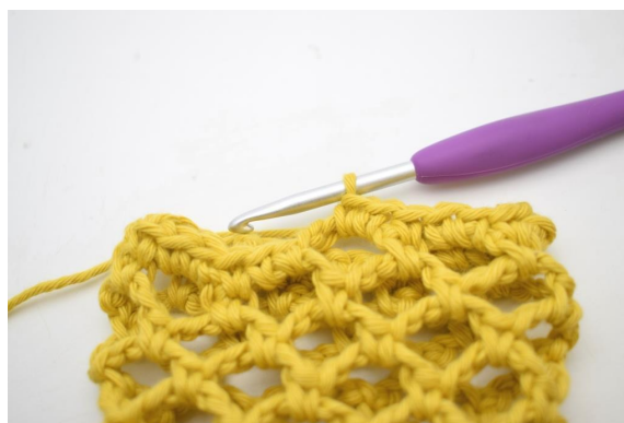
29. “Szydełkuj 1 psł w następnym o, szydełkuj 2 psł w kolejnym łuku”.