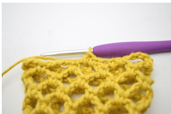
28. Szydełkuj 2 psł w kolejnym łuku”.