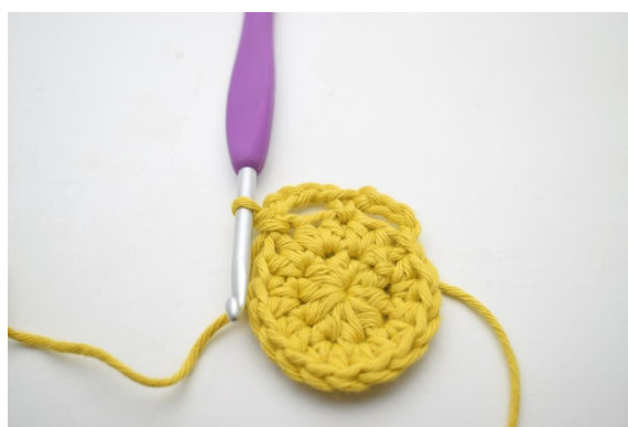
9. W ten sposób.