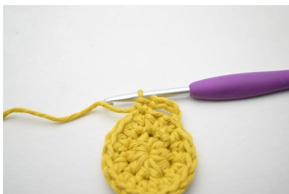
6. W ten sposób.