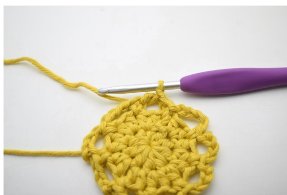
14. W ten sposób.