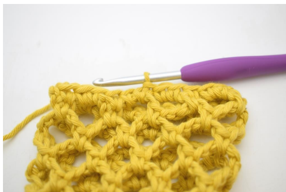
30. Powtórz “do” w okrążeniu. Zakończ 1 oś. (26)