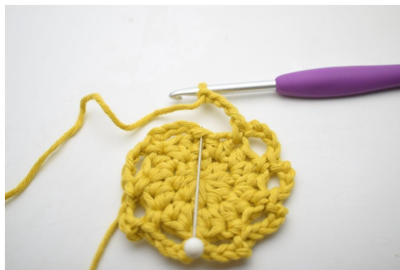
11. Zakończ 1 oś.