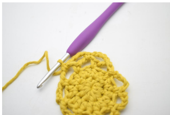
18. W ten sposób.