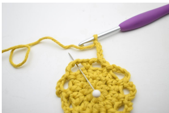
15. "Zrób 4 oł, szydełkuj 1 psł w następnym łuku".