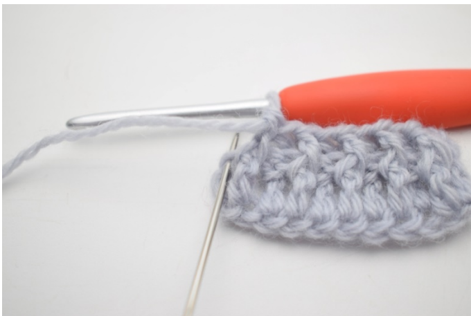
9. Szydełkuj 1 zwykły sł w ostatnim o.