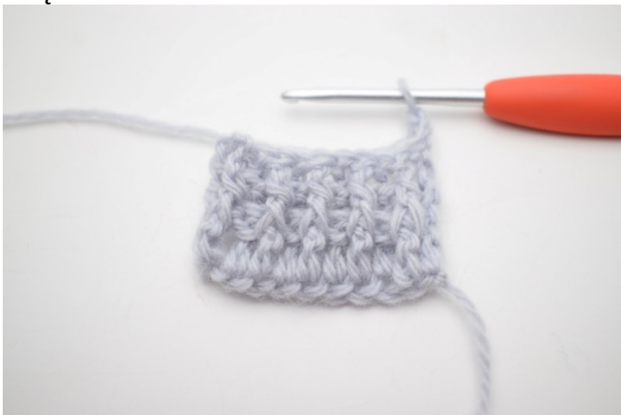
1. Ten rząd należy szydełkować jak rząd 2. Odwróć 3 oł.