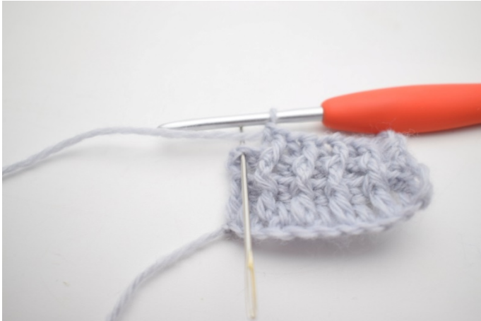
9. Szydełkuj 1 zwykły sł w ostatnim o.