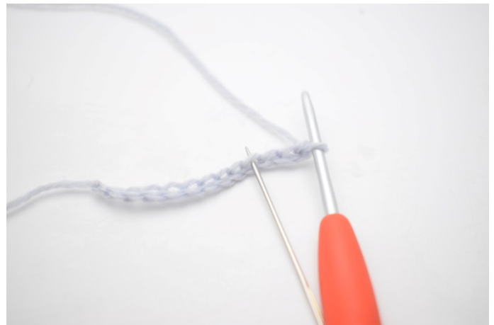
2. Szydełkuj 1 sł w 4. oł od szydełka.