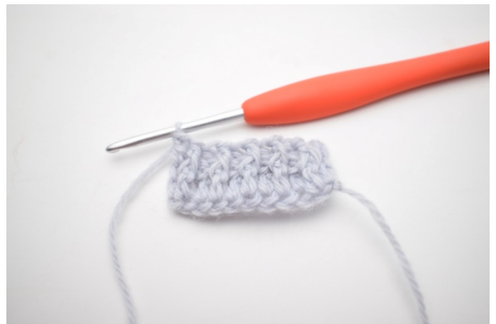
10. W ten sposób.