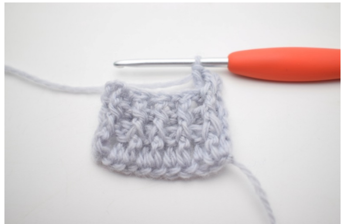
2. „Szydełkuj 1 słrp wokół pierwszego o, szydełkuj 1 słrt wokół następnego o”.