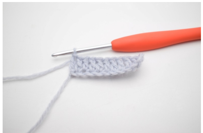
4. Szydełkuj sł do końca rzędu. (23)