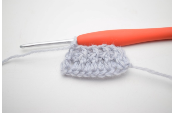
8. Szydełkuj 1 słrp wokół następnego o.