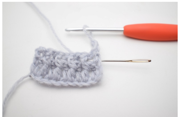
2. Szydełkuj 1 słrt wokół pierwszego o. Igła wskazuje, jak należy wykonać słrt wokół podstawy sł poprzedniego rzędu.