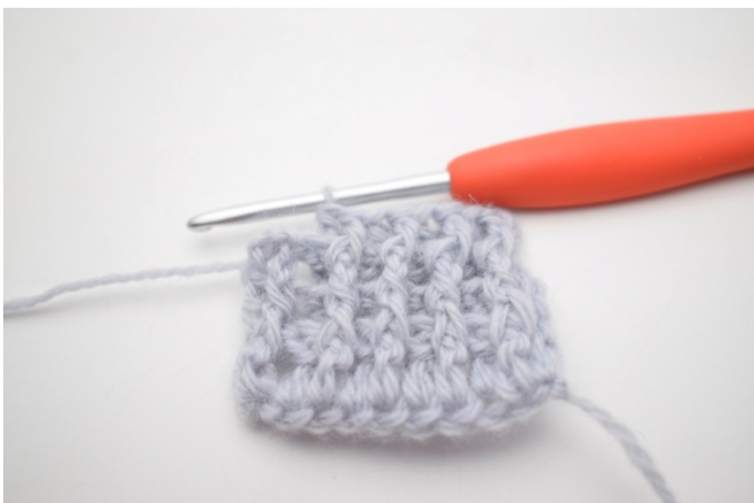
3. Powtórz „do” aż zostaną 2 o.