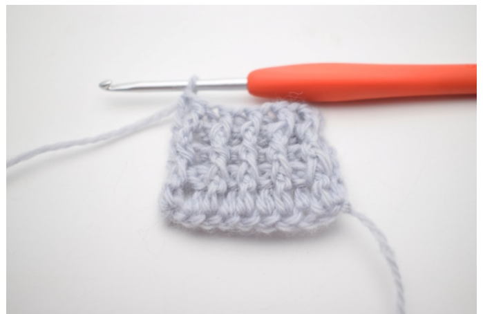
4. Szydełkuj 1 słrp wokół następnego o. Szydełkuj 1 zwykły sł w ostatnim o.