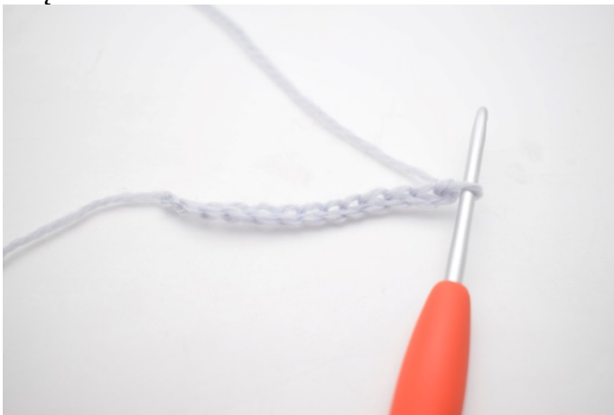
1. Zrób 25 oł.