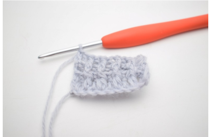
10. W ten sposób.