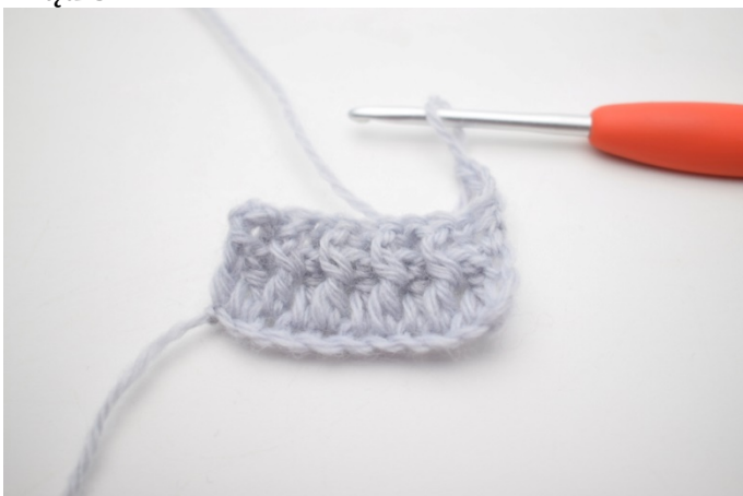
1. Odwróć 3 oł.