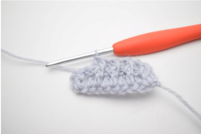
7. Powtórz „do” aż zostaną 2 o.