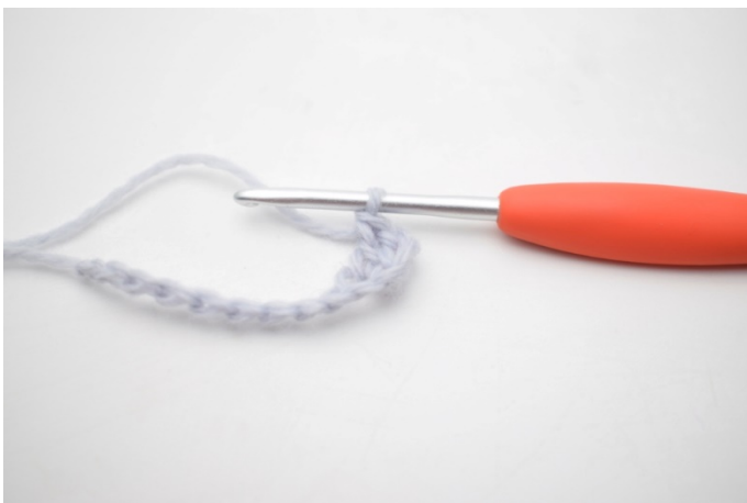
3. W ten sposób.