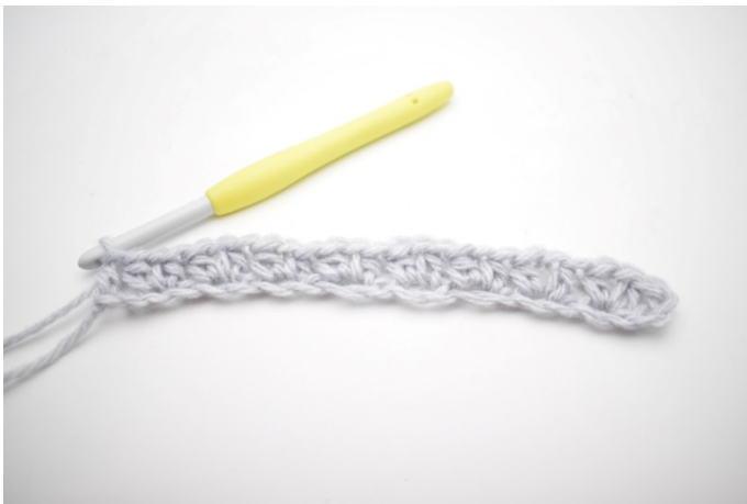
11. To był pierwszy rząd.