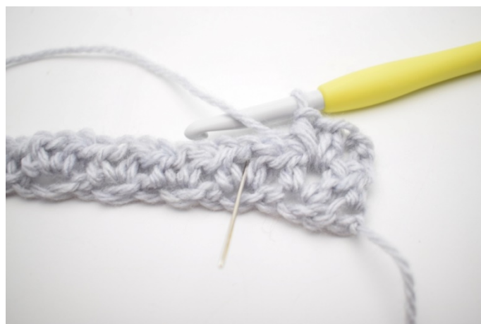
4. „Szydełkuj 1 psn, 1 oł i 1 psn w następnym oł-łuku.”