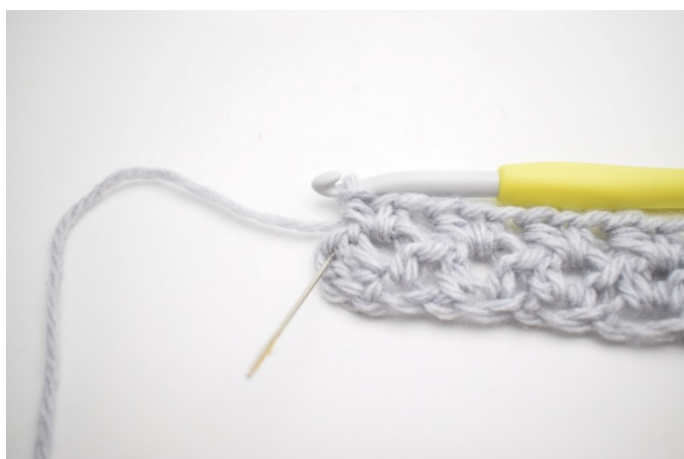
7. Szydełkuj 1 psn w ostatnim o.