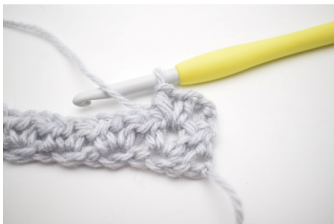
3. W ten sposób.