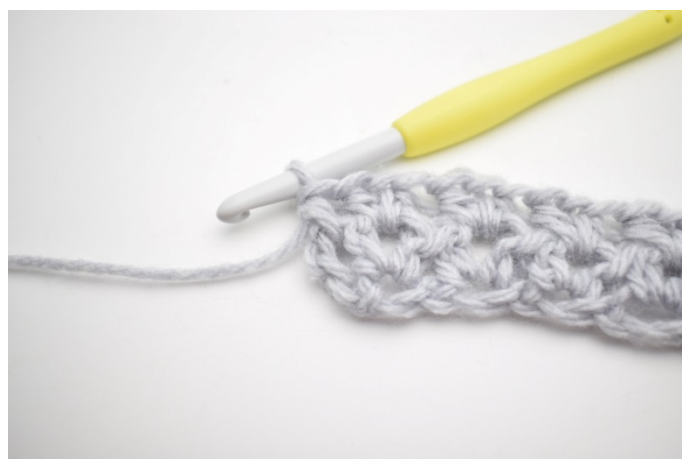
8. W ten sposób.