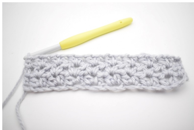
6. To był rząd 3.