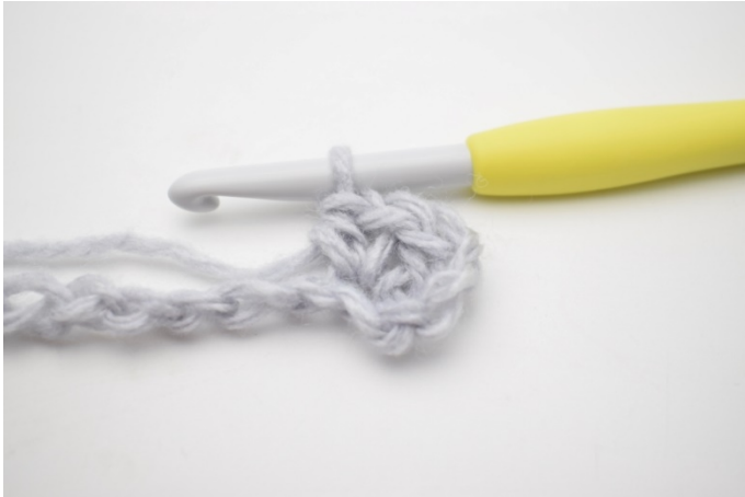
3. W ten sposób.