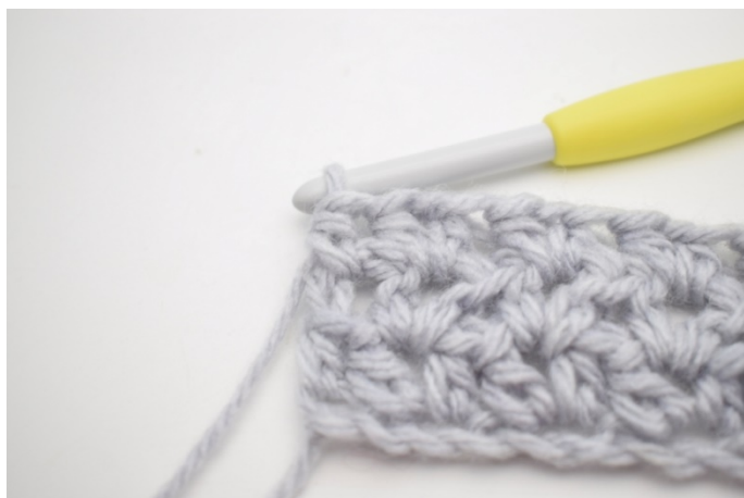
5. W ten sposób.