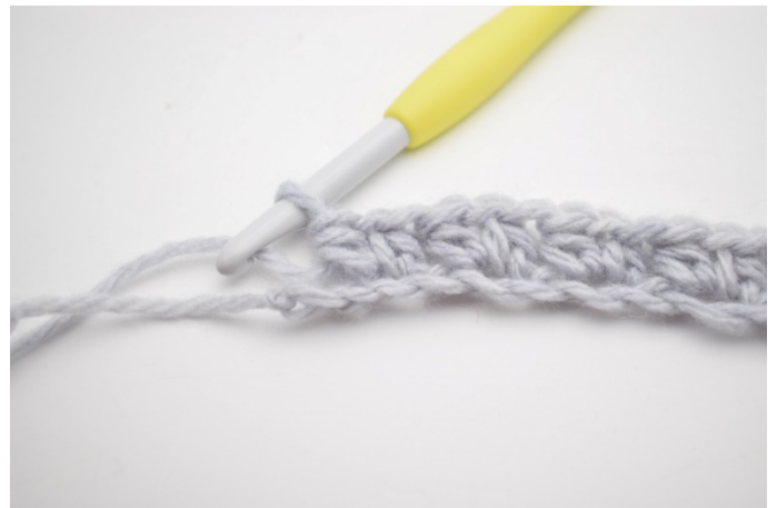
8. „Omiń 1 oł. Szydełkuj 1 psn, 1 oł i 1 psn w następnym oł”. Powtórz od „do”, aż zostaną 2 oł.