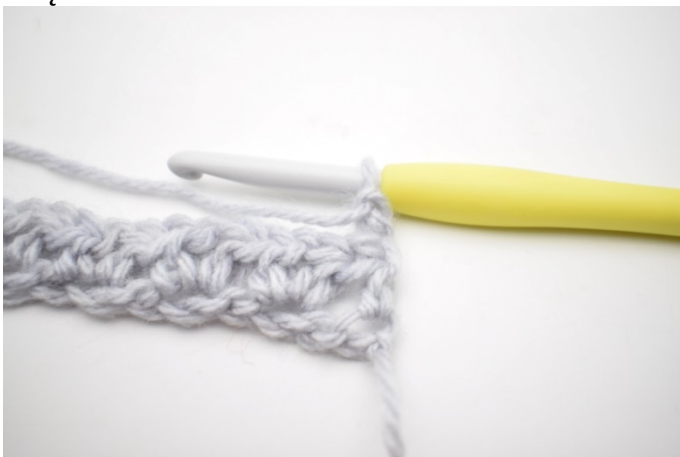
1. Odwróć robótkę 2 oł.