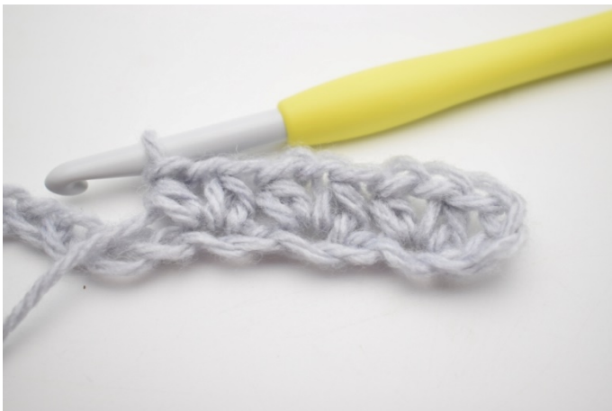
7. Szydełkuj 1 psn, 1 oł i 1 psn w następnym oł.