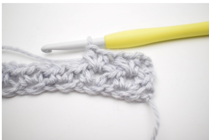
5. W ten sposób.