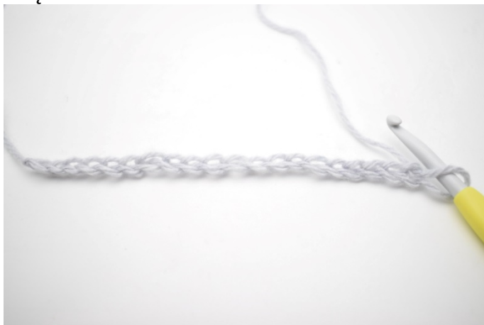
1. Wykonaj łańcuszek.