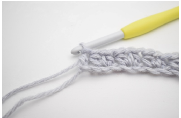
10. W ten sposób.