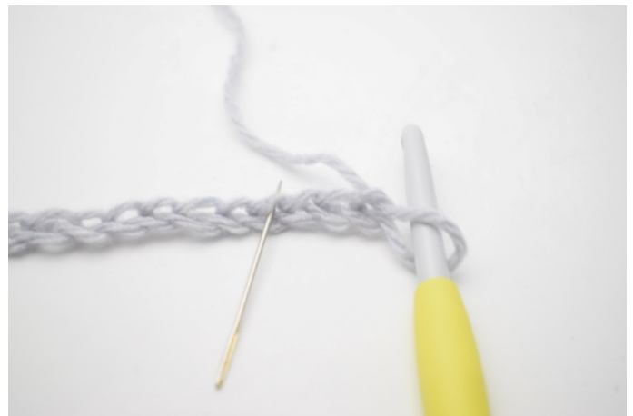
2. W 4.oł od szydełka wykonaj 1 psn, 1 oł i 1 psn. Igła wskazuje, w którym oł należy szydełkować.