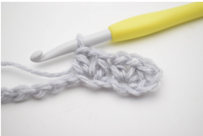
5. Szydełkuj 1 psn, 1 oł i 1 psn w następnym oł.