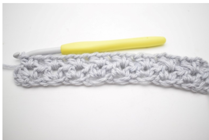
6. Powtórz od „do” do końca rzędu.