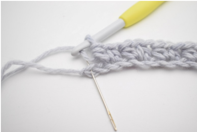
9. Omiń 1 oł i szydełkuj 1 psn w ostatnim o.