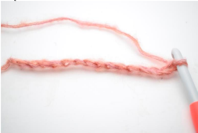
1. Wykonaj 180 oł.