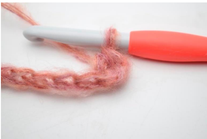
3. W ten sposób.