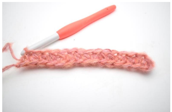
4. Szydełkuj psn do końca rzędu. (180)