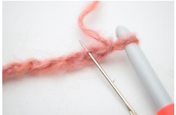
2. Odwróć łańcuszek i szydełkuj w pętelkach z lewej strony. Szydełkuj 1 psn w 2. pętelce od szydełka.