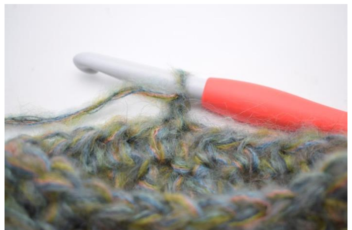
13. Odwróć robótkę.