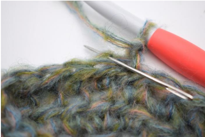
9. Szydełkuj psn w tpo w pierwszym o.