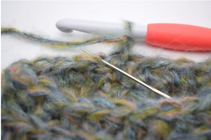
14. Szydełkuj psn w tpo w pierwszym o.