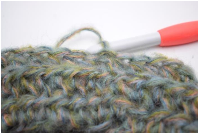
11. Szydełkuj psn w tpo w okrążeniu. Zakończ 1 oś w pierwszym psn. (58)