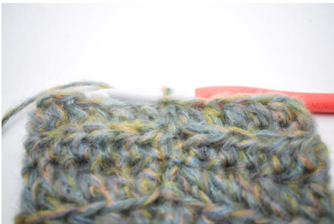
16. Szydełkuj psn w tpo w okrążeniu. Zakończ 1 oś w pierwszym psn. (58)