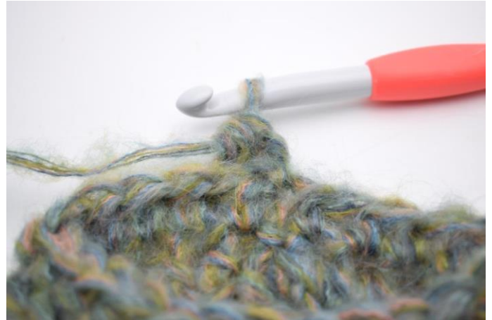
15. W ten sposób.