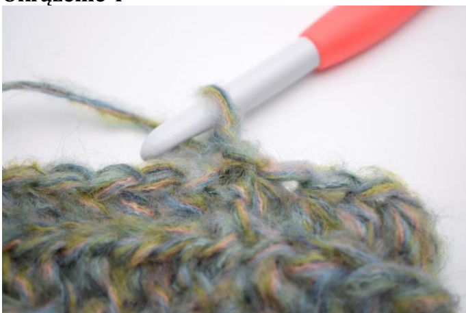
12. To okrążenie należy szydełkować jak okrążenie 3. Zrób 1 oł.