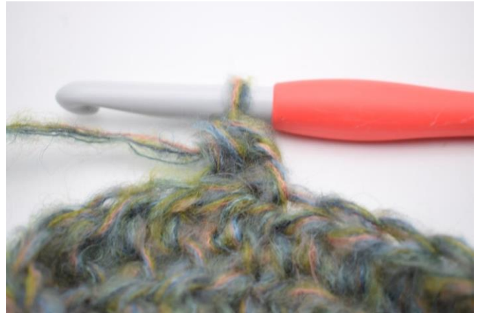
10. W ten sposób.