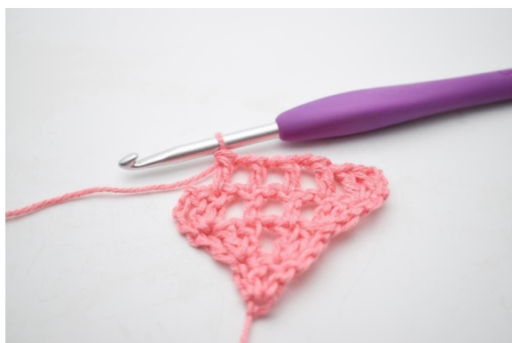
11. W ten sposób.