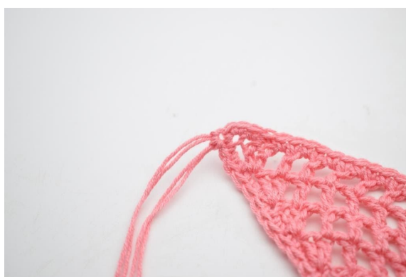
10. Delikatnie zaciągnij.