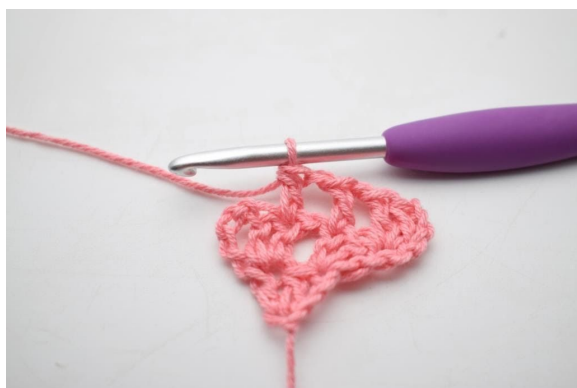
7. W ten sposób.