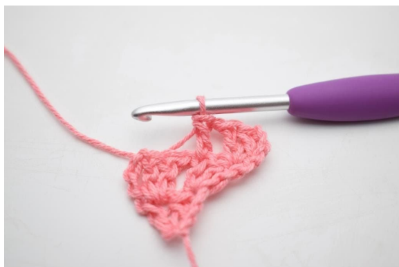
5. W ten sposób.