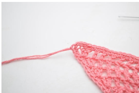
6. Delikatnie zaciągnij.