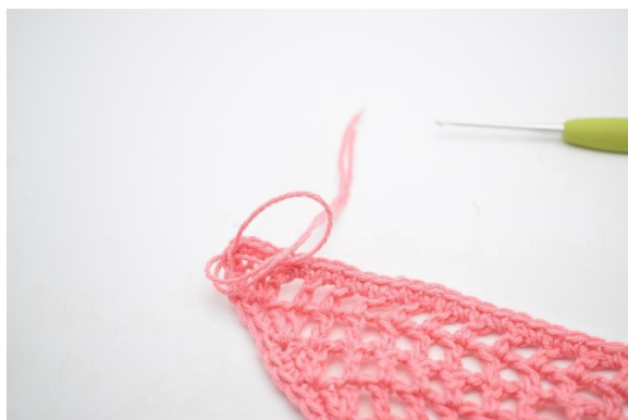
5. Przelóż końce włóczki przez pętelkę.