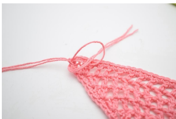
9. Przelóż końce włóczki przez pętelkę.