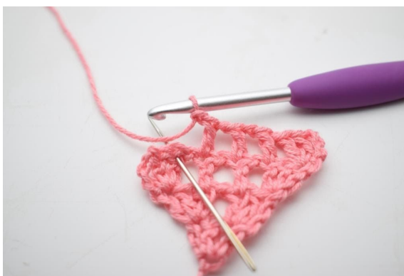
10. "Zrób 1 oł, omiń 1 o i szydełkuj 1 sł w następnym o".