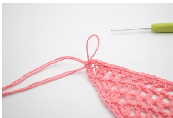
8. Przeciągnij włóczkę przez oczko, aby powstała pętelka.