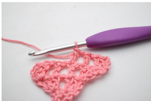
7. W ten sposób.