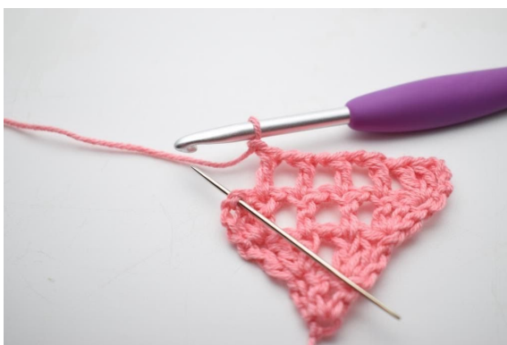
12. Zrób 1 oł, omiń 1 o i szydełkuj 3 sł w ostatnim o.