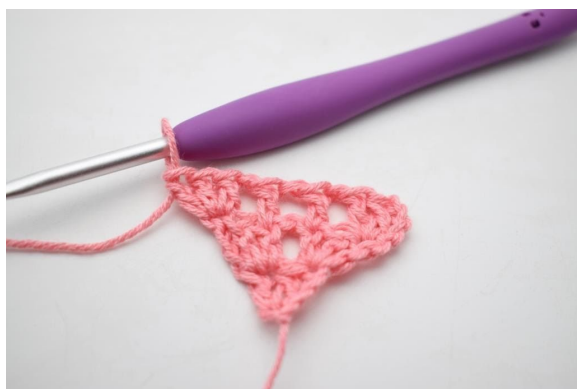
9. W ten sposób. (11)