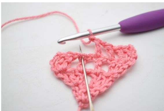
8. "Zrób 1 oł, omiń 1 o i szydełkuj 1 sł w następnym o".