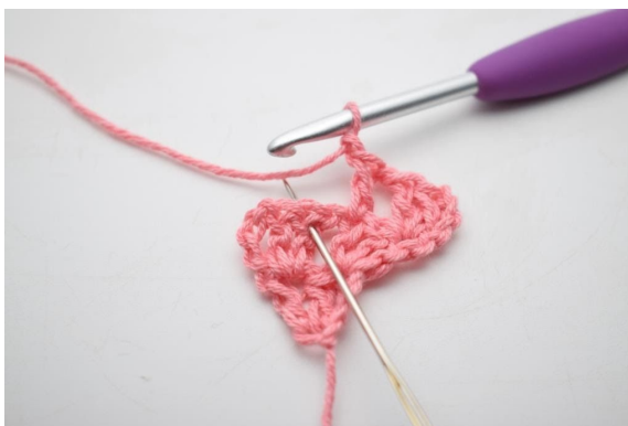
6. "Zrób 1 oł, omiń 1 o i szydełkuj 1 sł w następnym o".