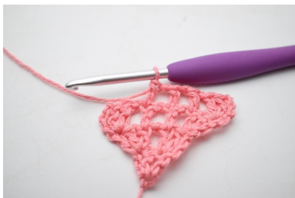
9. W ten sposób.