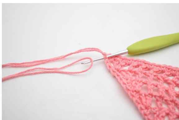
7. Aby frędzle były dość gęsto należy cały czas montować "2 frędzle w pierwszym o, 1 frędzel w następnym o". Dlatego należy teraz zamontować jeszcze jeden kawałek włóczki w tym samym oczku. Wsadź szydełko i złóż włóczkę na środku.