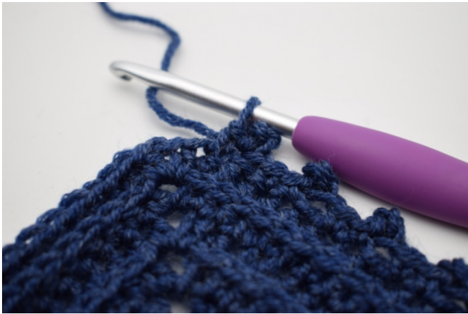
Powtarzaj od” do” w sumie 59 razy.