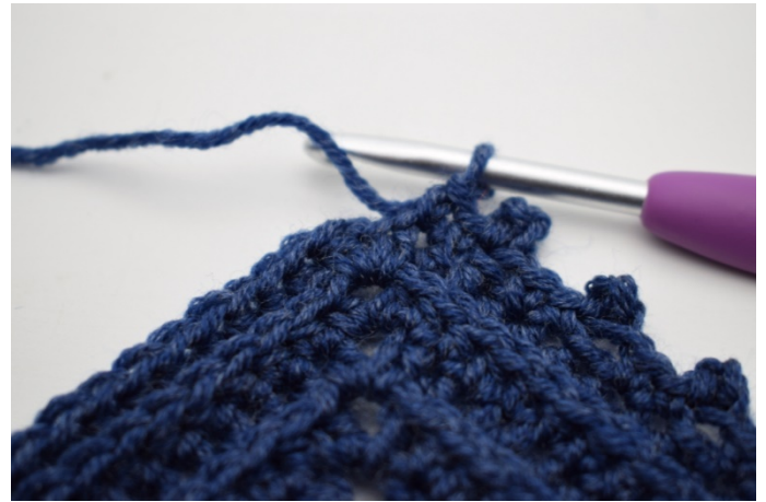
19. Wykonaj 1 psł. w ostatnim o.