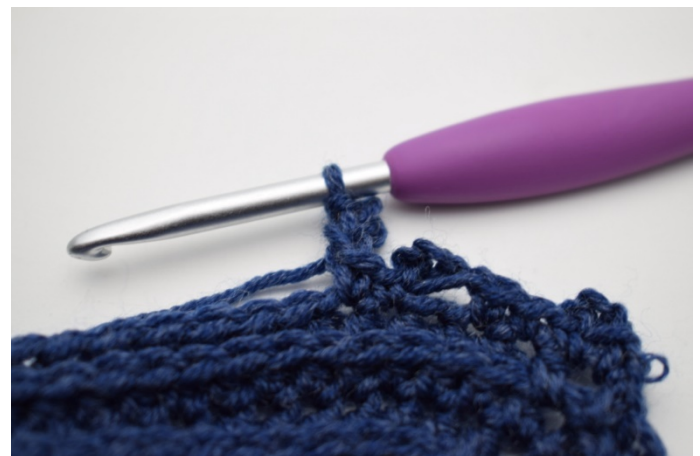
16. Wykonaj 1 oś. w 1. oł.