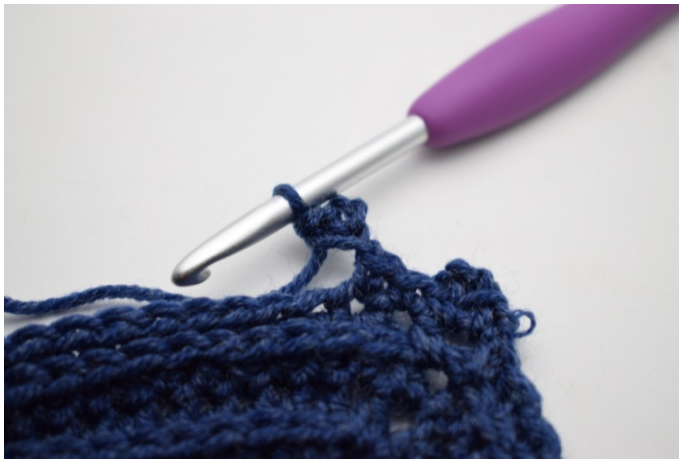
11. W ten sposób.