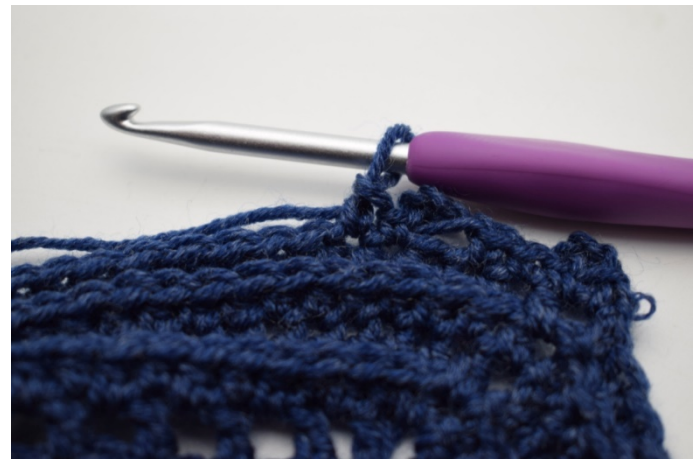
14. ”Wykonaj 1 psł. w następnym o.