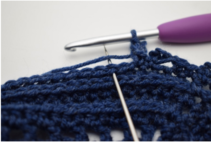
17. Omiń 1 o. i wykonaj 1 psł. w następnym o”.