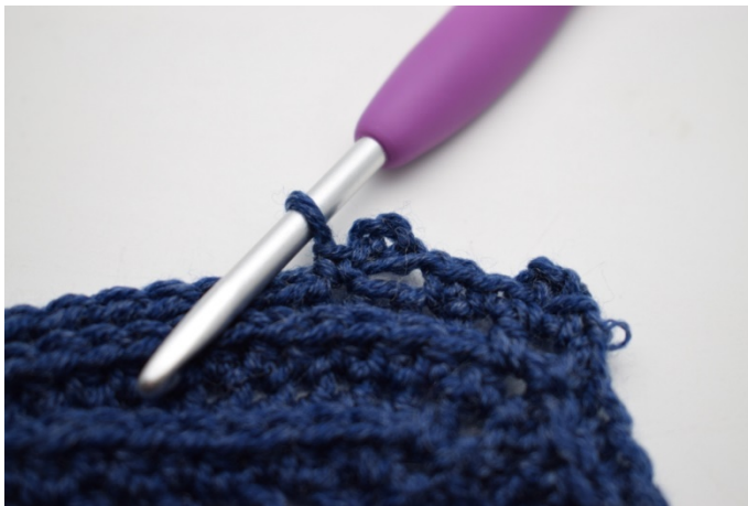
13. W ten sposób.