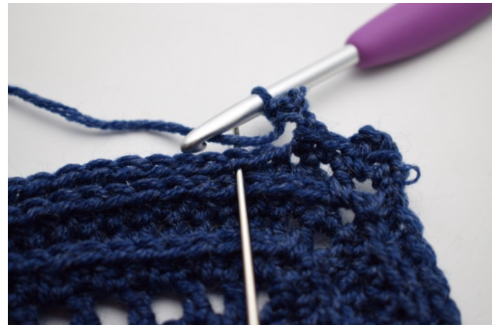
12. Omiń 1 o. i wykonaj 1 psł. w następnym o.”.