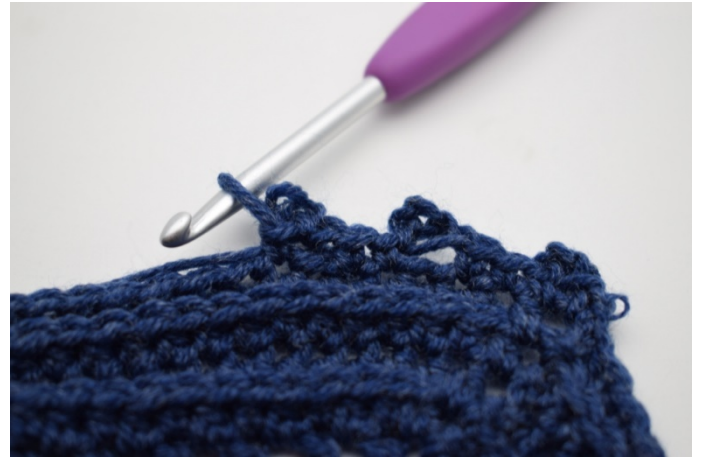
18. W ten sposób.