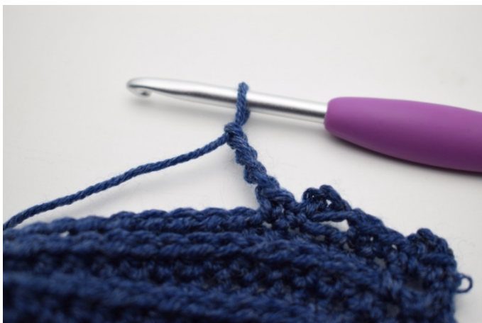
15. Zrób 4 oł.