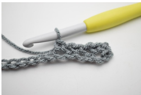
7. W ten sposób.