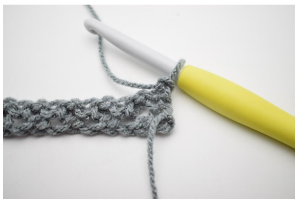
1. Odwróć 2 oł.