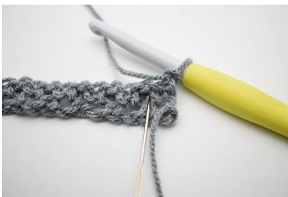
2. Szydełkuj 1 psł w pierwszej oł-przerwie.