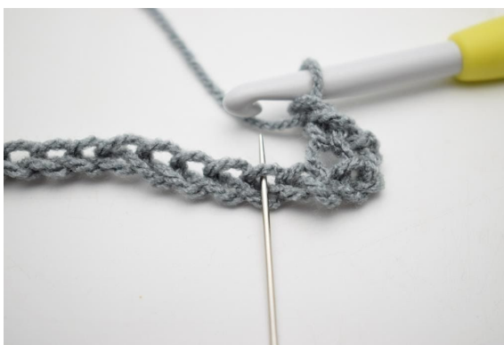
4. „Zrób 1 oł, omiń 1 oł i szydełkuj 1 psł w następnym o”.