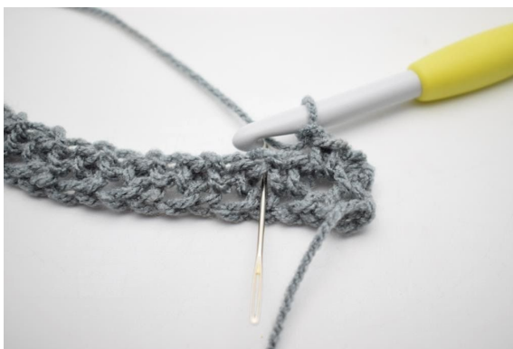
4. „Zrób 1 oł i szydełkuj 1 psł w następnej oł-przerwie”.