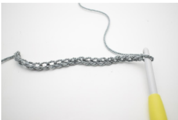
1. Wykonaj 232 oł.