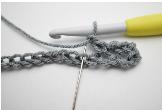
6. „Zrób 1 oł, omiń 1 oł i szydełkuj 1 psł w następnym o”.