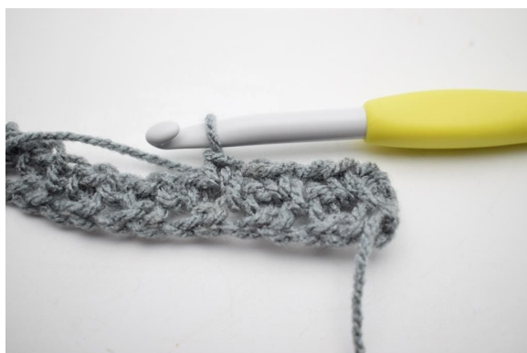
7. W ten sposób.