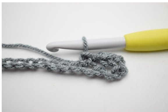
5. W ten sposób.