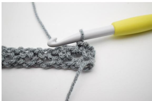
3. W ten sposób.