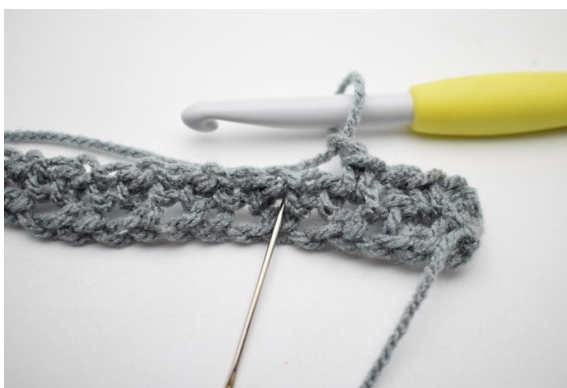
6. „Zrób 1 oł i szydełkuj 1 psł w następnej oł-przerwie”.