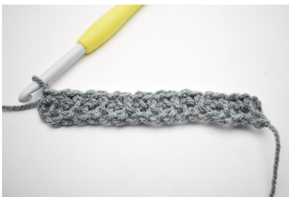
8. Powtórz „do” do końca rzędu.