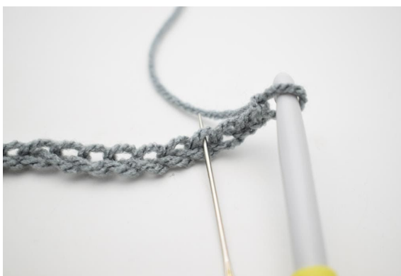
2. Szydełkuj 1 psł w 4. oł od szydełka.