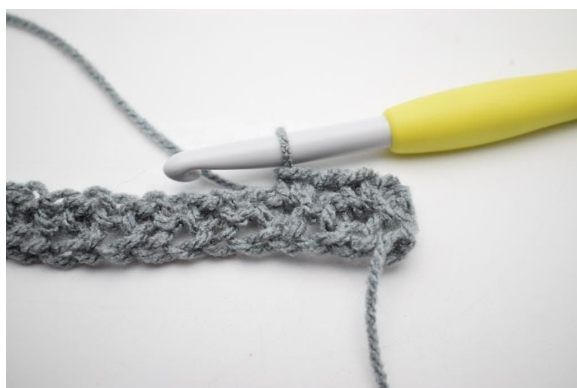
5. W ten sposób.