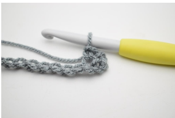
3. W ten sposób.