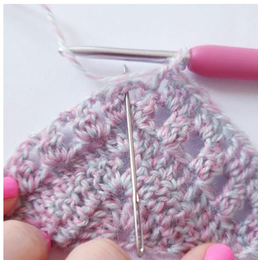
W szpicu: [2 sł, 2 oł, 2 sł]