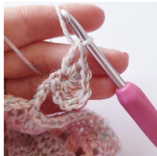
1 ot, 1 st.2,