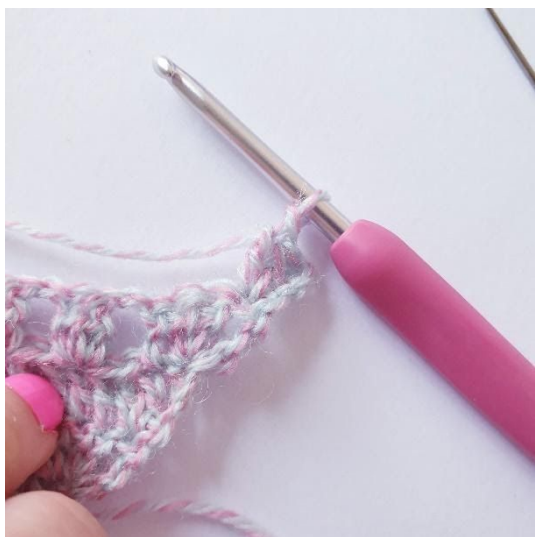
2 sł w pierwszym o