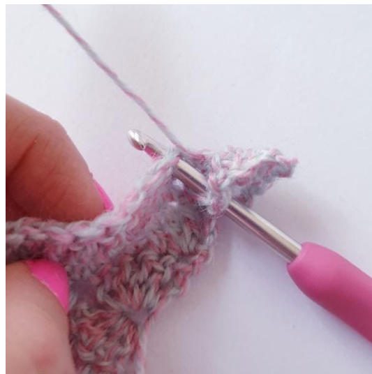
3-sł-bufka [Nawiń włóczkę na szydełko i wbij się w oczko,