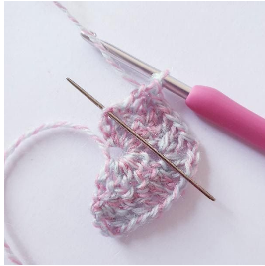
[2 sł, 1 sł.2] w oz.