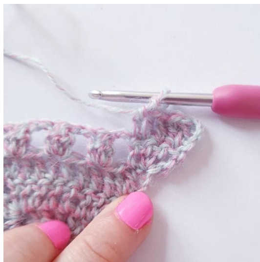
1 sł w następnych 3 o