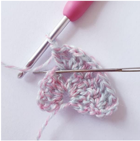
1 sł w następnych 4 o