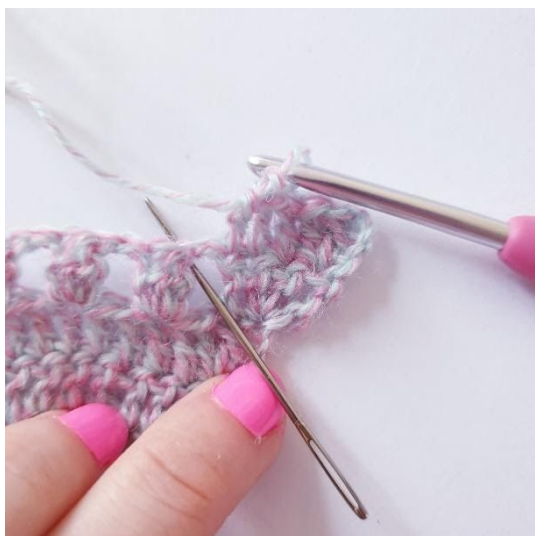
2 sł w łuku, 1 sł następnym sł, powtarzaj aż do szpica