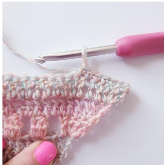
1 psł w następnych 6 o,