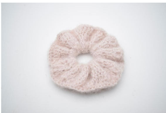
6. Utnij włóczkę i zamocuj końce.