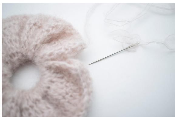
5. Zszyj końce razem.