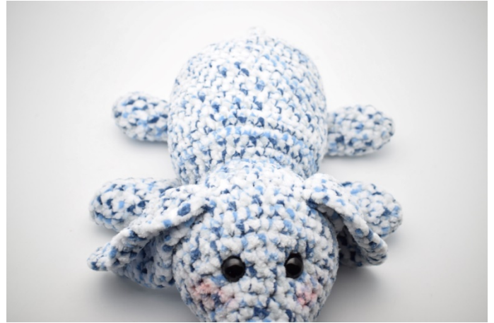
6. W ten sposób.