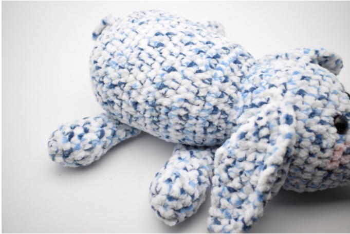
5. Przyszyj nogi pod brzuchem słonia.