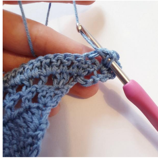
Bufka wokół poprzedniego sł*