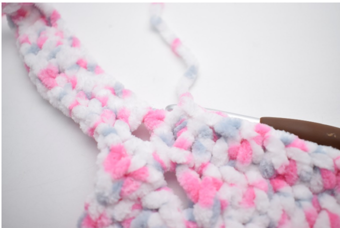
33. Powtarzaj „do” w sumie 3 razy. Szydełkuj 1 sł w ostatnich 79 o. Zakończ 1 oś w 3. oł.