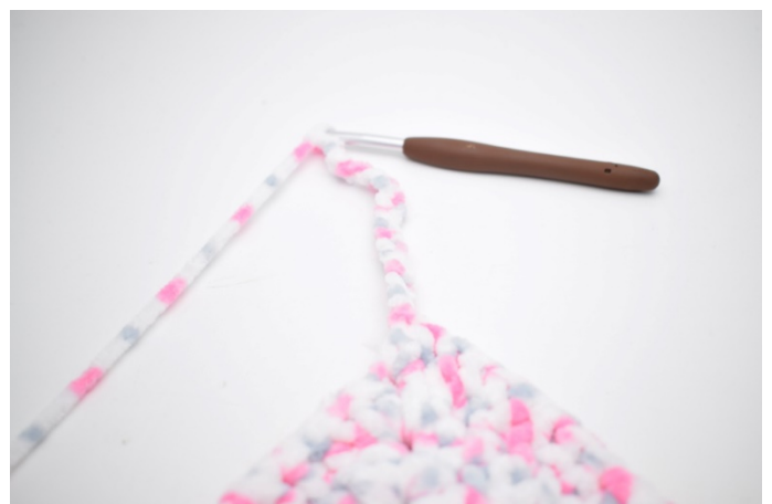
30. Zrób 17 oł. Szydełkuj 1sł w 3. oł od szydełka.