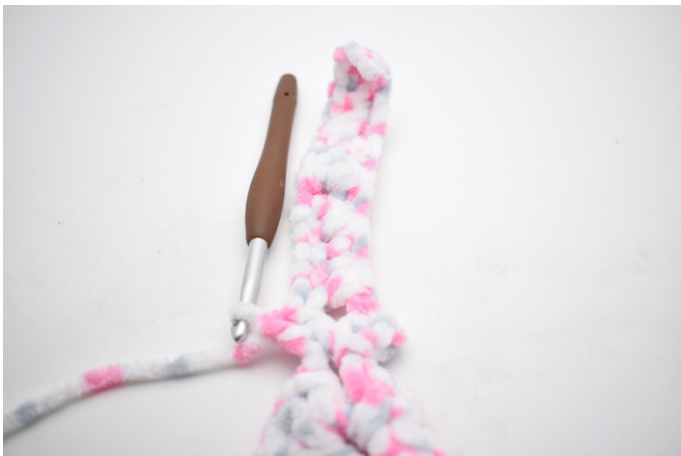
27. Szydełkuj 2 sł w łuku.