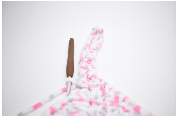
32. Szydełkuj 2 sł w łuku.”