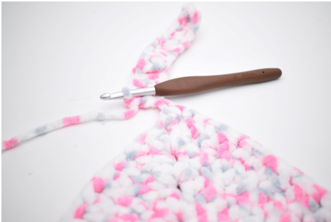
31. Szydełkuj sł we wszystkich oł.