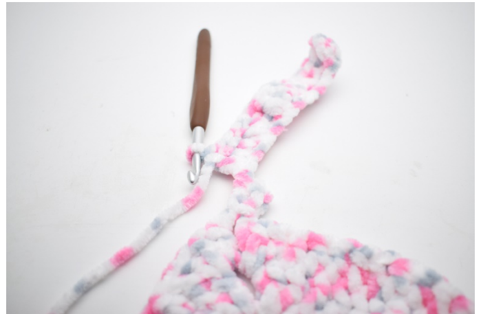
26. Szydełkuj sł we wszystkich oł.