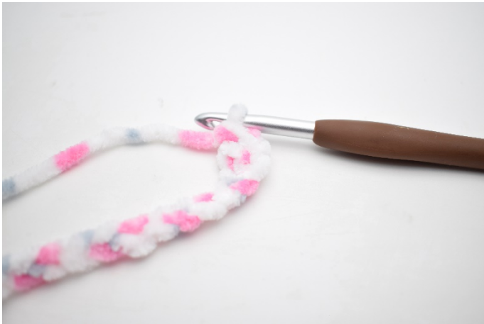
25. W ten sposób.