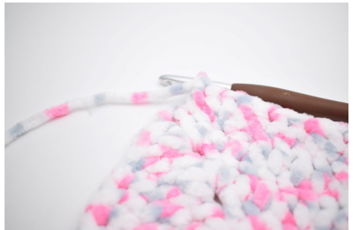
28. Szydełkuj "1 sł w następnych 79 o.