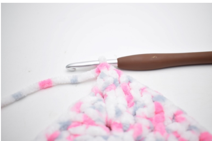
29. W łuku szydełkuj 2 sł.