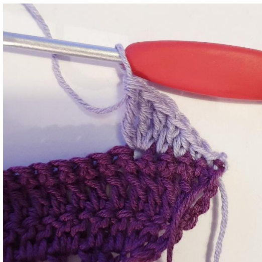
3 sł pod w tym samym o,