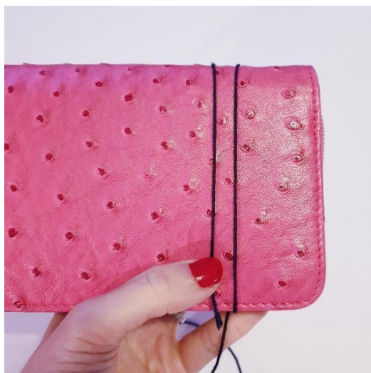
Owiń włóczkę wokół etui