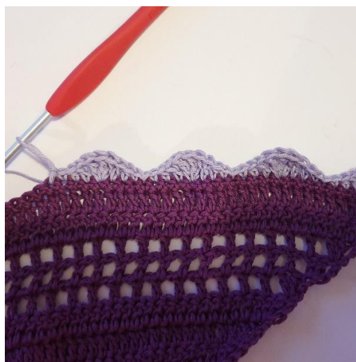
*1 psł, 1 psn, 1 sł, 3 sł pod w tym samym o, 1 sł, 1 psn, 1 psł, 1 oś* powtarzaj