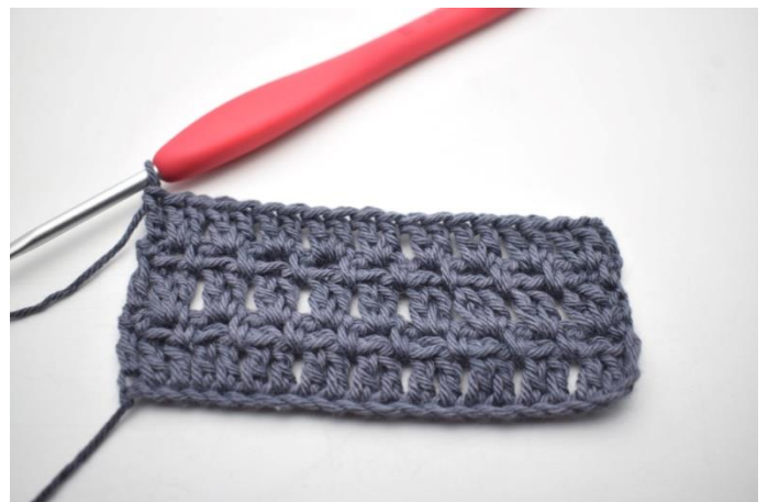
46. W ten sposób.