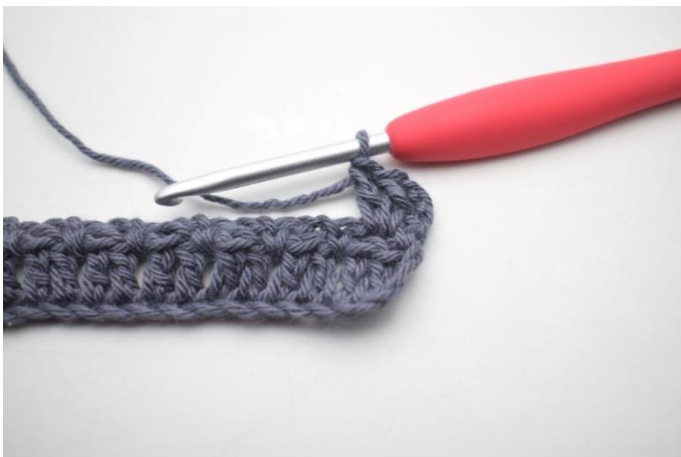
20. W ten sposób.