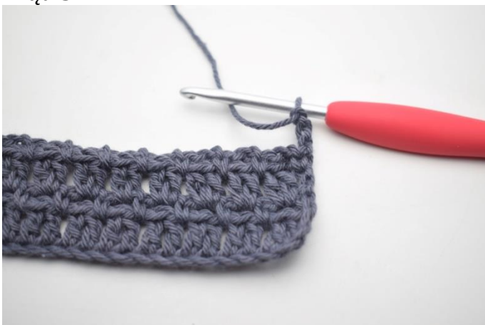
39. Szydełkuj jak rząd 3. Odwróć 3 oł.