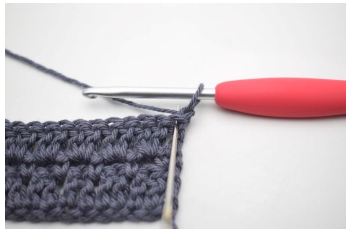
27. Szydełkuj 1 psł w pierwszym o.