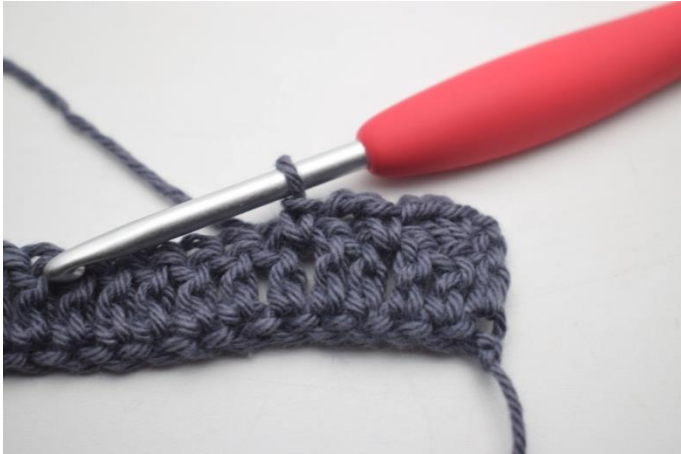
13. W ten sposób.