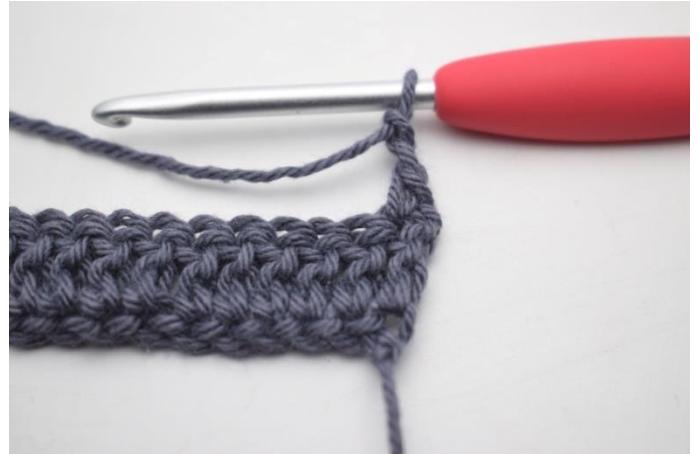
8. "Zrób 2 oł,