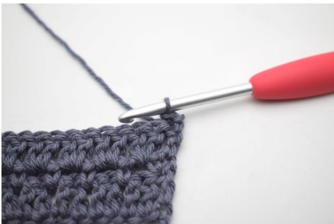
28. W ten sposób.