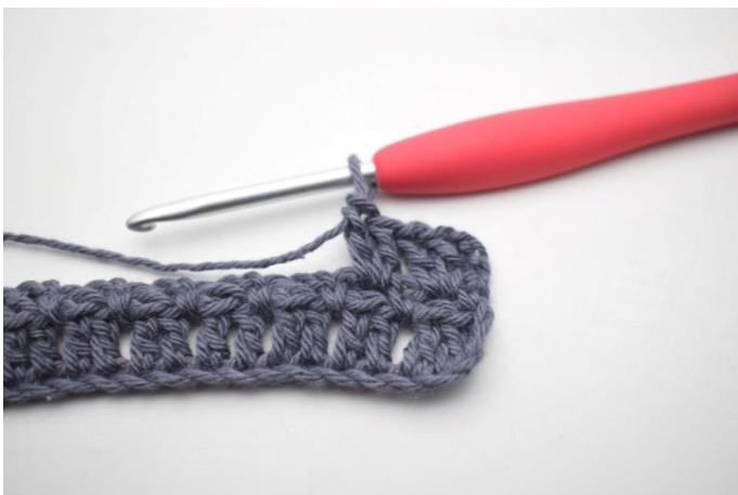
22. W ten sposób.