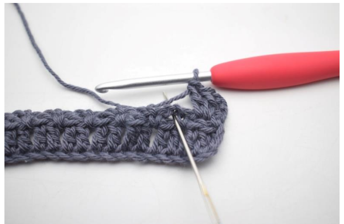
21. "Szydełkuj 2 sł w łuku".