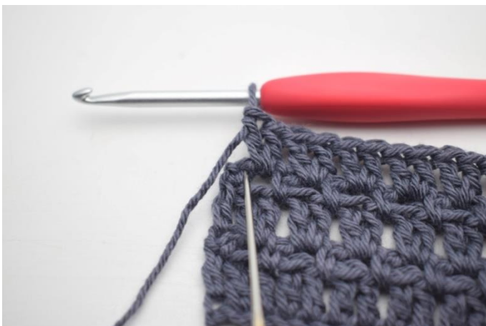
45. Szydełkuj 1 sł w ostatnim o. (68)