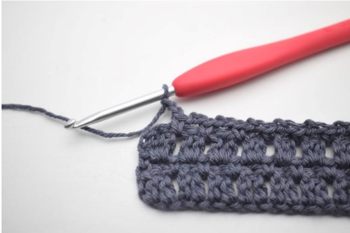
36. Zrób 2 oł,