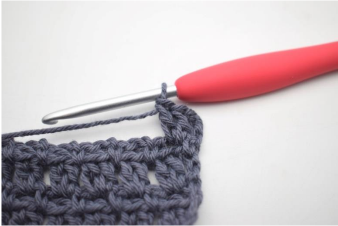
41. W ten sposób.