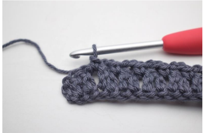
14. Powtarzaj „do” aż zostaną 3 o.