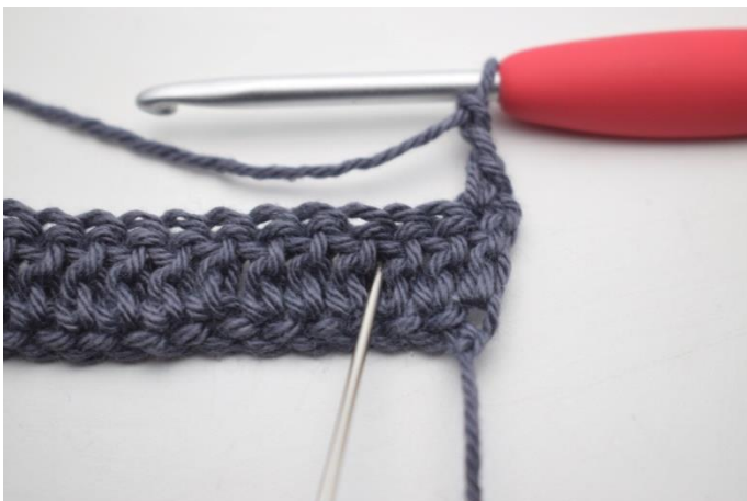
9. omiń 2 o i szydełkuj 1 psł pomiędzy następnymi 2 sł".