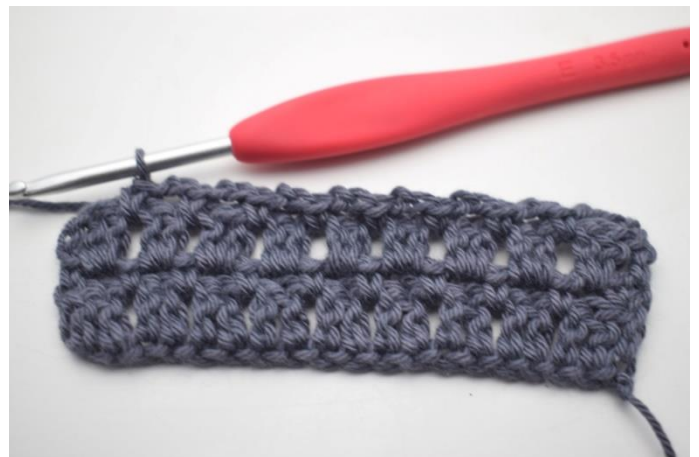
35. Powtarzaj „do” aż zostaną 3 o.