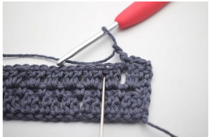
33. omiń 2 o i szydełkuj 1 psł pomiędzy następnymi 2 sł”.