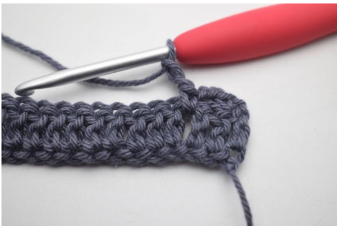
11. "Zrób 2 oł,