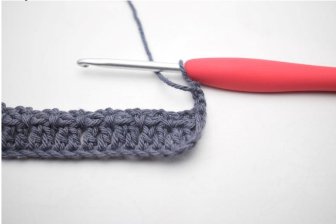
18. Odwróć 3 oł.