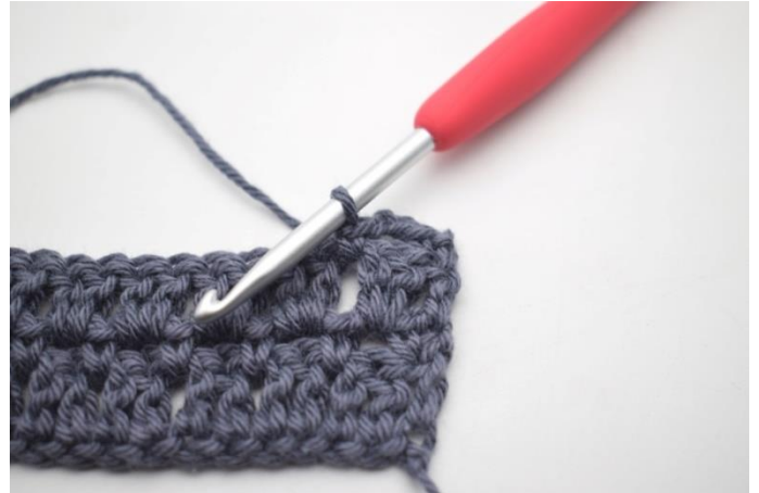
31. W ten sposób.