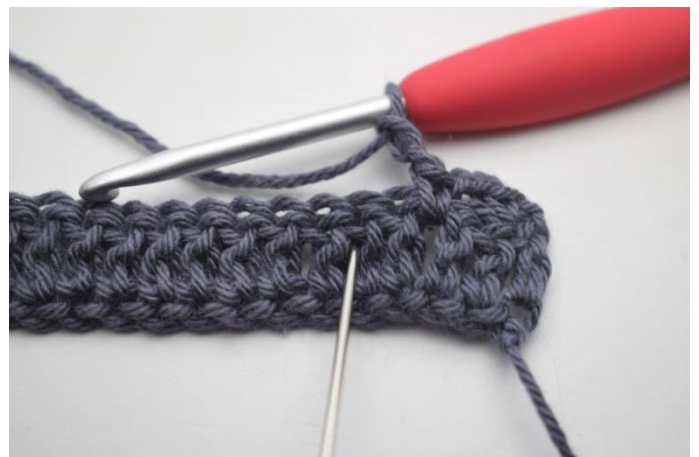
12. omiń 2 o i szydełkuj 1 psł pomiędzy następnymi 2 sł".