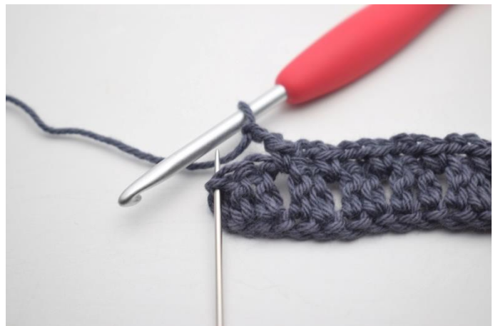
16. omiń 2 o i szydełkuj 1 psł w ostatnim o.