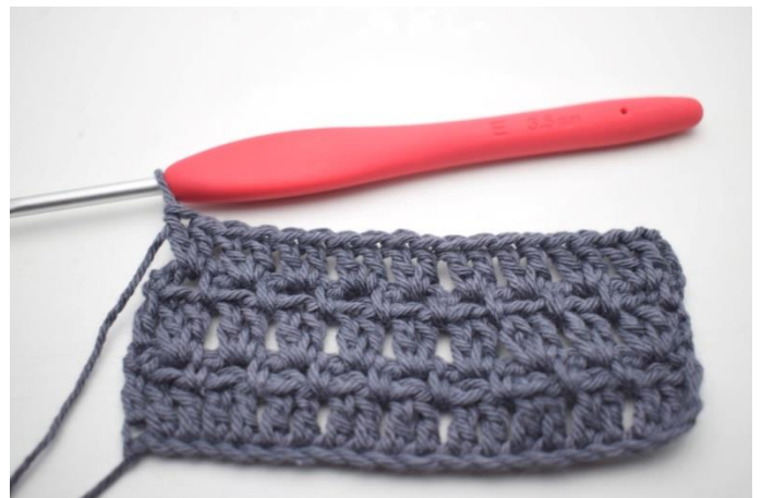
44. Powtarzaj "do" we wszystkich łukach.