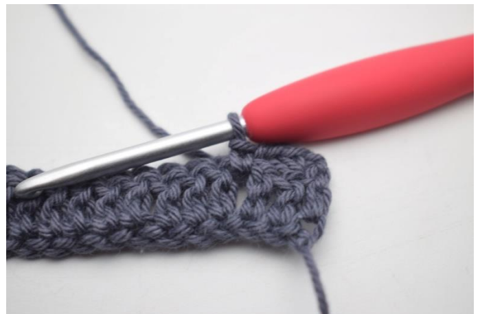
10. W ten sposób.