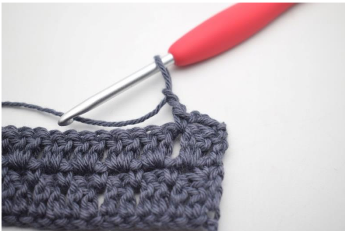
32. ”Zrób 2 oł,