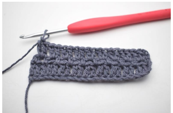
23. Powtarzaj „do” we wszystkich łukach.