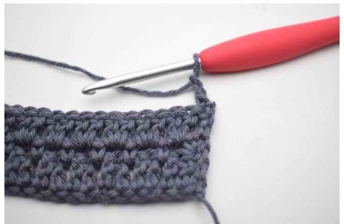
29. "Zrób 2 oł,