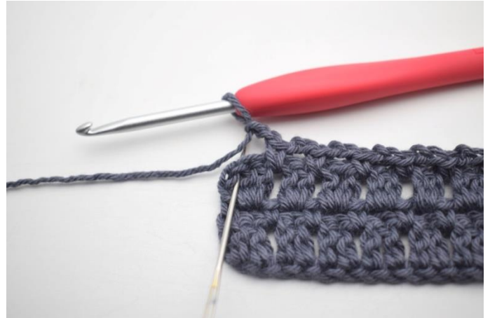
37. omiń 2 o i szydełkuj 1 psł w ostatnim o.