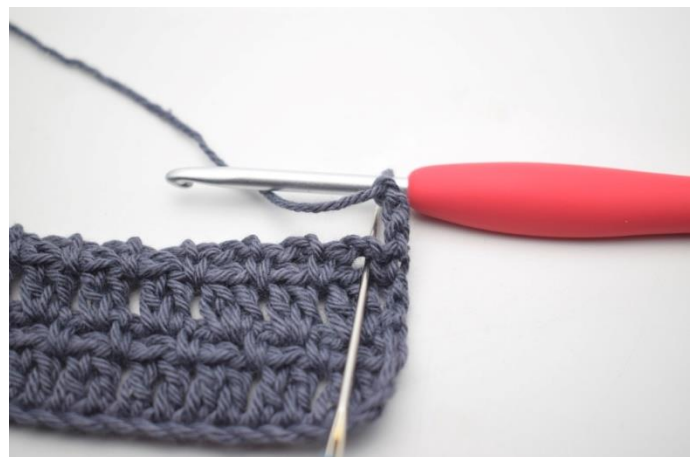
40. "Szydełkuj 2 sł w łuku".