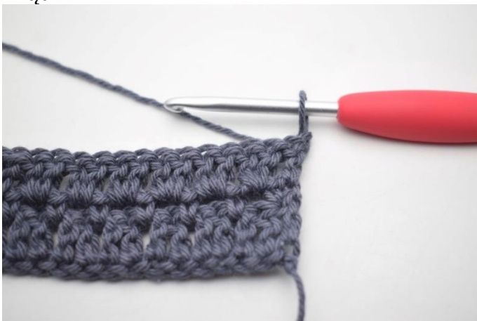
26. Szydełkuj jak rząd 2. Odwróć 1 oł.