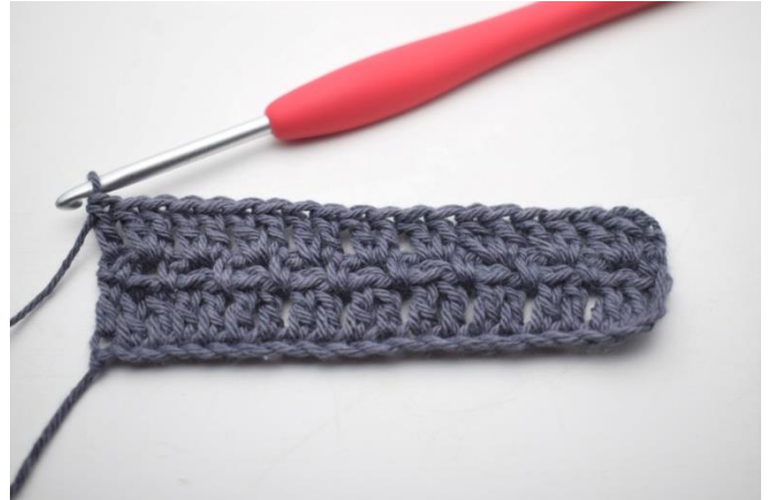
25. W ten sposób.