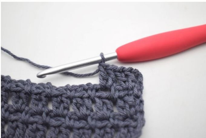
43. W ten sposób.