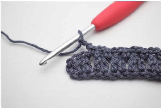
15. Zrób 2 oł,