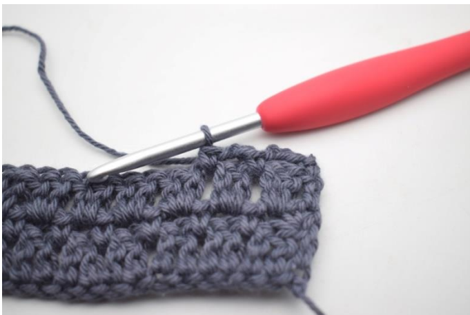
34. W ten sposób.