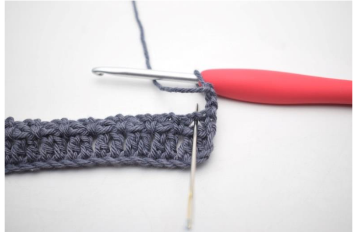
19. "Szydełkuj 2 sł w łuku".