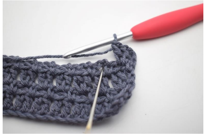
42. "Szydełkuj 2 sł w łuku".