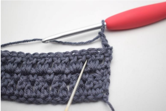
30. omiń 2 o i szydełkuj 1 psł pomiędzy następnymi 2 sł”.