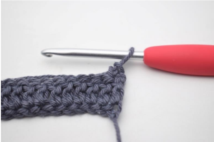
7. W ten sposób.