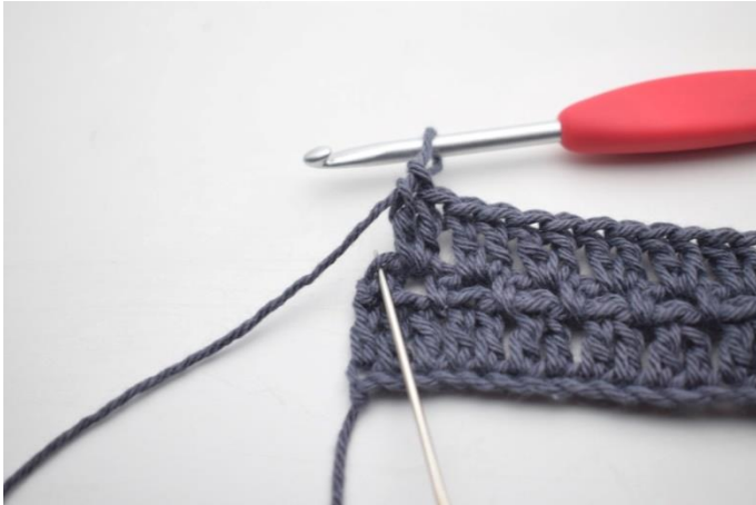
24. Szydełkuj 1 sł w ostatnim o. (68)