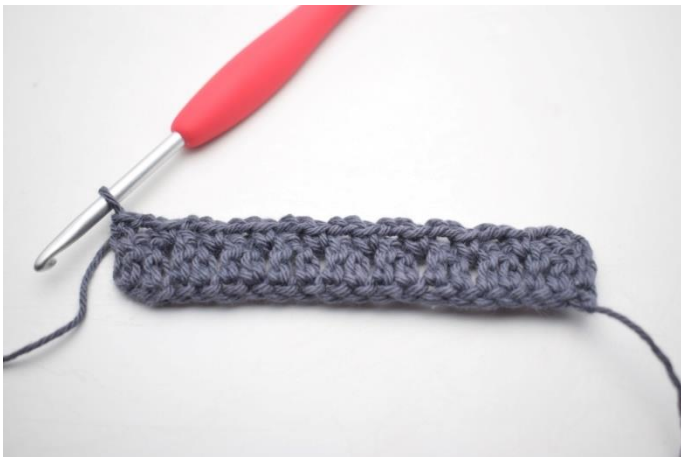
17. W ten sposób.