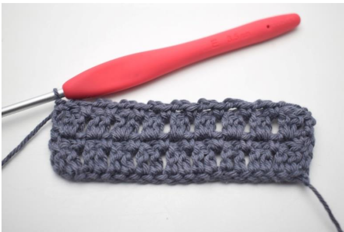
38. W ten sposób.