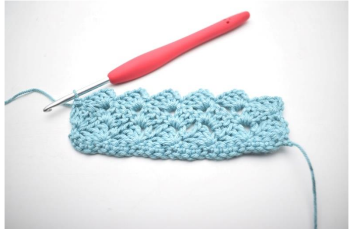
32. W ten sposób.