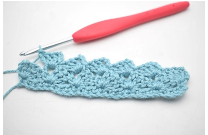
22. Powtórz „do” w sumie 13 razy.