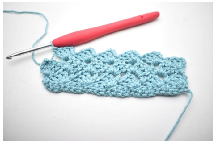
30. „Szydełkuj 1 psł, 3 oł i 3 sł w następnym łuku”. Powtórz „do” w sumie 13 razy.