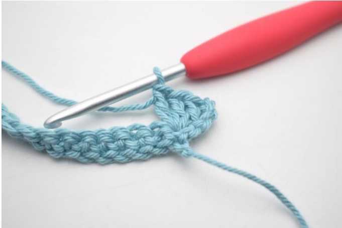
7. W ten sposób.