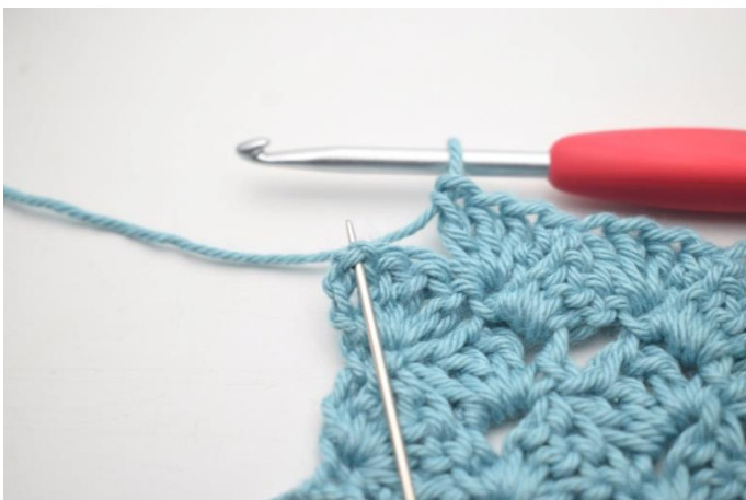
46. Szydełkuj 1 psł w ostatnim łuku.