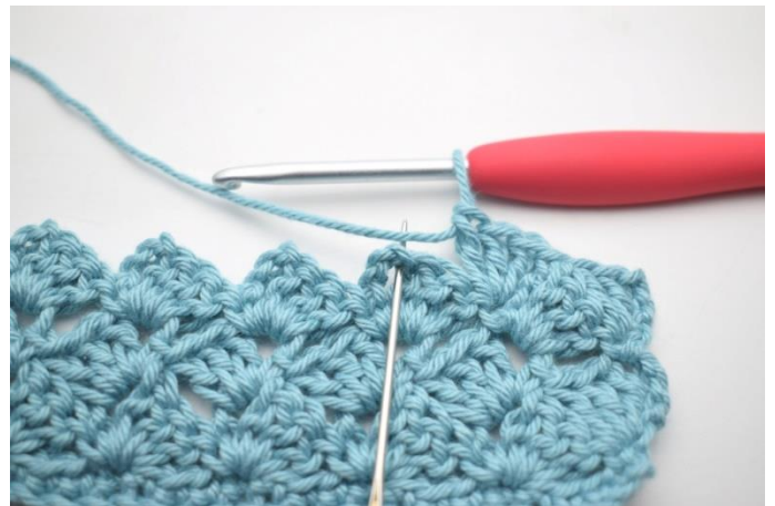
41. „Szydełkuj 1 psł w następnym łuku.”