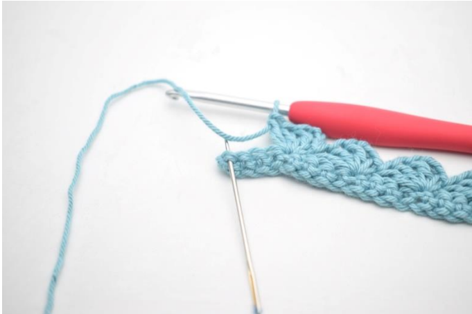
13. Omiń 3 o i szydełkuj 1 psł w ostatnim o.