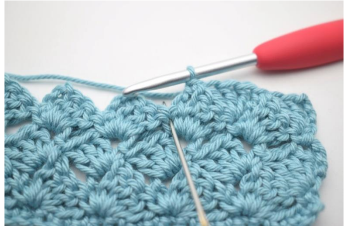
43. Szydełkuj 3 sł w psł poprzedniego rzędu”.