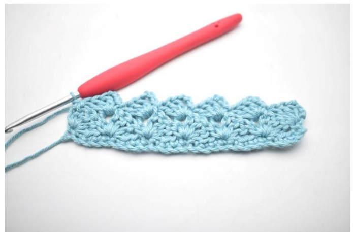
24. W ten sposób.