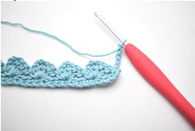
15. Odwróć 4 oł.