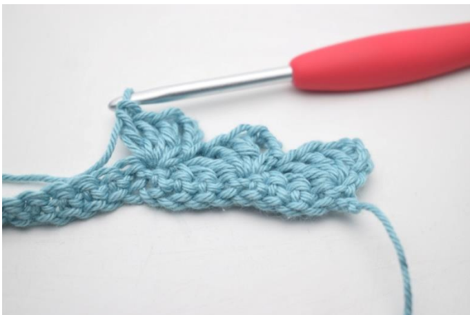
11. W ten sposób.