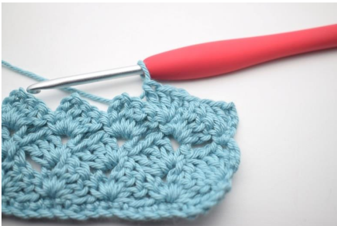
40. W ten sposób.