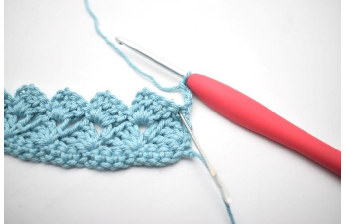
26. Szydełkuj 3 sł w pierwszym o.