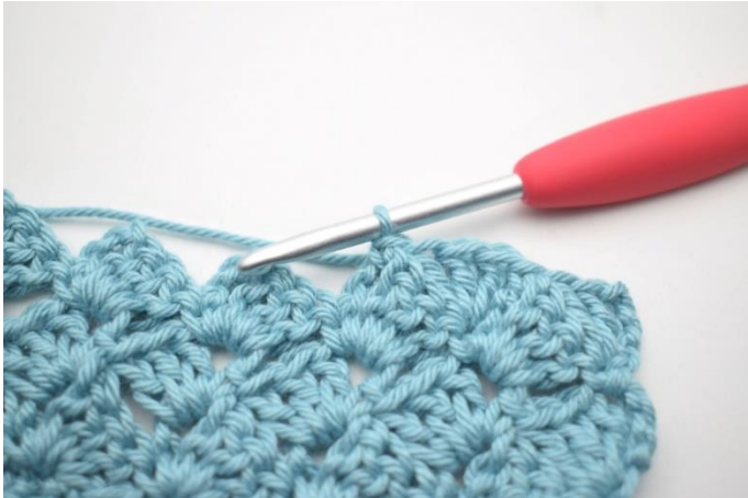
42. W ten sposób.