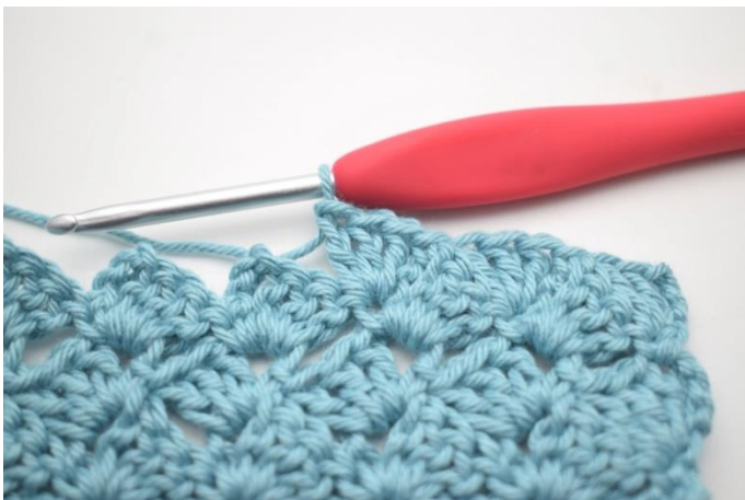
44. W ten sposób.