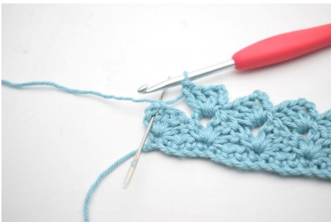
23. Szydełkuj 1 psł w ostatnim łuku.