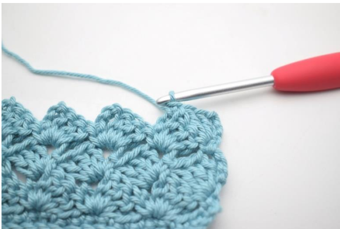
38. W ten sposób.