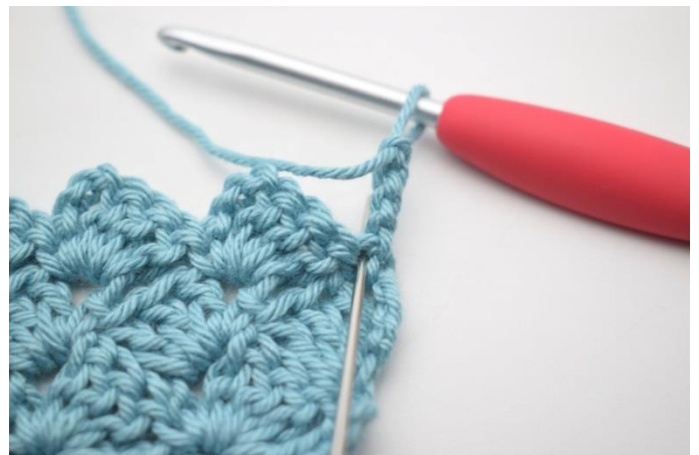
35. Szydełkuj 2 sł w pierwszym o.