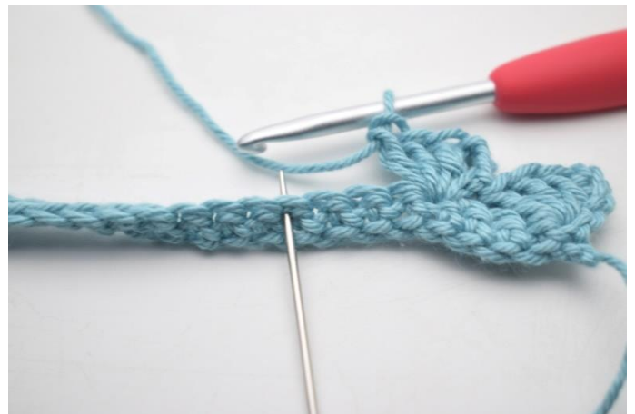
10. „Omiń 3 o, szydełkuj 1 psł, 3 oł i 3 sł w następnym o”.