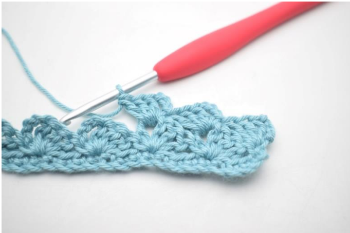
21. W ten sposób.