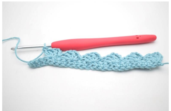
12. Powtarzaj „do” aż zostaną 4 o.