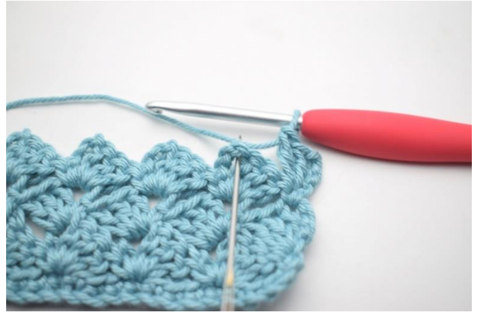
37. „Szydełkuj 1 psł w następnym łuku.”