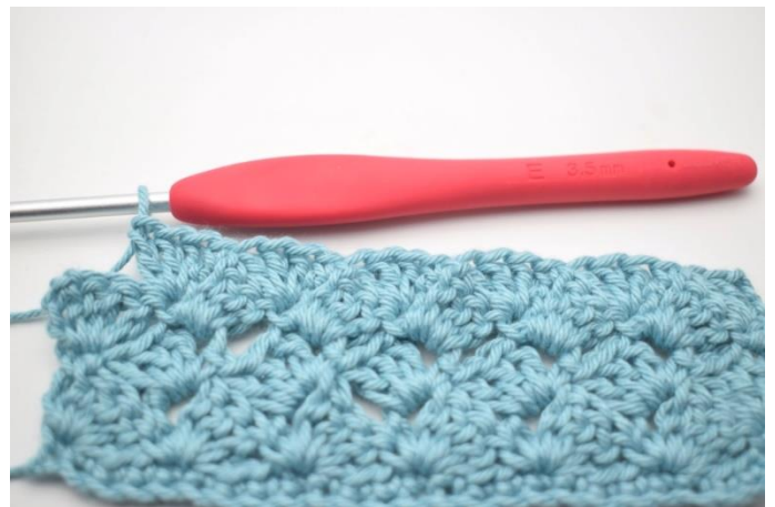
45. Powtarzaj „do” w sumie 13 razy.