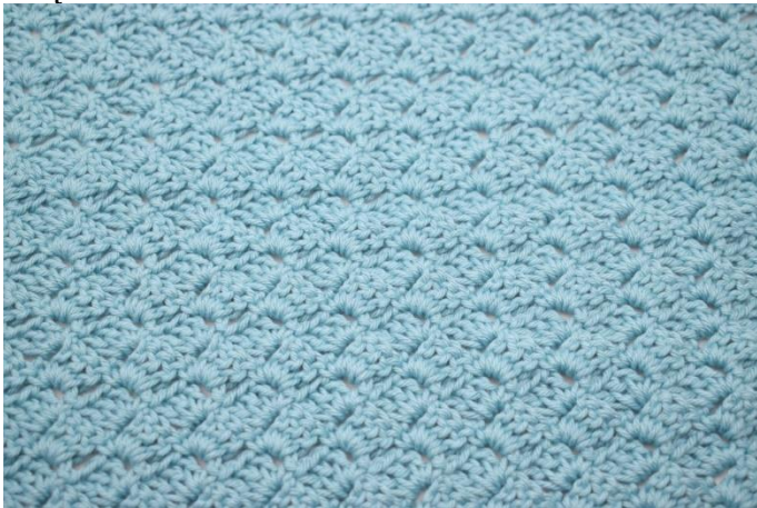
33. Powtarzaj według opisu rząd 3 aż wykonasz w sumie 24 rzędy.