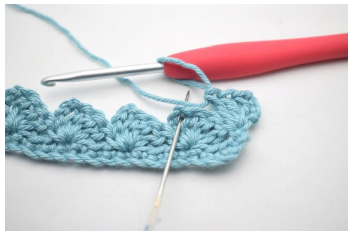
18. „Szydełkuj 1 psł, 3 oł i 3 sł w następnym łuku”.