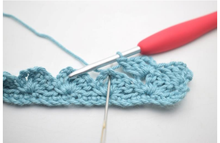
20. „Szydełkuj 1 psł, 3 oł i 3 sł w następnym łuku”.