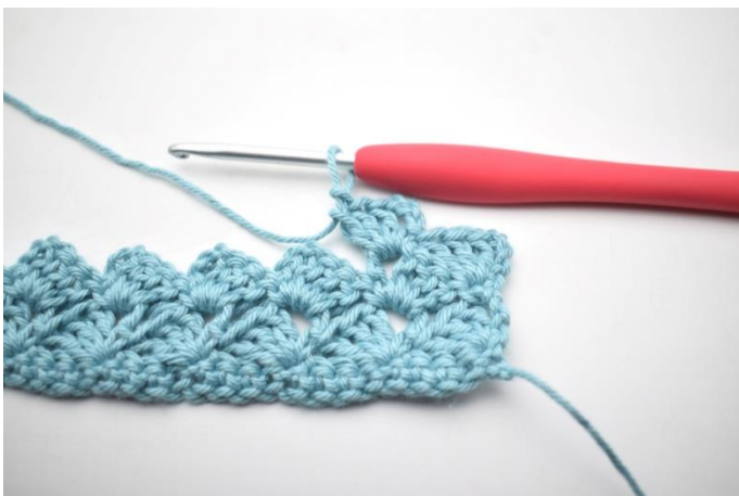
29. W ten sposób.