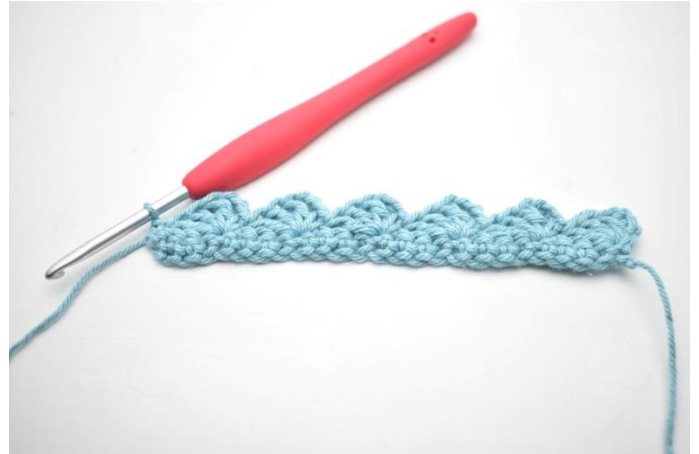
14. W ten sposób.