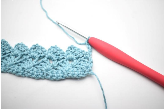
25. Szydełkuj jak rząd 3. Odwróć 4 oł.