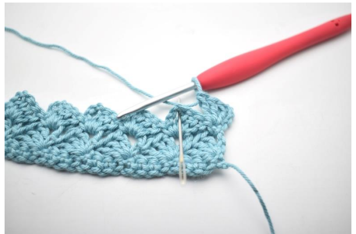
28. „Szydełkuj 1 psł, 3 oł i 3 sł w następnym łuku”.