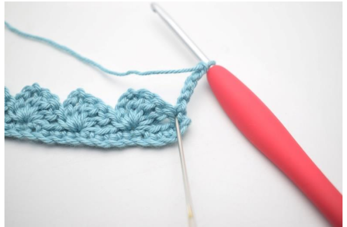
16. Szydełkuj 3 sł w pierwszym o.