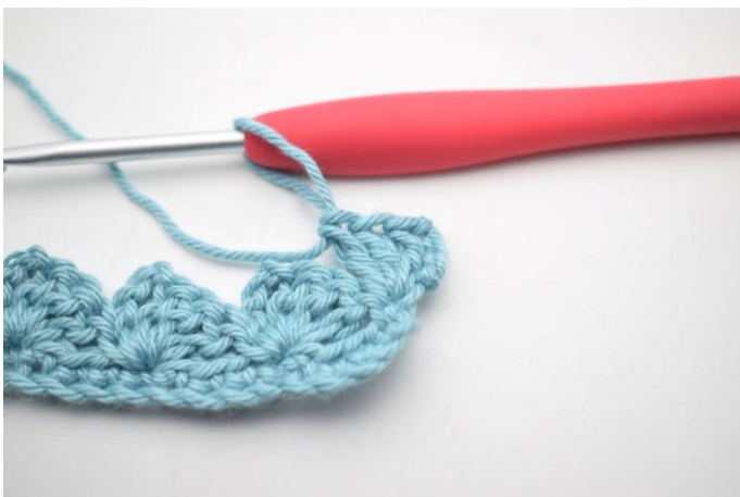
17. W ten sposób.