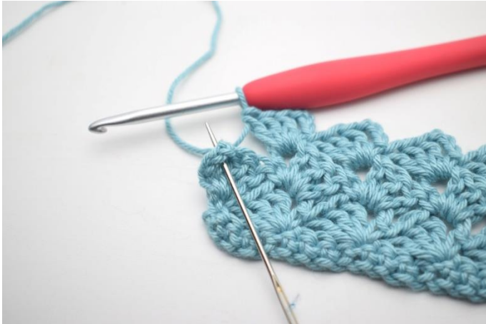
31. Szydełkuj 1 psł w ostatnim łuku.