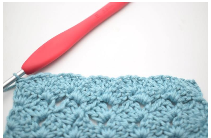
47. W ten sposób.