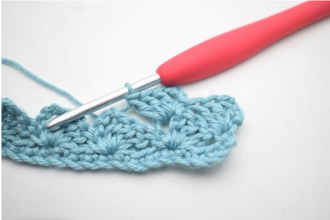
19. W ten sposób.