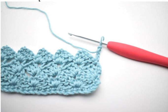
34. Odwróć 4 oł.