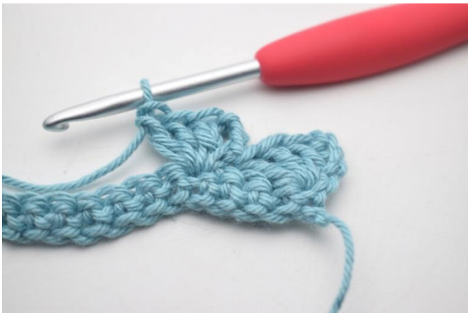
9. W ten sposób.