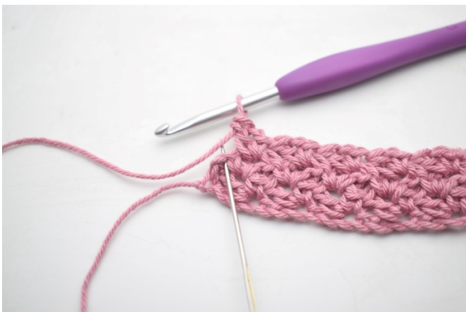
25. Szydełkuj 1 psł w ostatnim o.