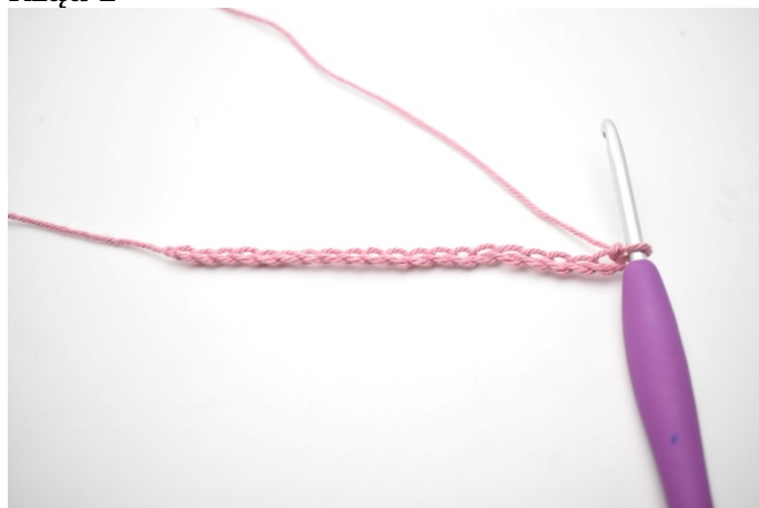
1. Wykonaj 60 oł.