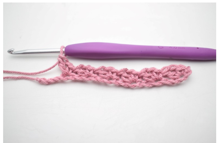
8. Powtarzaj „do” aż zostaną 3 oł.