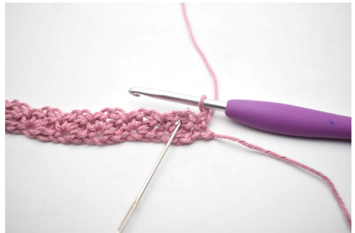
12. „Szydełkuj 1 psł, 1 oł i 1 sł w łuku poprzedniego rzędu”.