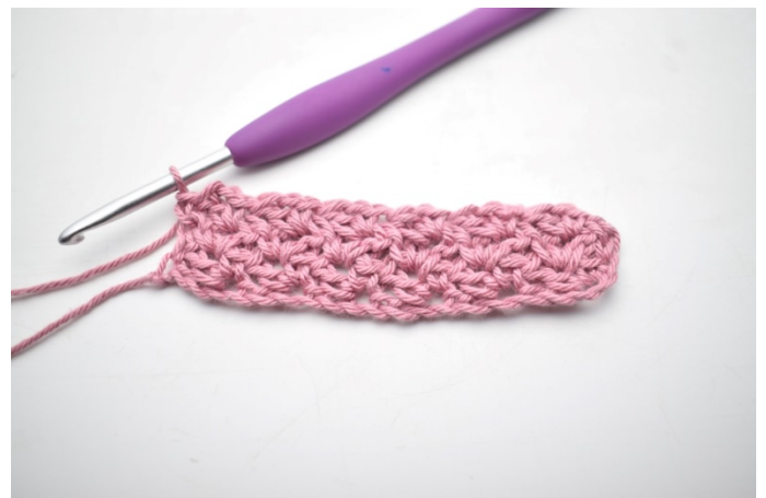
26. W ten sposób.