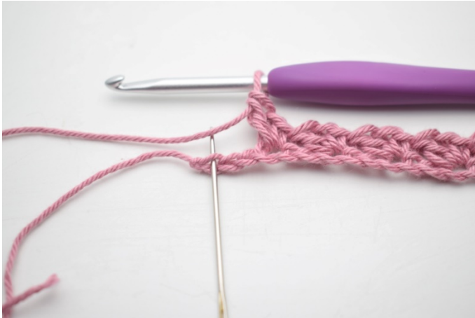
9. Omiń 2 oł i szydełkuj 1 psł w ostatnim o.