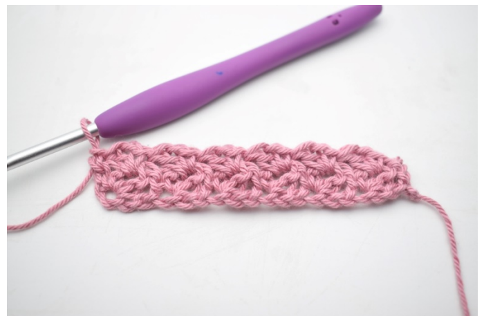
18. W ten sposób.