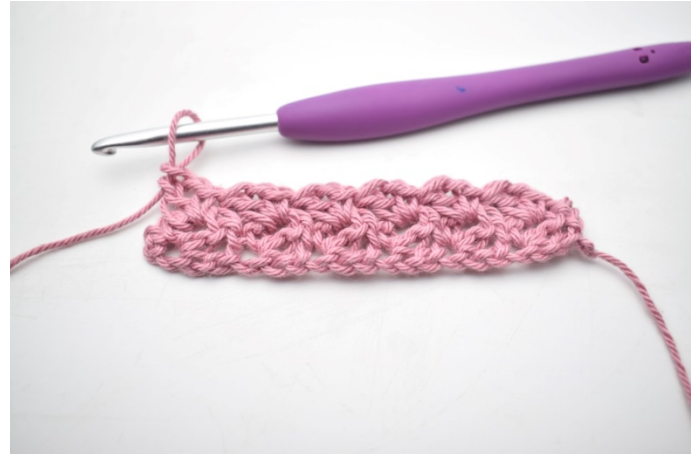
16. Powtarzaj „do” do końca rzędu.