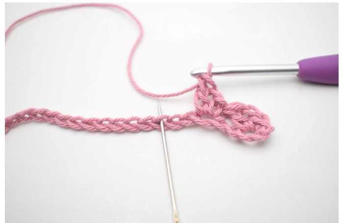
6. „Omiń 2 oł i szydełkuj 1 psł, 1 oł i 1 sł w następnym o”.