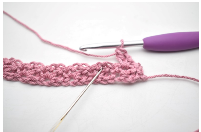
14. „Szydełkuj 1 psł, 1 oł i 1 sł w łuku poprzedniego rzędu”.