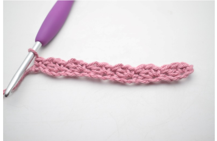
10. W ten sposób.