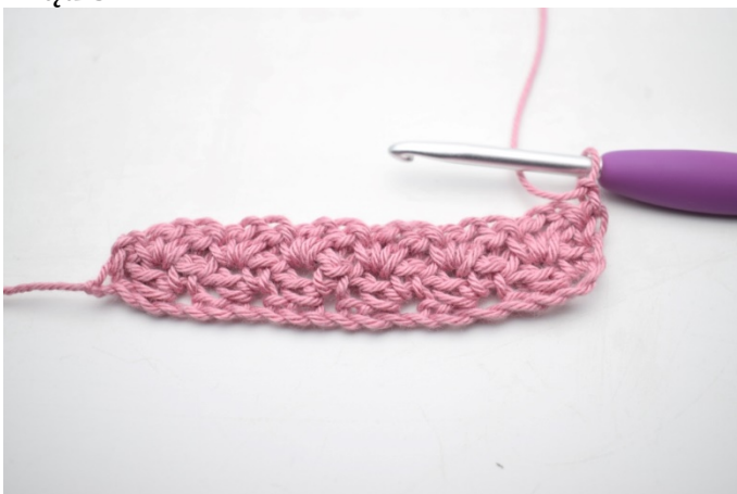
19. Szydełkuj jak rząd 2. Odwróć 1 oł.