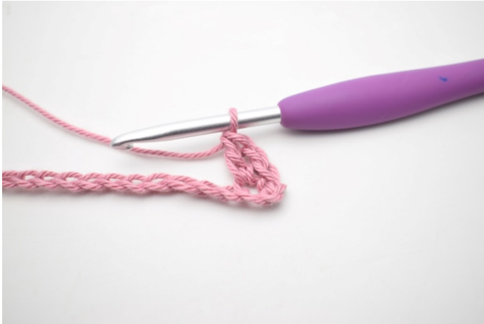
3. W ten sposób.