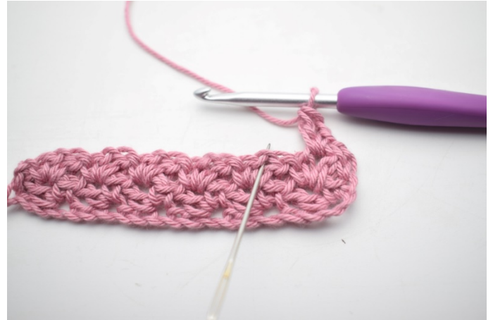
22. „Szydełkuj 1 psł, 1 oł i 1 sł w łuku poprzedniego rzędu”.