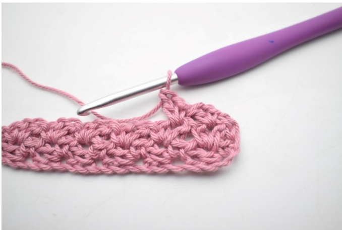
23. W ten sposób.