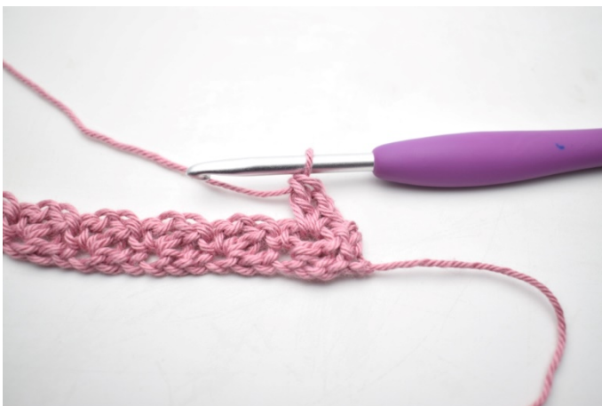
13. W ten sposób.