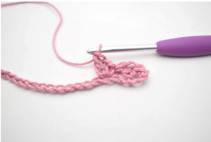
5. W ten sposób.