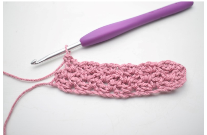
24. Powtarzaj „do” do końca rzędu.