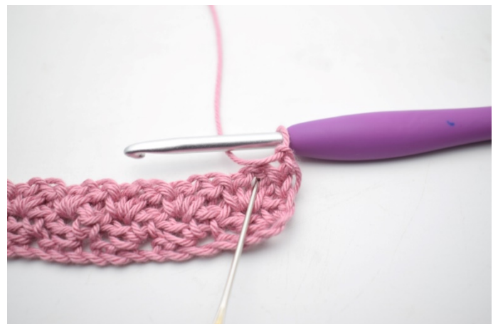
20. „Szydełkuj 1 psł, 1 oł i 1 sł w łuku poprzedniego rzędu”.