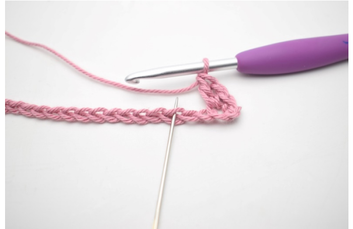
4. „Omiń 2 oł i szydełkuj 1 psł, 1 oł i 1 sł w następnym o”.