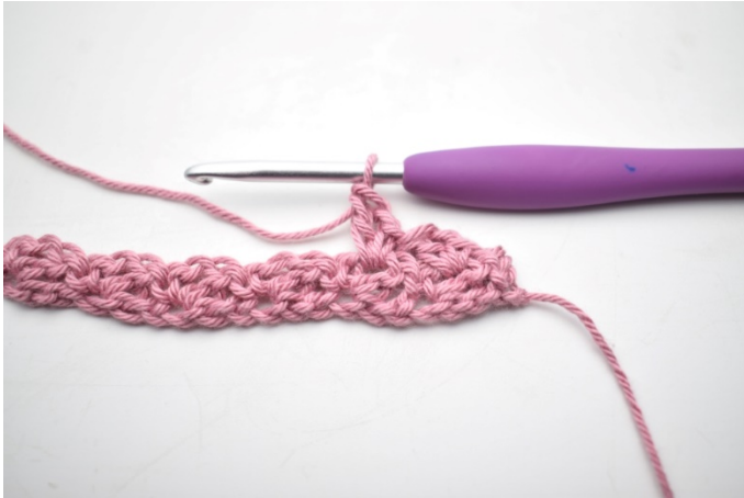
15. W ten sposób.