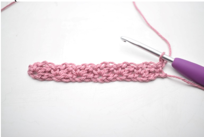
11. Odwróć 1 oł.