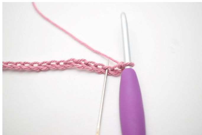
2. Szydełkuj 1 psł, 1 oł i 1 sł w 3. oł od szydełka.