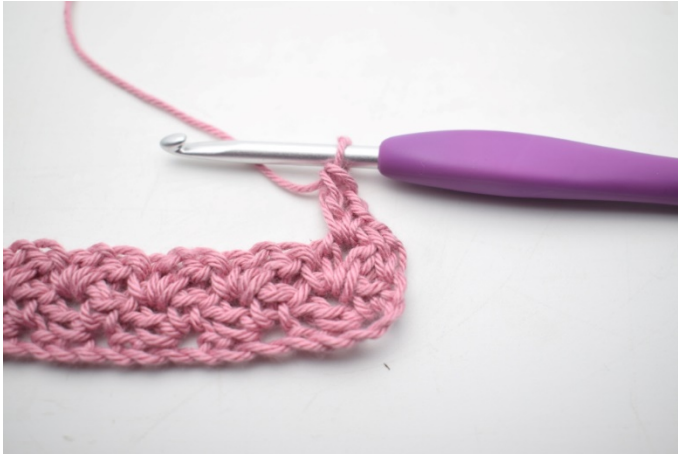
21. W ten sposób.