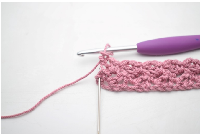
17. Szydełkuj 1 psł w ostatnim o.