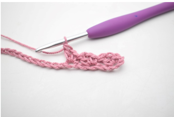
7. W ten sposób.