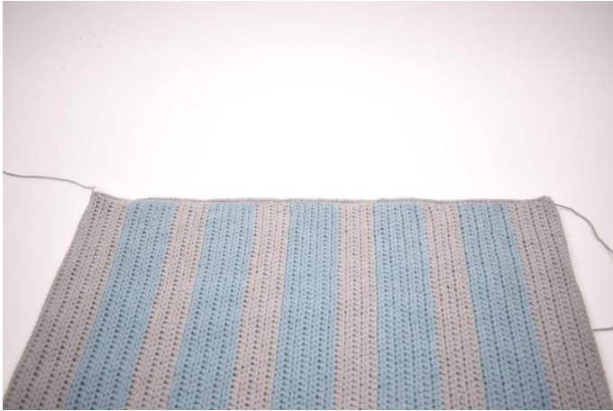
5. W ten sposób.