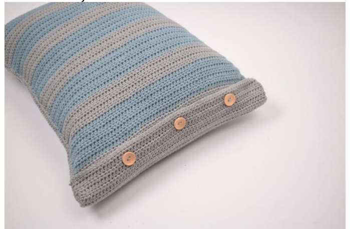
8. Wsadź poduszkę i zapnij.