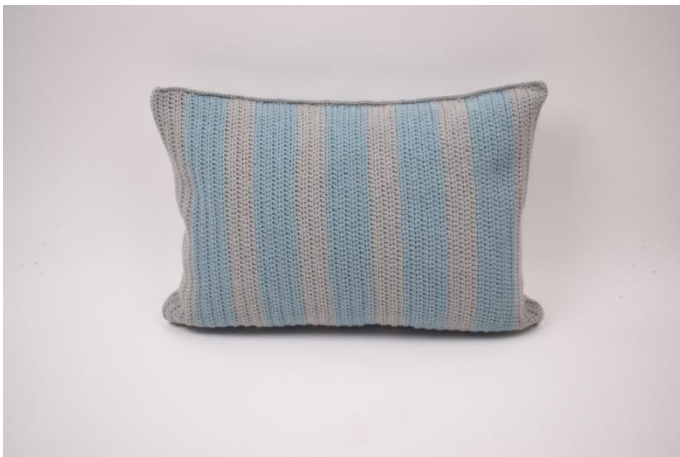
9. W ten sposób.