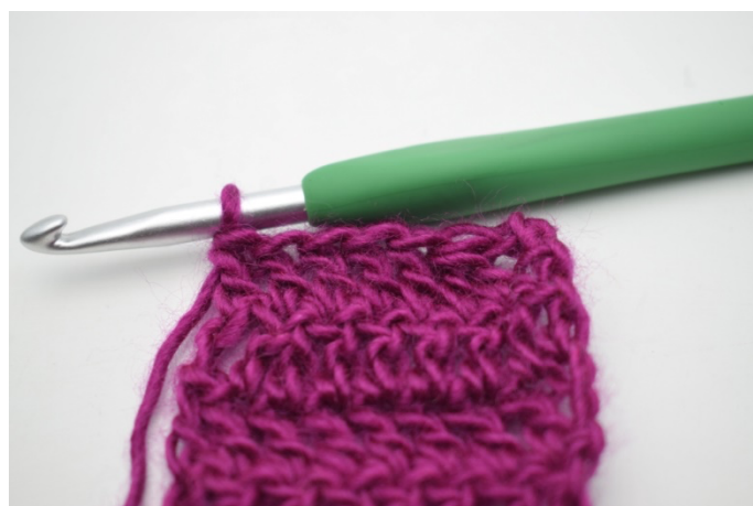
3. Przerabiaj sł. do końca rzędu.

86. - 165. Powtarzaj "Odwróć robiąc 3 o.ł. Przerób następne 2 o. razem. Przerabiaj sł. do końca." Aż wykonasz 165 rzędów. (2) Odetnij włóczkę i powplataj końcówkę.