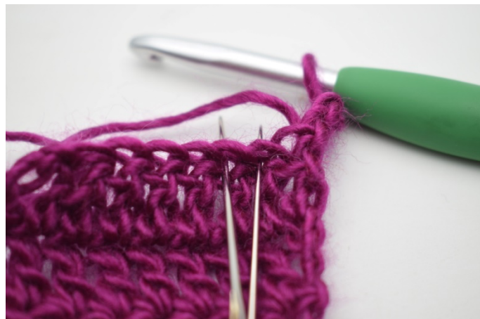
5. Teraz odejmij o., czyli przerób 2. i 3.o. razem.