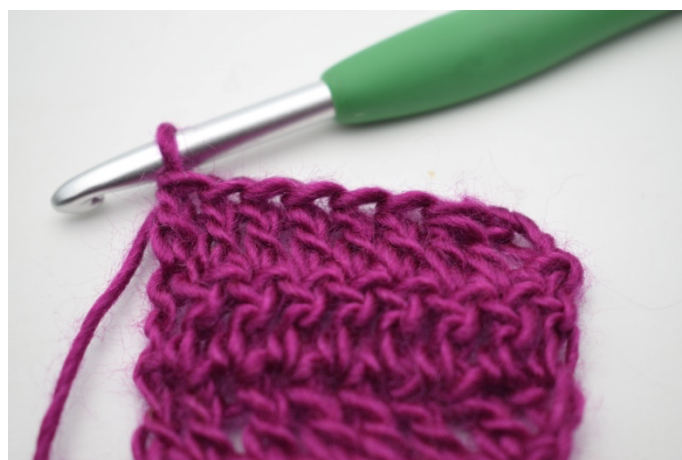
4. Przerabiaj sł. do końca rzędu.