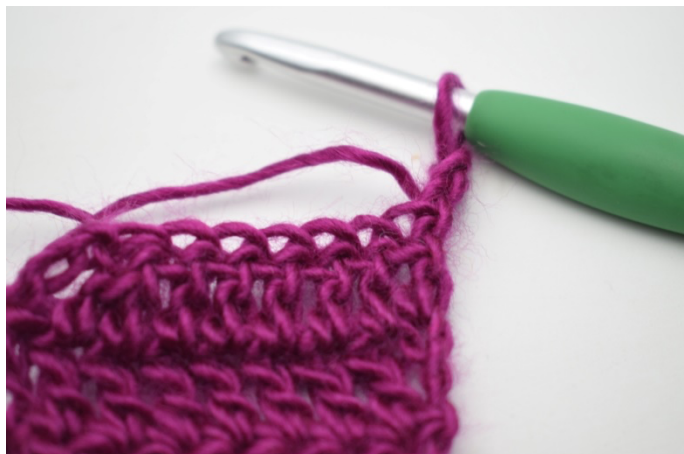
1. Odwróć robiąc 3 o.ł.

85. Odwróć robiąc 3 o.ł. Przerób następne 2 o. razem. Przerabiaj sł. do końca. (82)