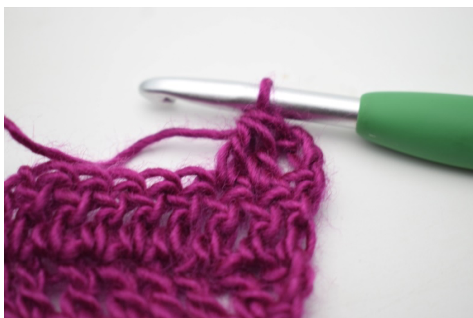
3. W ten sposób.