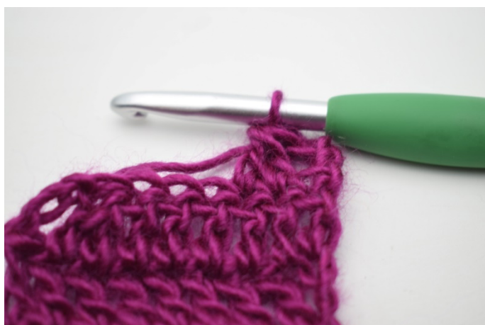
2. W ten sposób.