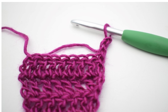
1. Odwróć robiąc 3 o.ł.