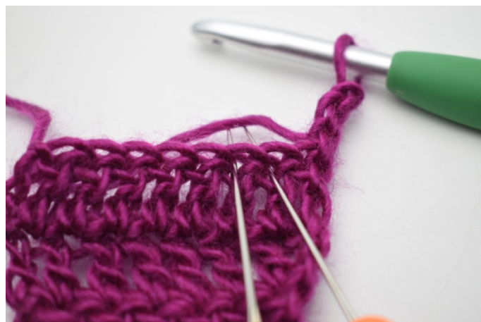
2. Teraz odejmij o., czyli przerób 2. i 3.o razem.