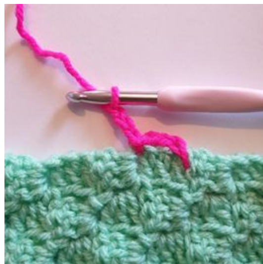
4. Zrób 3 oł.