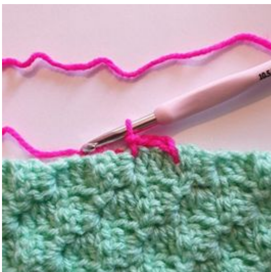
3. Szydełkuj 1 oł. między 2 kwadracikami.