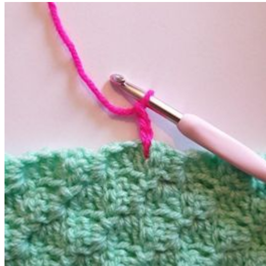
2. Zrób 3 oł.