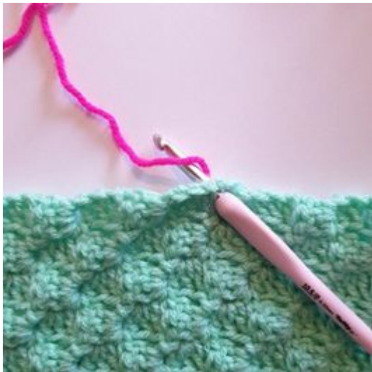
1. Zaczynij w dowolnym miejscu.