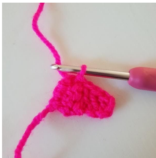
4. Teraz łączymy kwadracik z pierwszym kwadracikiem w następujący sposób: obróć kwadracik i wykonaj 1 oł. po lewej stronie pierwszego kwadracika. Na zdjęciu widać, jak kwadraciki zostały połączone.