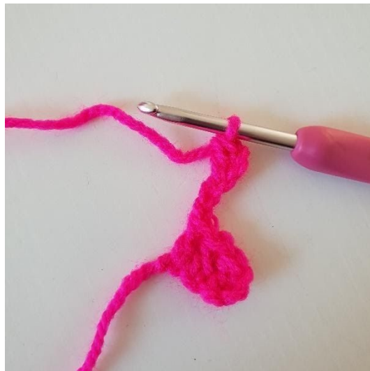
2. Szydełkuj 1 słupek w 3. oł. od szydełka