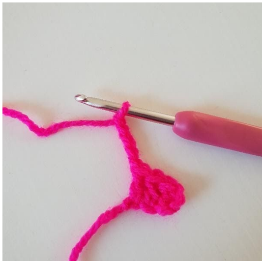
1. Zrób 5 oczek łańcuszka