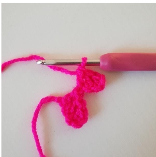
3. Szydełkuj słupek w następnych 2 oł. Został wykonany jeszcze jeden kwadracik/pixel.