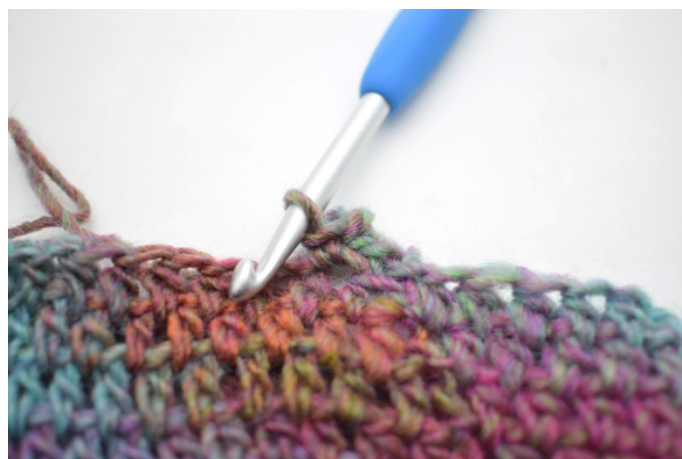
6. Wykonaj 1 psł. w następnym o.