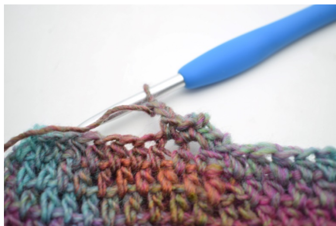
8. Zrób 2 oł.