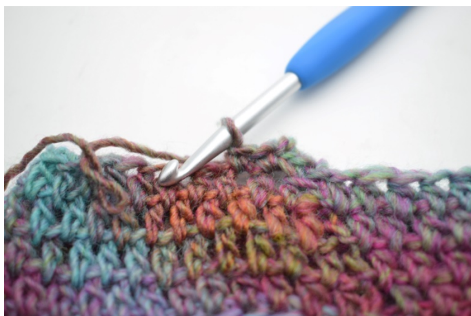
7. Wykonaj 1 psł. w następnym o.