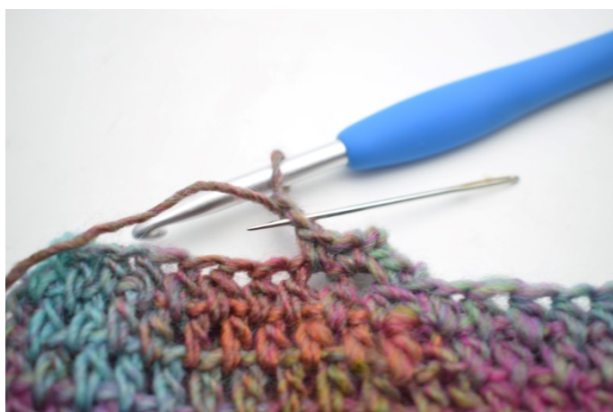
9. Wykonaj 1 oś. w 2. oł. od szydełka.