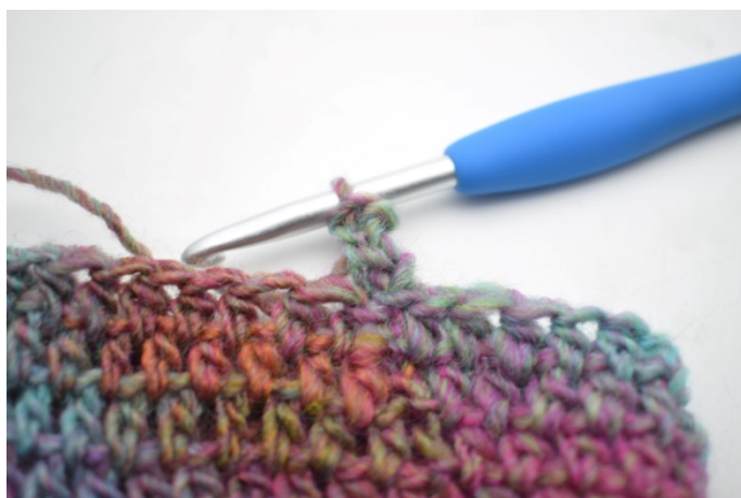
5. W ten sposób.