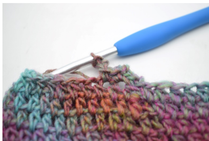
10. W ten sposób.