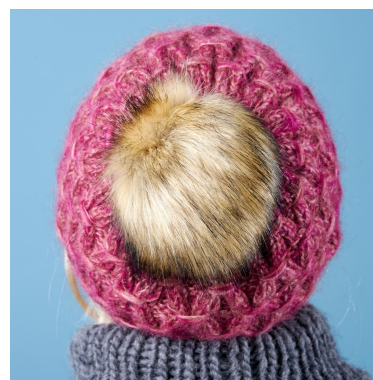
Czapka z pomponem