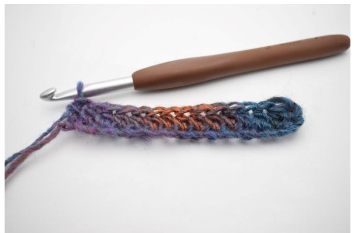
4. Wykonaj psn. do końca rzędu.