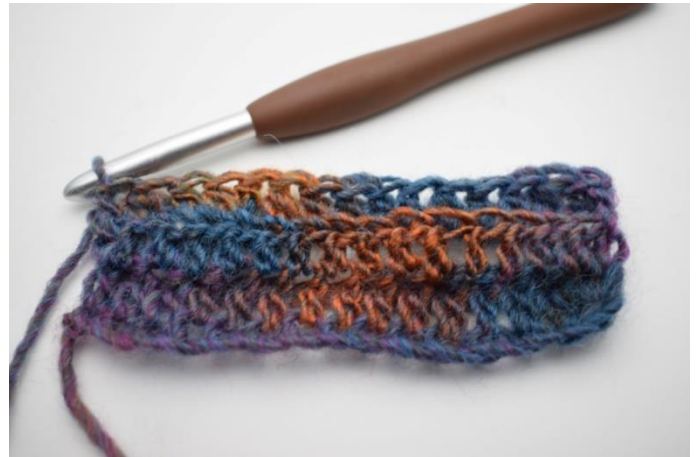
12. Wykonaj psn. w tylną pętelkę oczka do końca rzędu.