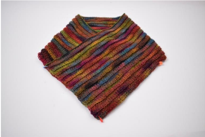
3. Znacznikami przytrzymaj części razem.