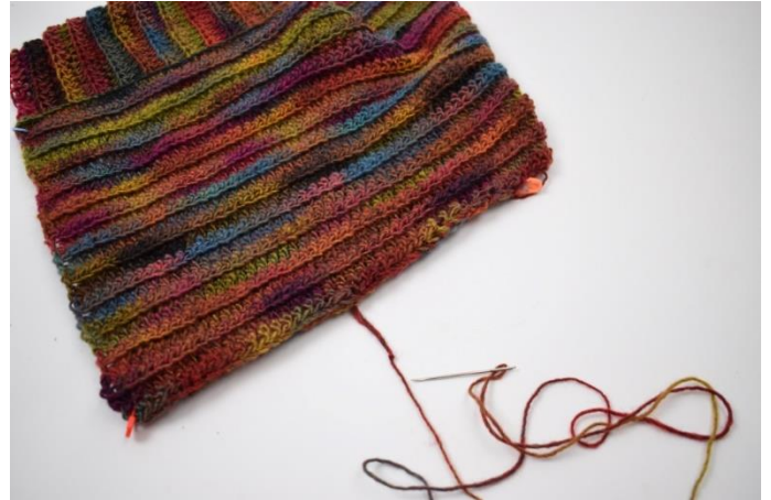
4. Zszyj boki razem po obu stronach.