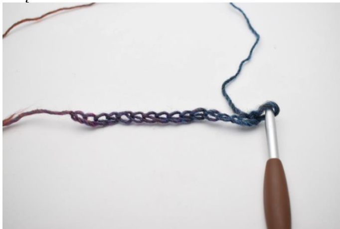
1. Wykonaj oł.