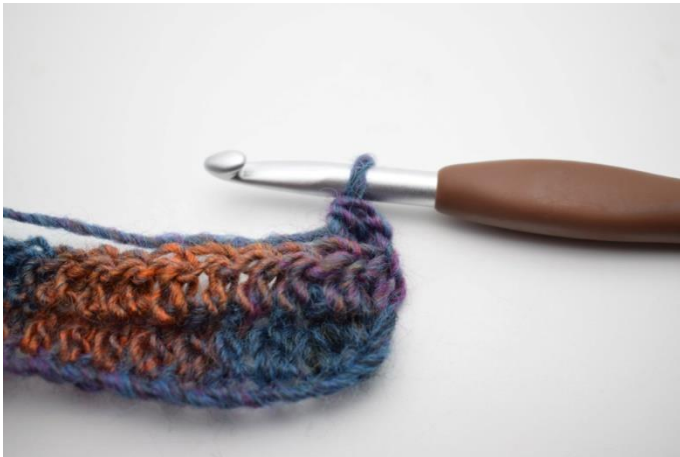
11. W ten sposób.