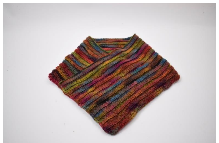
2. Złóż drugi z brzegów robótki tak aby zachodził nad 30. oczkami pierwszego brzegu.