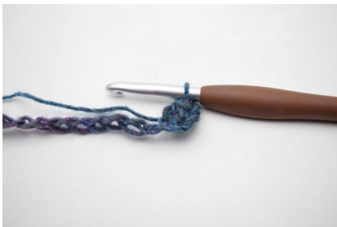
3. W ten sposób.