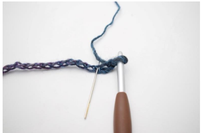
2. Wykonaj 1 psn. w 3. oł. od szydełka.