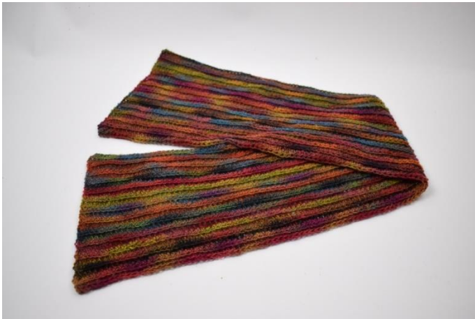
13. Powtarzaj wzorem, aż wykonasz w sumie 26 rzędów. Utnij nitkę i zamocuj końce.