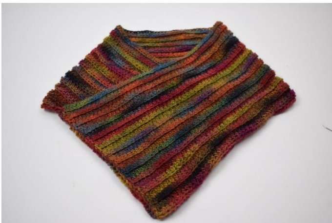
5. Utnij nitkę i zamocuj końce.