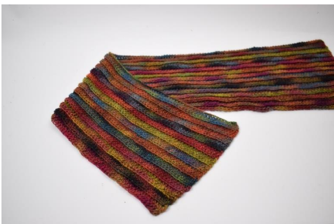
1. Złóż pierwszy z brzegów robótki w kierunku środka tak jak na zdjęciu.