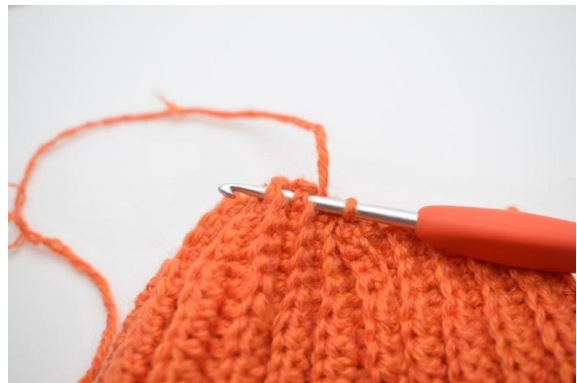
10. Szydełkuj oś. przez następne 2 wypukłe oczka ściągacza.