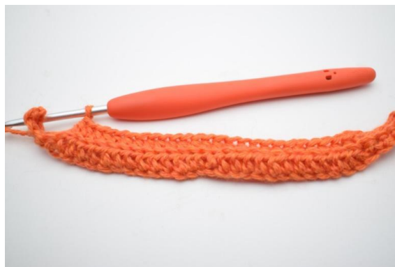
4. Wykonaj 1 psn. w następnych 20 (25) o.