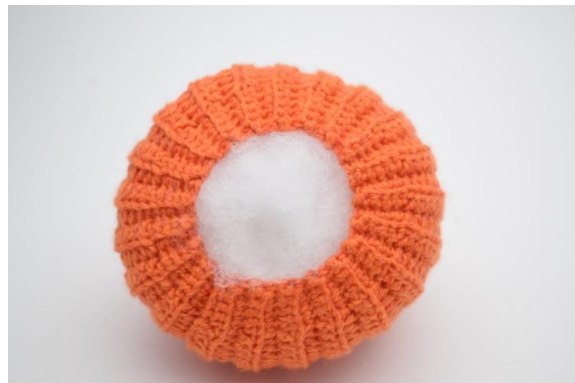
16. Wypchaj dynię.