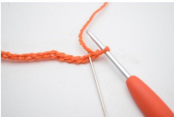
3. W 2. oł. od szydełka wykonaj 1 psł.