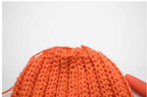
12. Powtarzaj do końca.