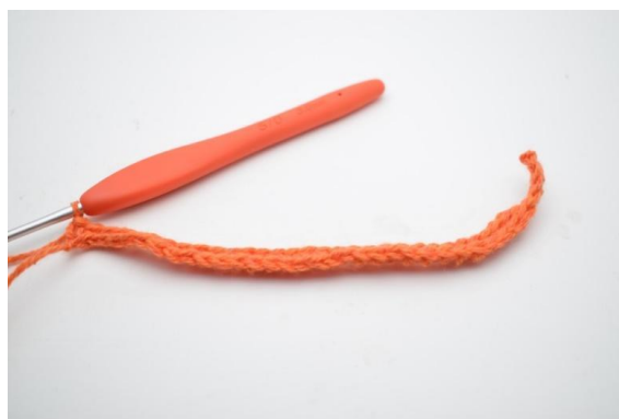
8. W ten sposób.