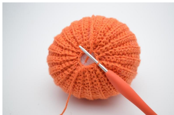
18. W ten sposób.