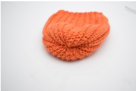
15. Wywiń robótkę lewą stroną do środka.