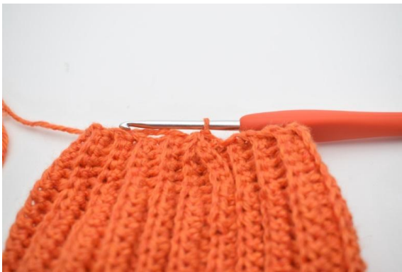
9. W ten sposób.