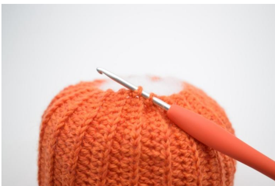
17. Szydełkuj dolne brzegi razem oś. przez 2 wypukłe oczka ściągacza.