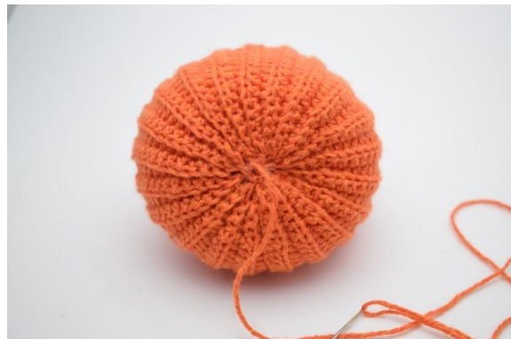
20. W ten sposób.