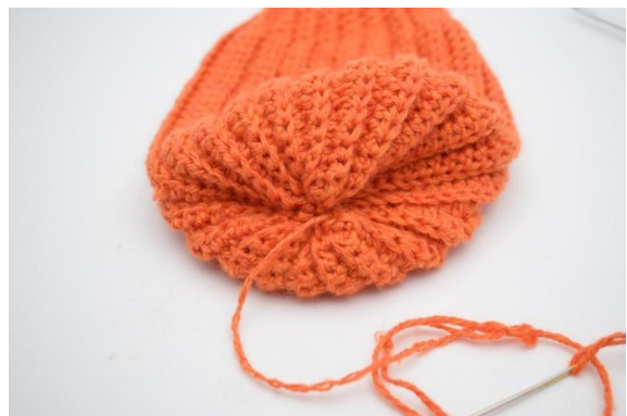
14. Utnij nitkę i zaszyj otwór.