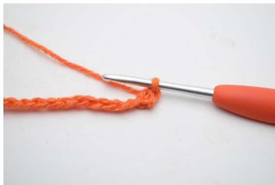
4. W ten sposób.