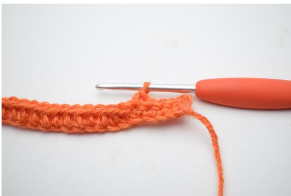
3. Wykonaj 1 psł. w pierwszych 4 (5) o.