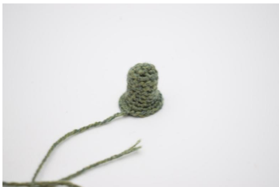
23. Przyszyć ogonek.