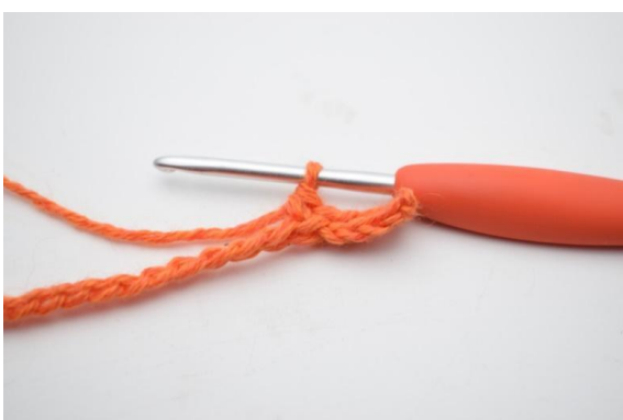
5. Wykonaj 1 psł. w następnych 3 (4) oł.