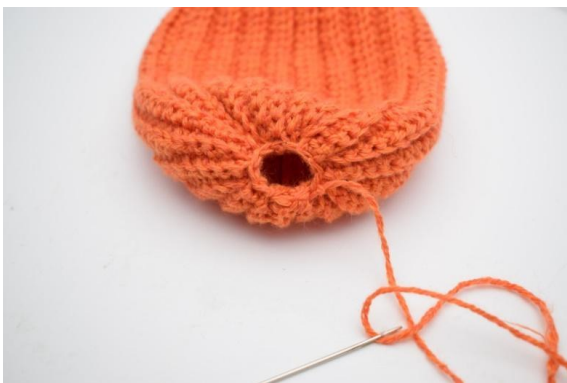
13. W ten sposób.