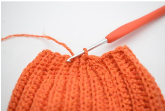
11. W ten sposób.