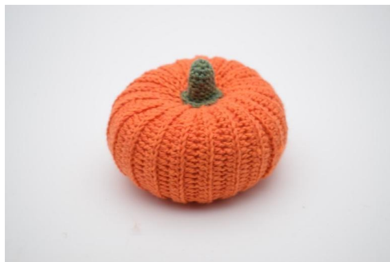
24. W ten sposób.