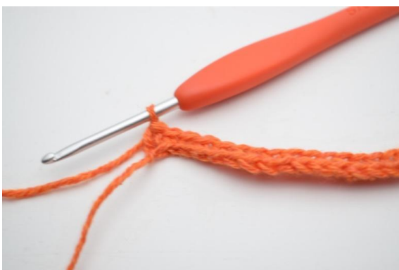
7. Wykonaj 1 psł. w ostatnich 4 (5) oł.