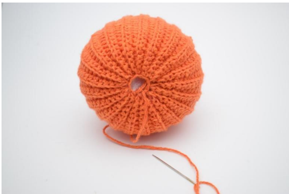
19. Utnij nitkę i zaszyj otwór.