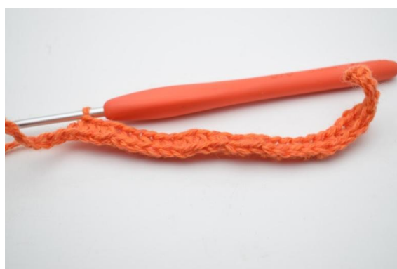
6. Wykonaj 1 psn. w kolejnych 20 (25) oł.