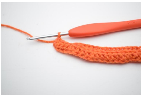
5. Wykonaj 1 psł. w ostatnich 4 (5) o.