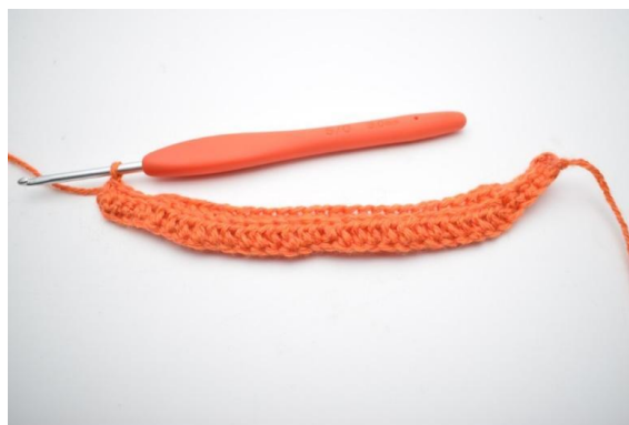
6. W ten sposób.