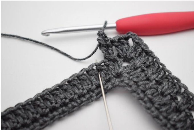
11. Ominąć 1 o. i wykonać 2 sł. pomiędzy kolejnymi 2 sł.