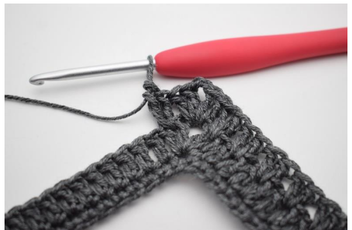
10. W ten sposób.