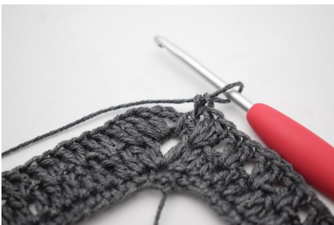
15. W ten sposób.