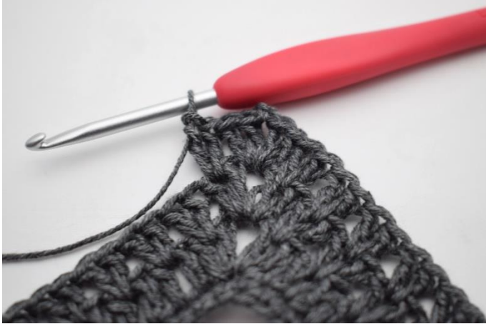
7. W ten sposób.