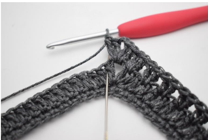
9. Wykonać 2 sł. pomiędzy pierwszymi 2 sł. Igła wskazuje, gdzie masz wykonać sł.