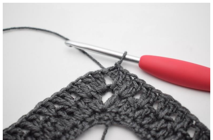
16. Zakończyć 1 oś.