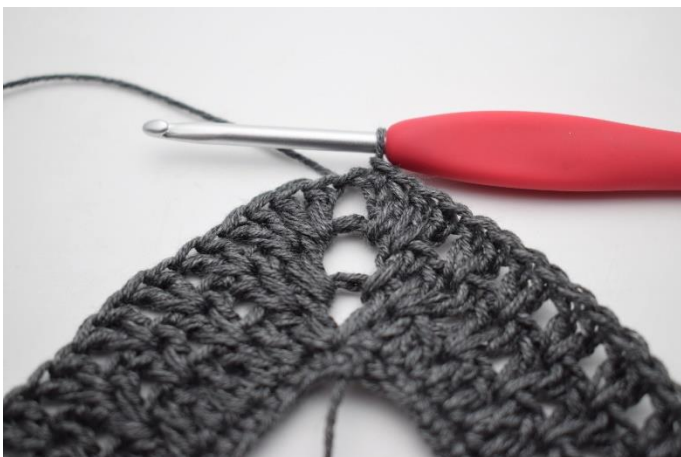
11. Zakończyć 1 oś.