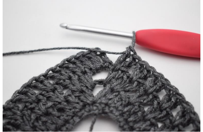
8. Wykonać "2 sł. pomiędzy kolejnymi 2 sł, ominąć 1 o". Powtarzać od" do" w sumie 36 razy.