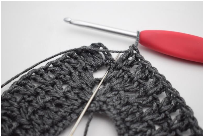
9. Wykonać 1 sł. w początkowym łuku okrążenia.