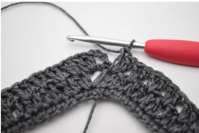
13. Wykonać "2 sł. pomiędzy następnymi 2 sł, ominąć 1 o". Powtarzać od" do" w sumie 34 razy.