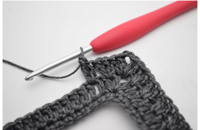
12. W ten sposób.