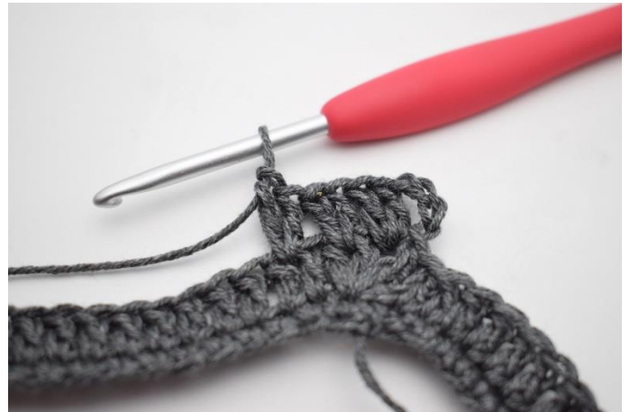
6. W ten sposób.