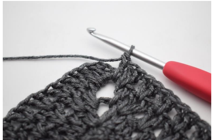
10. W ten sposób.