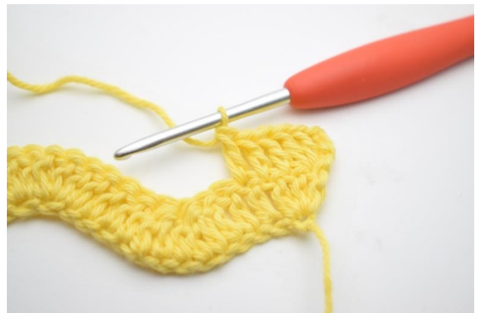
4. Szydełkuj 1 sł w następnych 3 o.