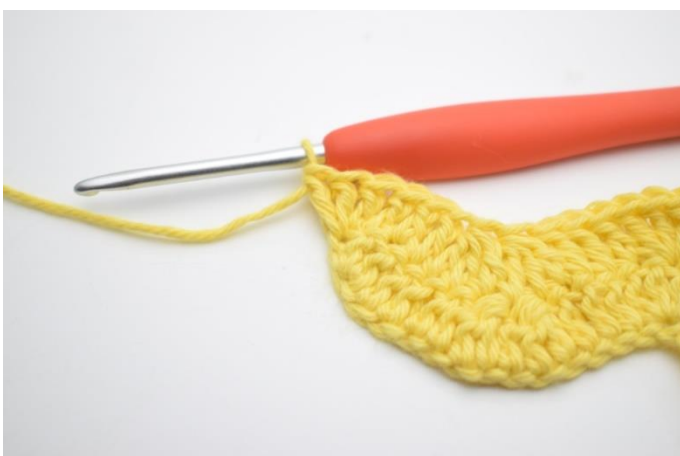
15. W ten sposób.