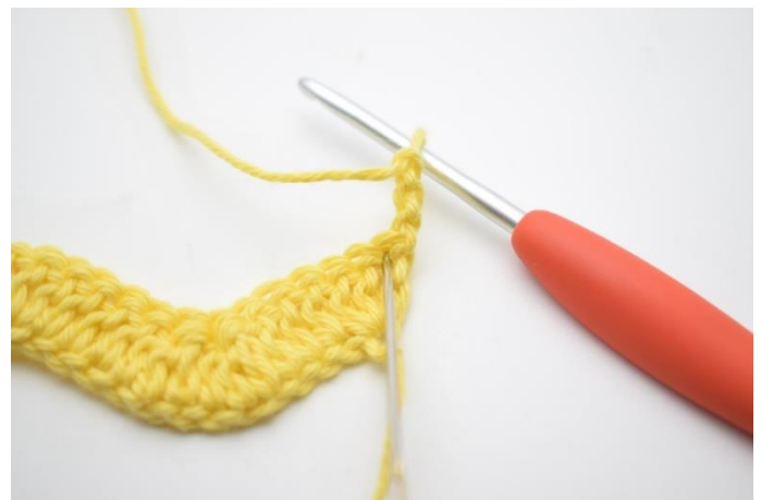
2. Szydełkuj 2 sł w pierwszym o.