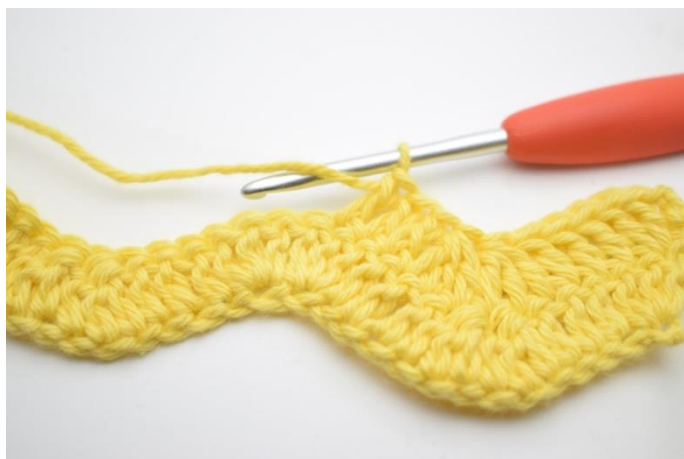
7. Szydełkuj 1 sł w następnych 3 o.