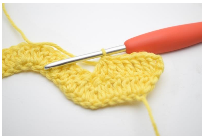
5. Szydełkuj 3 sł raz. nad następnymi 3 o.