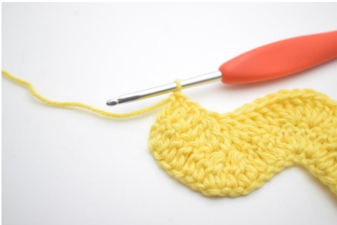
13. Szydełkuj 1 sł w następnych 3 o.