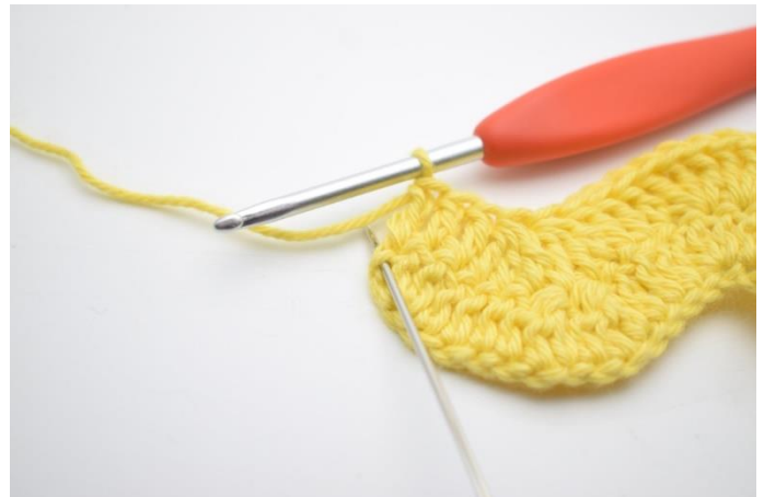
14. W ostatnim o szydełkuj 3 sł.