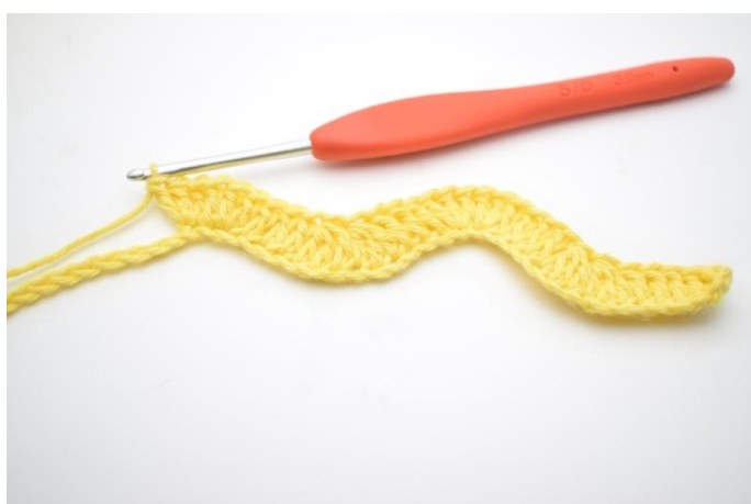
11. Szydełkuj 1 sł w następnych 3 oł. Szydełkuj 3 sł w kolejnych 2 oł.