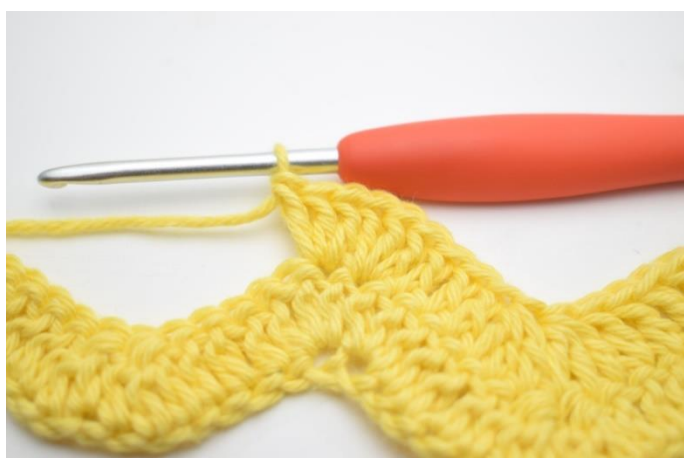
9. Powtórz i szydełkuj 3 sł w następnym o.