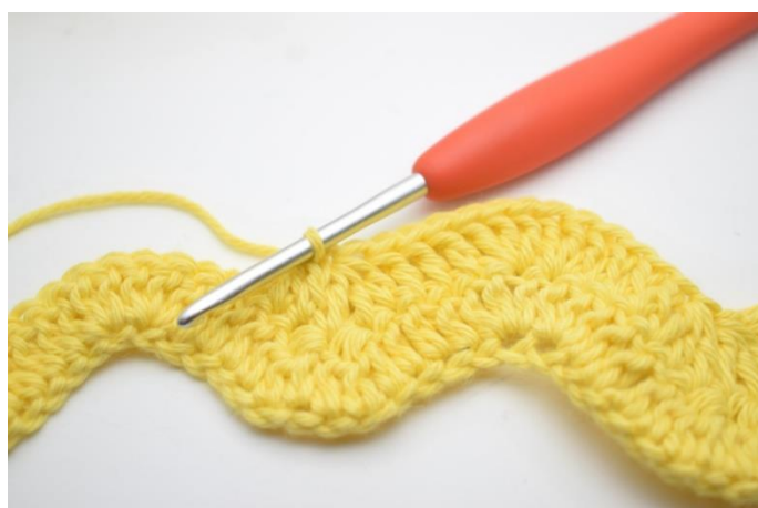
10. Szydełkuj 1 sł w następnych 3 o. „Szydełkuj 3 sł raz. nad następnymi 3 o”. Powtórz „do” w sumie 2 razy.