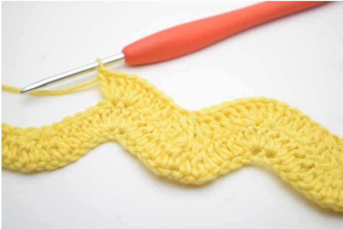
11. Szydełkuj 1 sł w następnych 3 o. Szydełkuj po 3 sł w kolejnych 2 o.