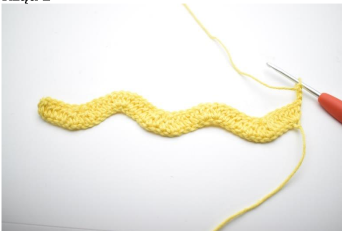
1. Odwróć 3 oł.