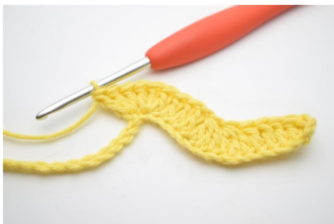
9. Powtórz i szydełkuj 3 sł w następnym oł.