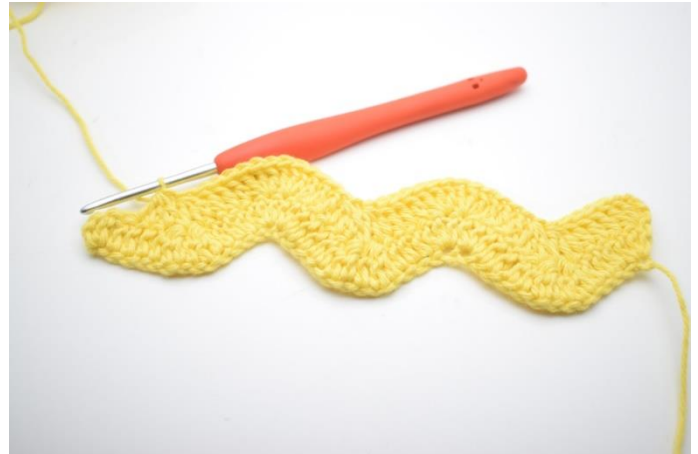
12. W ten sposób powtarzaj do końca rzędu aż zostaną 4 oł.