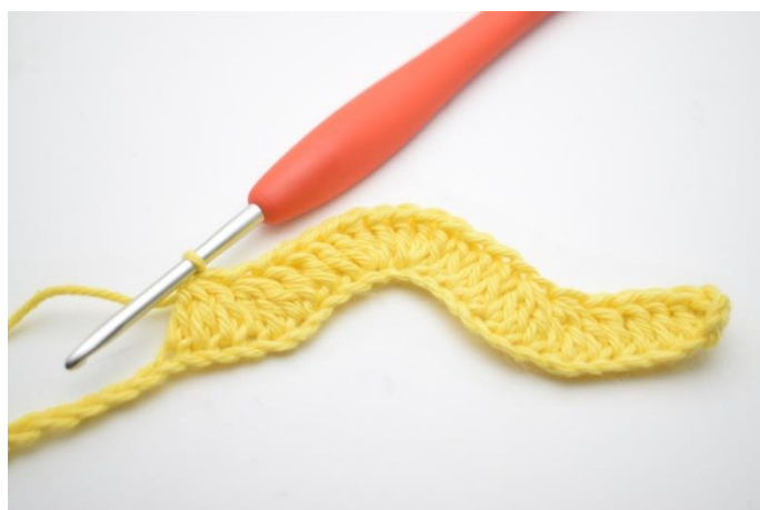
10. Szydełkuj 1 sł w następnych 3 oł. „Szydełkuj 3 sł raz. nad następnymi 3 oł”. Powtórz „do” w sumie 2 razy.