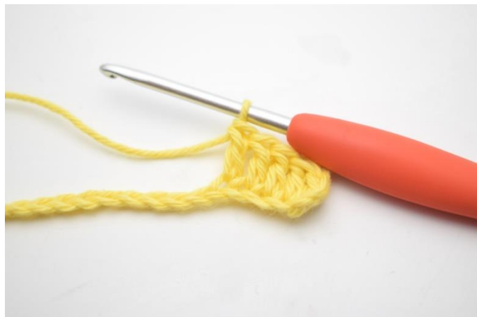
4. Szydełkuj 1 sł w następnych 3 oł.