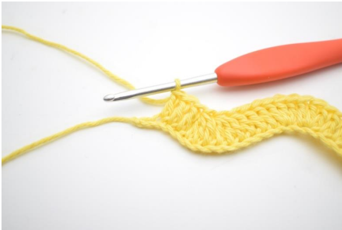
13. Szydełkuj 1 sł w następnych 3 oł.