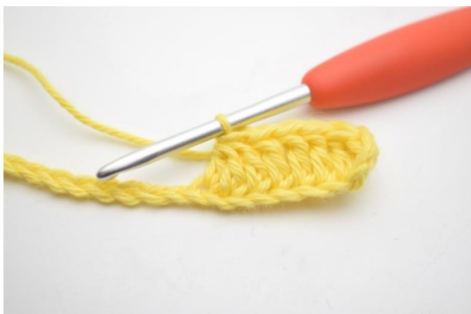
5. Szydełkuj 3 sł raz. nad następnymi 3 oł. (To znaczy, że należy szydełkować 3 sł razem -słupki łączone górną)