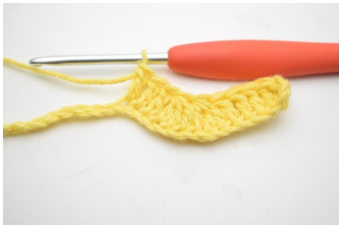
7. Szydełkuj 1 sł w następnych 3 oł.