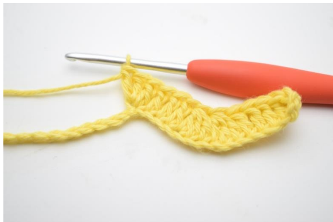
8. Szydełkuj 3 sł w następnym oł.