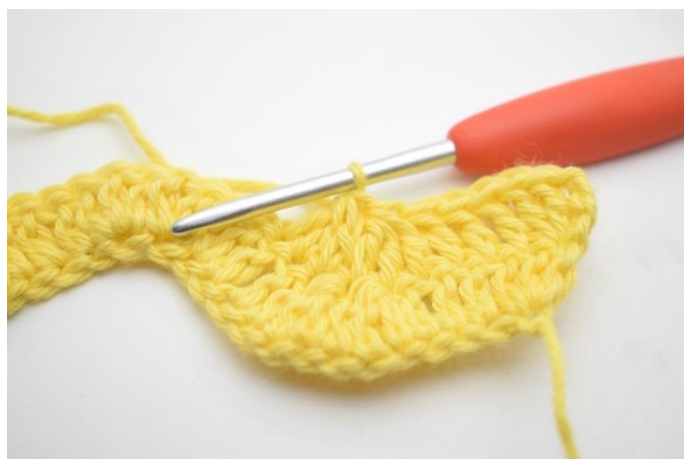
6. Powtórz i szydełkuj 3 sł raz. nad następnymi 3 o.