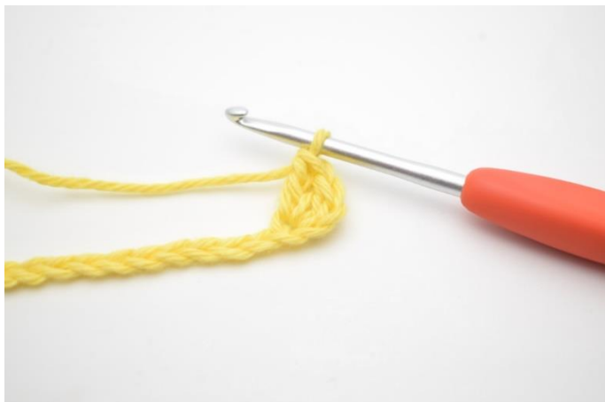
3. W ten sposób.