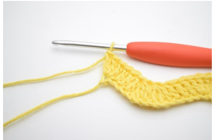
14. W ostatnim oł szydełkuj 3 sł.