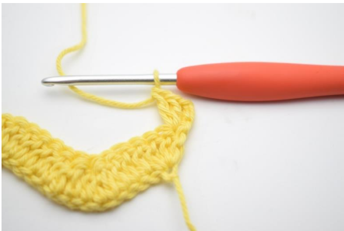
3. W ten sposób.