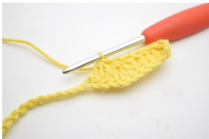
6. Powtórz i szydełkuj 3 sł raz nad następnymi 3 oł.