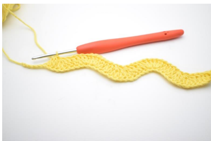
12. W ten sposób powtarzaj do końca rzędu aż zostaną 4 oł.