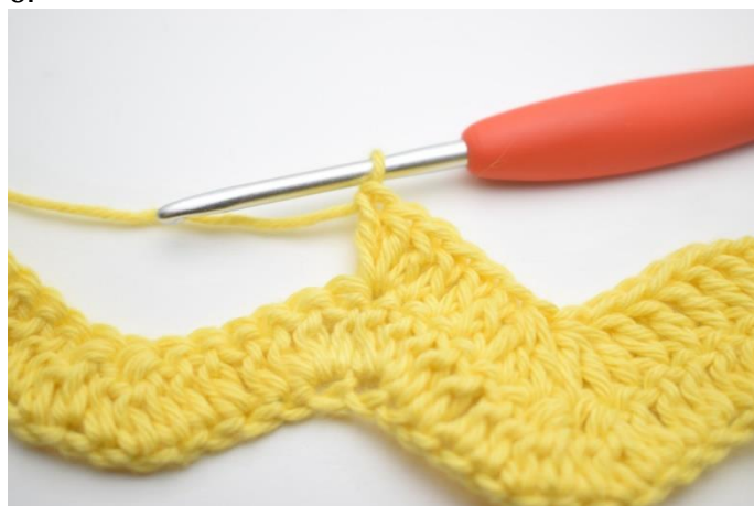
8. Szydełkuj 3 sł w następnym o.