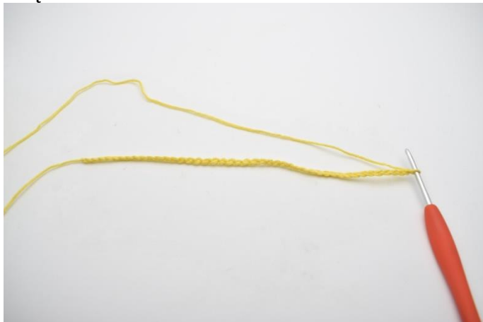
1. Zrób 72 oł.