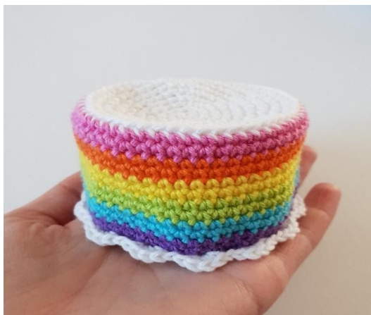
Bitą śmietaną na wierzchu