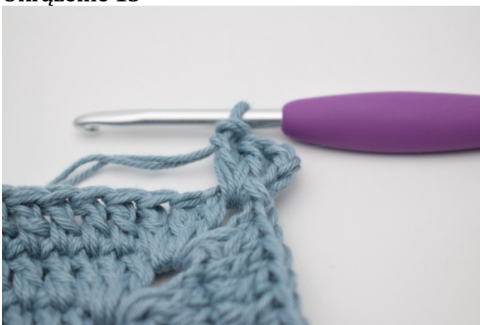
1. Zrób 1 oś w łuku. Zrób 4 oł. Szydełkuj 2 sł w łuku.