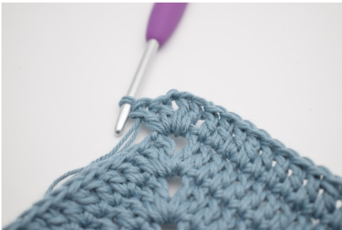
5. Szydełkuj 2 sł, 2 oł i 2 sł w następnym łuku”.