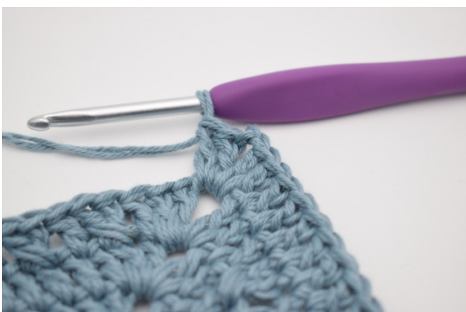
7. Szydełkuj 2 sł, 2 oł i 2 sł w następnym łuku.