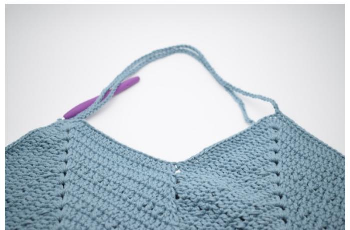
10. W ten sposób.