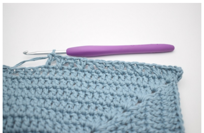
8. „Omiń 1 o i szydełkuj 1 sł. Szydełkuj 1 sł w oczku, które właśnie zostało ominięte. Szydełkuj 1 sł w następnym o”. Powtarzaj „do” 6 razy.