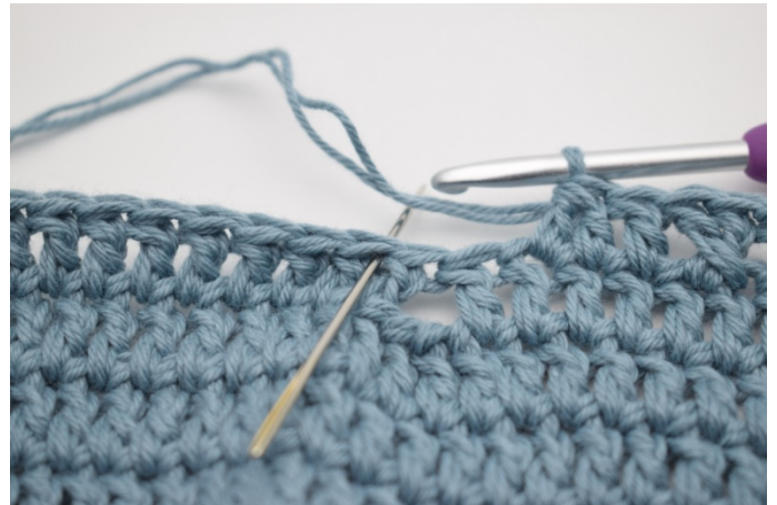
10. Omiń 2 o.