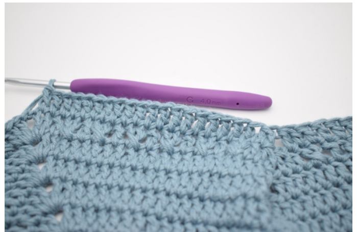
6. Szydełkuj 1 sł w następnym 19 o.