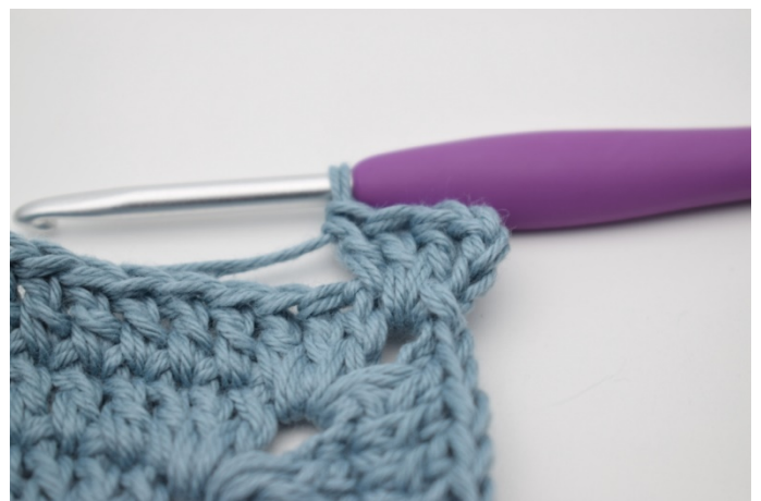
2. Szydełkuj 1 sł w pierwszym o.