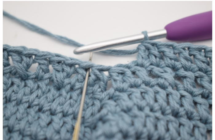
4. Omiń 2 o i szydełkuj 2 sł raz.