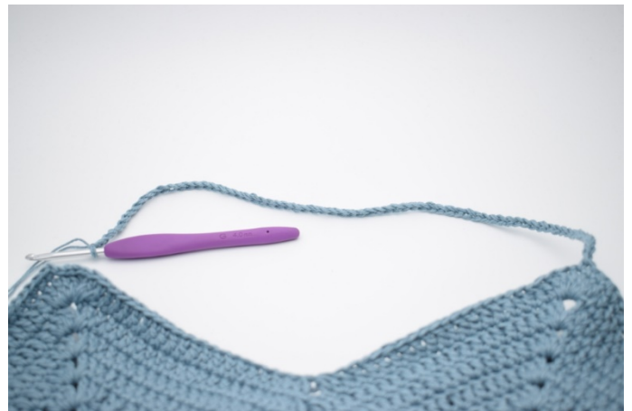
8. Zrób 70 oł i przejdź do następnego „szpica”.