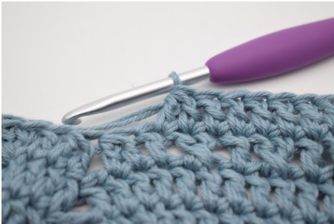
3. Szydełkuj 2 sł raz.