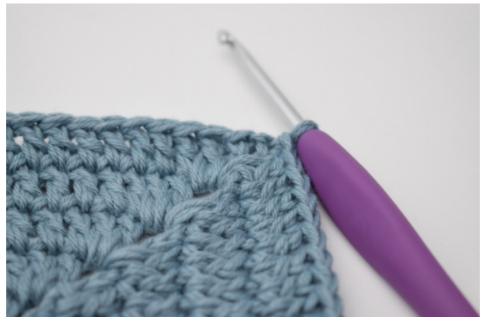
6. Powtarzaj wzdłuż wszystkich 4 boków. Szydełkuj 1 sł w łuku na początku okr. Zakończ 1 oś w 3. oł.