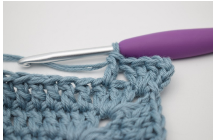
4. W ten sposób.