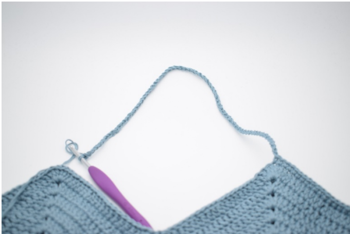
5. Zrób 70 oł i przejdź do następnego „szpica”. W 4. sł z tych 6 sł w łuku szydełkuj 1 psł.