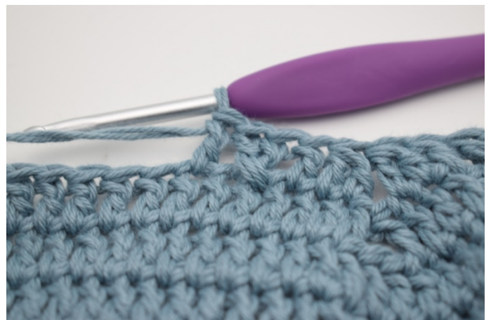
14. Szydełkuj 1 sł w następnym o.