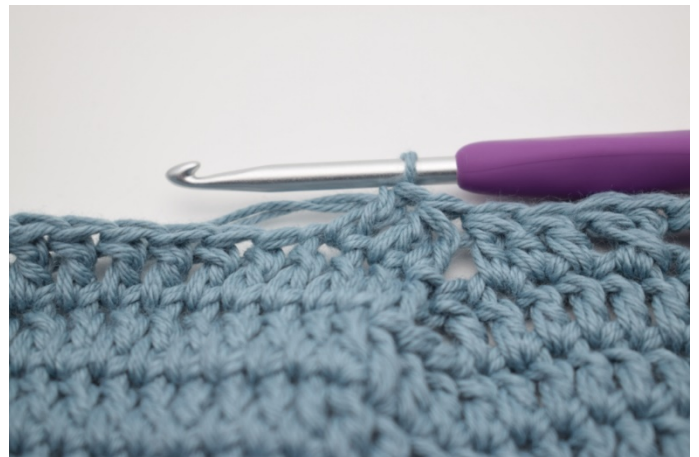
12. Szydełkuj 1 sł w następnym o.