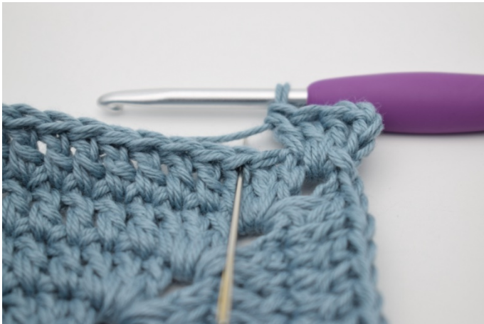
3. Omiń 1 o i szydełkuj 1 sł w następnym o.