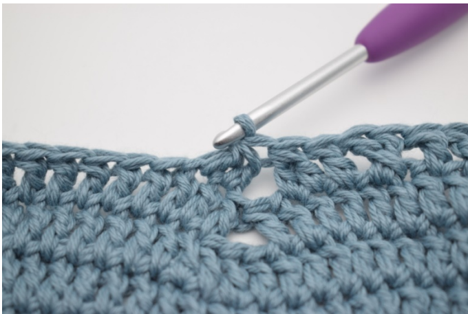
11. Szydełkuj 2 sł raz.