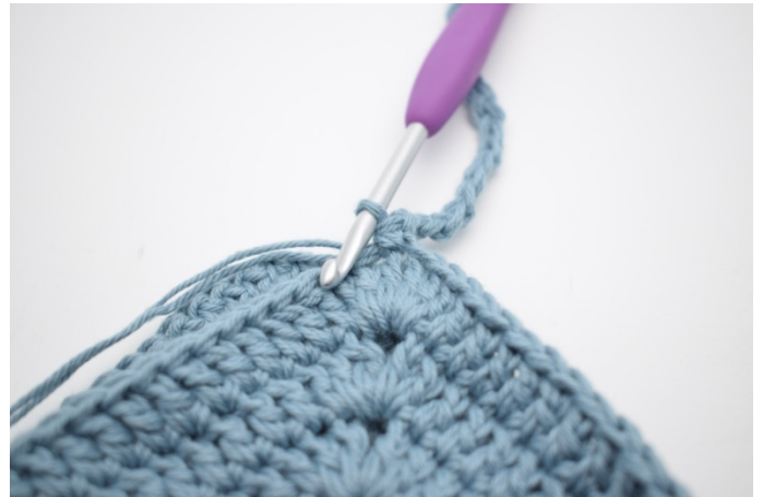
6. W ten sposób.