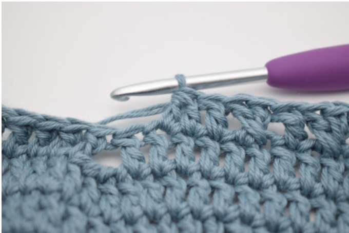
9. Szydełkuj 2 sł raz.