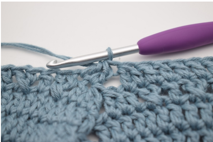
5. W ten sposób.