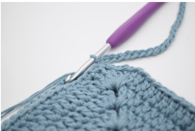
9. Zakończ 1 oś w oł na początku okr.