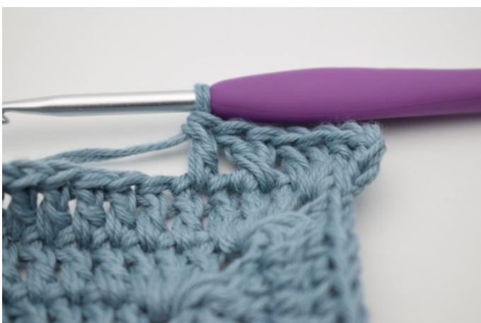
7. Szydełkuj 1 sł w następnym o.