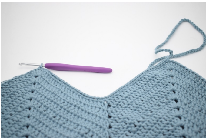
7. Szydełkuj psł w następnych 46 o.