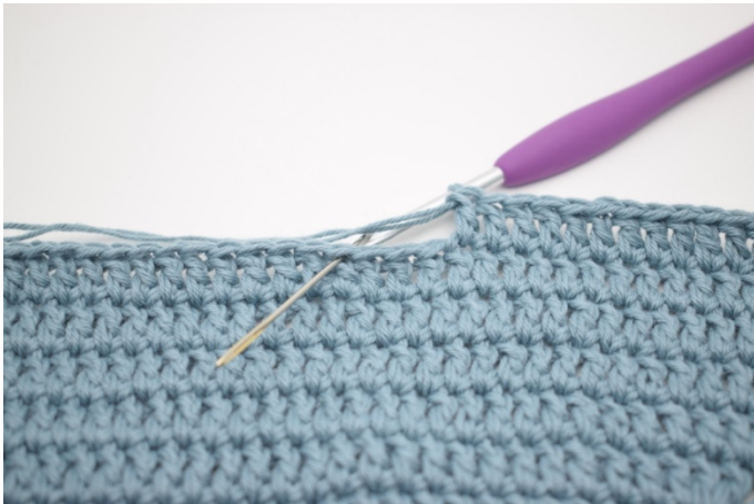
3. Omiń 3 o,