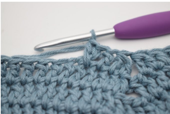
13. Omiń 1 o i szydełkuj 1 sł. Szydełkuj 1 sł w o które właśnie zostało ominięte.