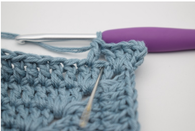
5. Szydełkuj 1 sł w oczku, które właśnie zostało ominięte.