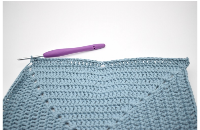
4. i szydełkuj 1 sł w następnych 20 o.