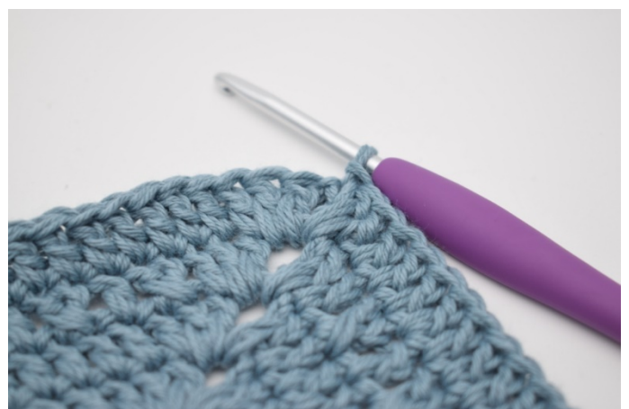
8. Powtarzaj we wszystkich 4 bokach. Szydełkuj 1 sł w łuku na początku okr. Zakończ 1 oł w 3. oł.