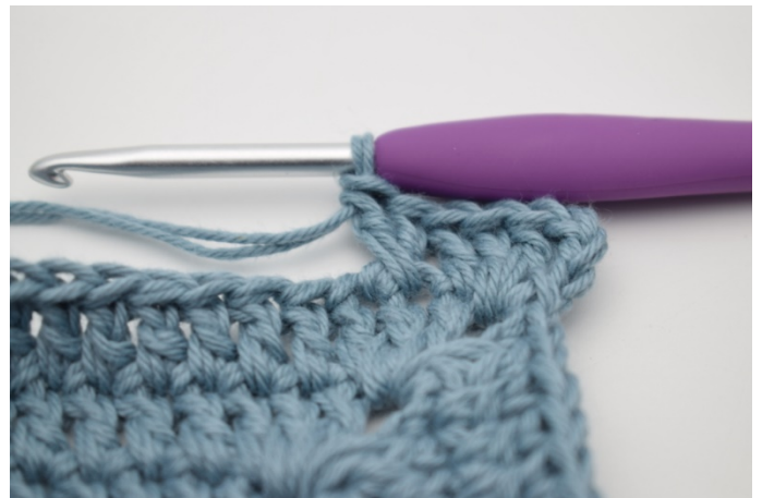
6. W ten sposób. Słupki zostały skrzyżowane i został wykonany pierwszy „krzyżyk”.