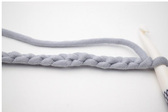
2. Przekręć łańcuszek tak, aby „tył łańcuszka” był skierowany do góry.