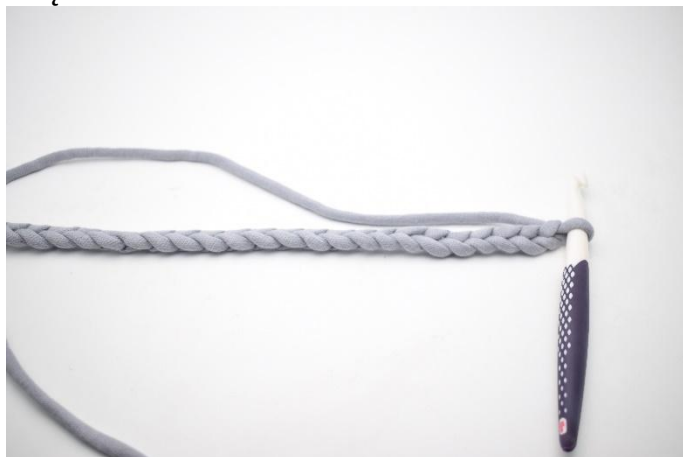
1. Wykonaj łańcuszek.