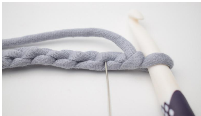
3. Aby uzyskać ładniejszy brzeg, możesz korzystnie szydełkować psł w poziomych pętelkach z tyłu. Igła wskazuje pętelkę, w której należy wykonać pierwszy psł.