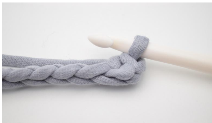
4. W ten sposób.