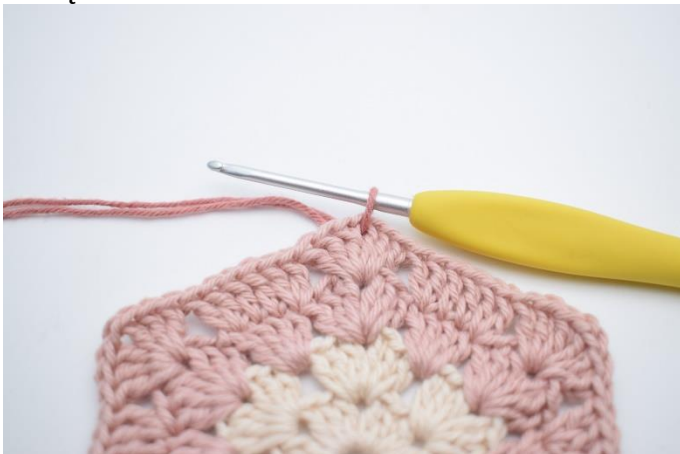
1. Zmień na kolor 3. Dołącz włóczkę w jednym łuku.