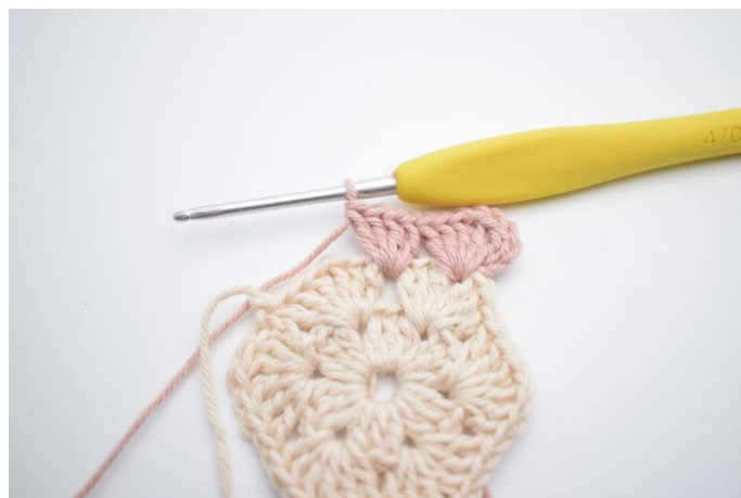
4. W ten sposób.