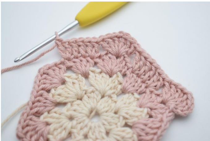
9. omiń 3 o., szydełkuj 2 sł. w następnym o., 1 sł. w następnych 2 o., 2 sł. w następnym o.”.