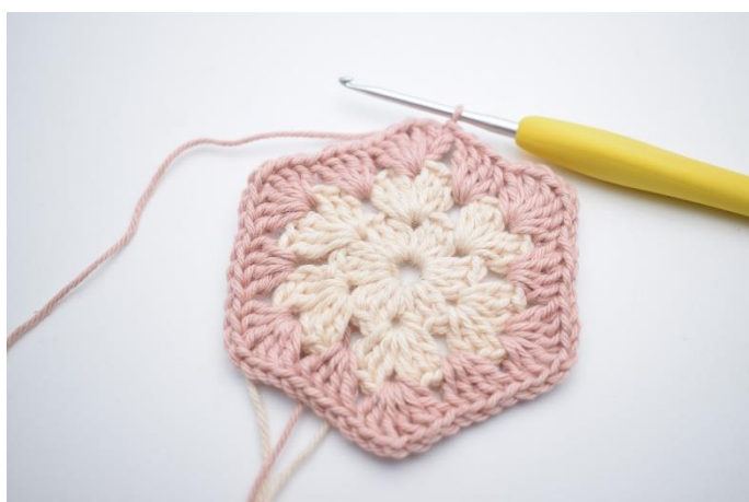
7. Powtarzaj od” do” w sumie 5 razy. Zakończ 1 oś.