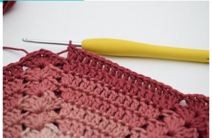
8. W ten sposób.