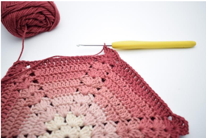
9. Zrób 3 oł. (zastępują 1 sł.). Szydełkuj 2 sł., 1 oł., 3 sł. w łuku.