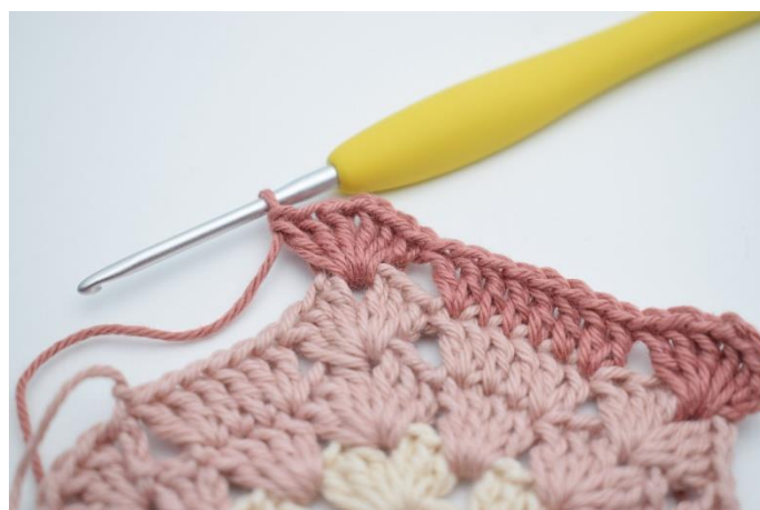
8. „Szydełkuj 3 sł., 1 oł., 3 sł. w następnym łuku,