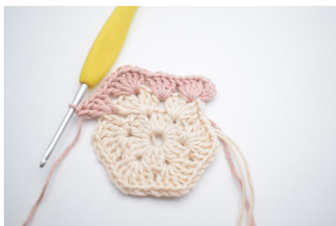
6. szydełkuj 4 sł. w kolejnym łuku”.