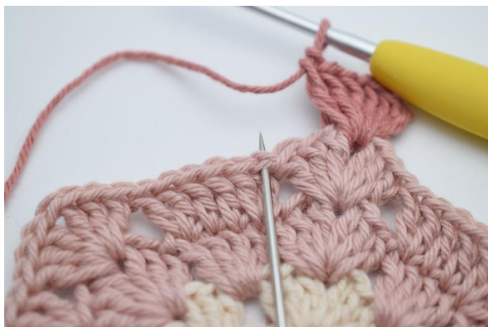
3. Omiń 3 o.,