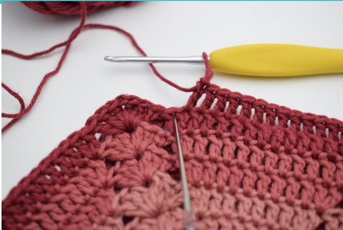
7. 2 sł. w następnym o.