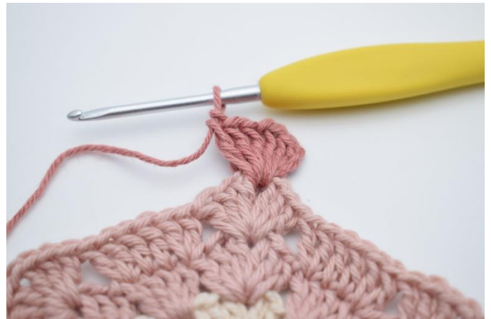
2. Zrób 3 oł. (zastępują 1 sł.). Szydełkuj 2 sł., 1 oł., 3 sł. w łuku.