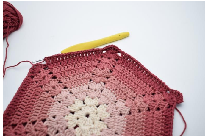
10. Omiń 3 o., szydełkuj 2 sł. w następnym o., 1 sł. w następnych 14 o., 2 sł. w następnym o.”.