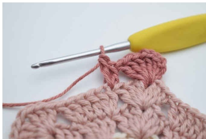
4. szydełkuj 2 sł. w następnym o.