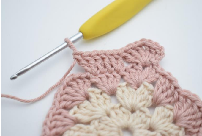
7. W ten sposób.