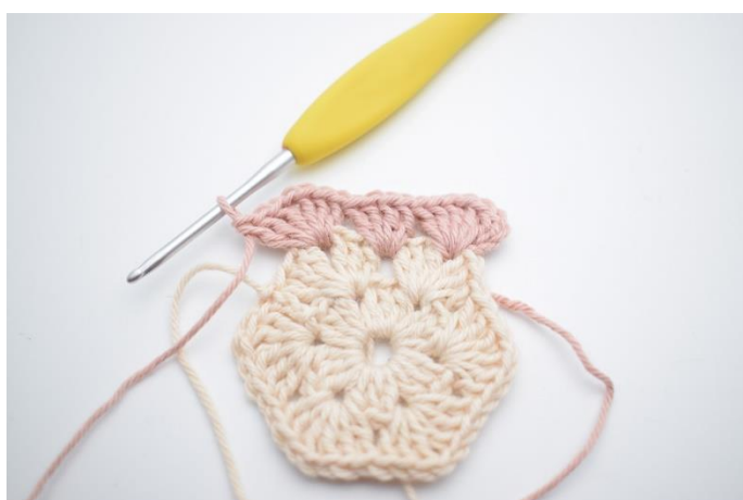
5. „Szydełkuj 3 sł., 1 oł., 3 sł. w następnym łuku,