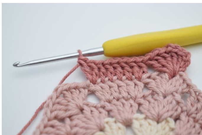
7. W ten sposób.