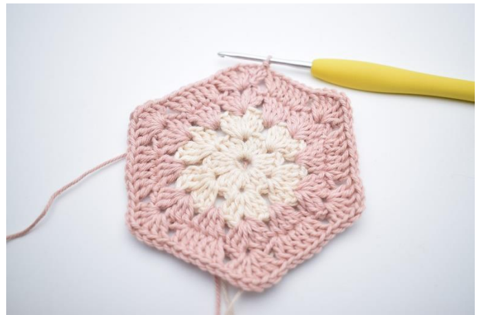
10. Powtarzaj od” do” 5 razy. Zakończ 1 oś. Utnij nitkę.