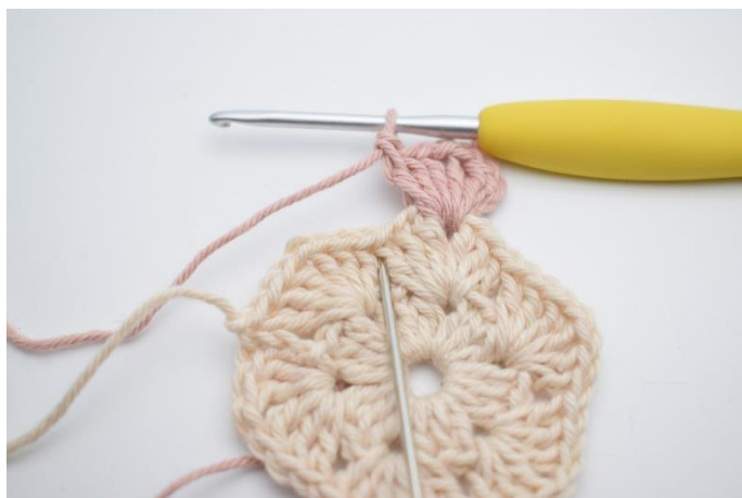
3. W następnym łuku szydełkuj 4 sł.