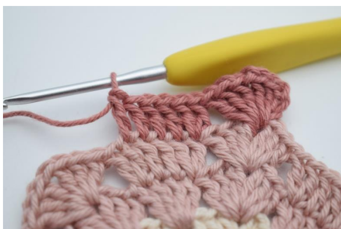
5. Szydełkuj 1 sł. w następnych 4 o.