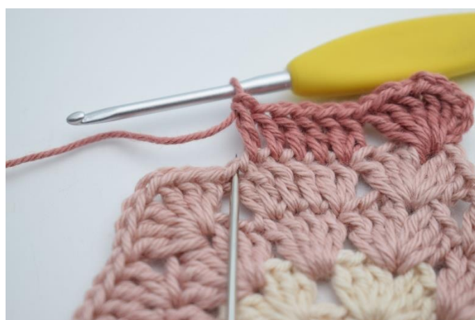
6. Szydełkuj 2 sł. w następnym o.