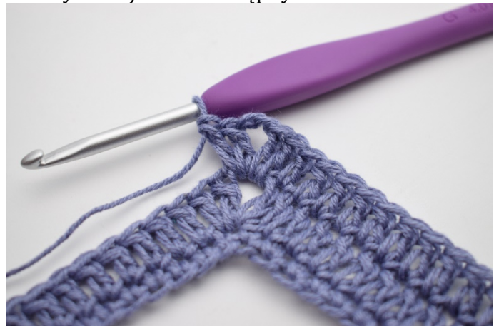
6. W ten sposób.