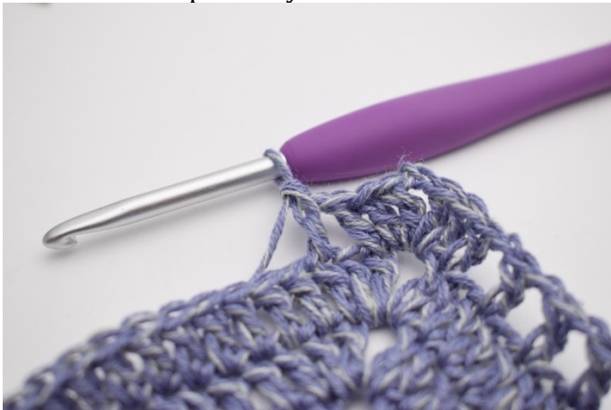
9. szydełkuj 1 sł w następnym o”.