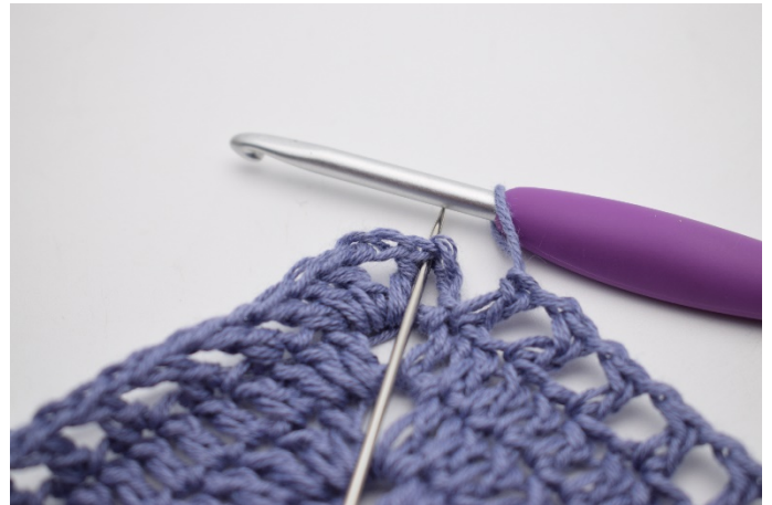
12. Zakończ 1 oś