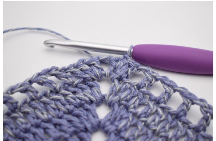
12. W ten sposób.