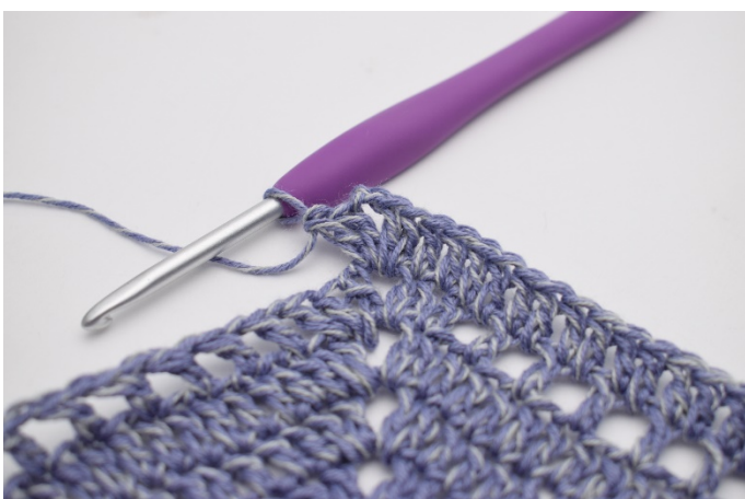
3. W łuku szydełkuj "2 sł, 2 oł, 2 sł".