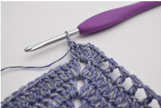
7. Zrób 1 sł w pierwszym o.