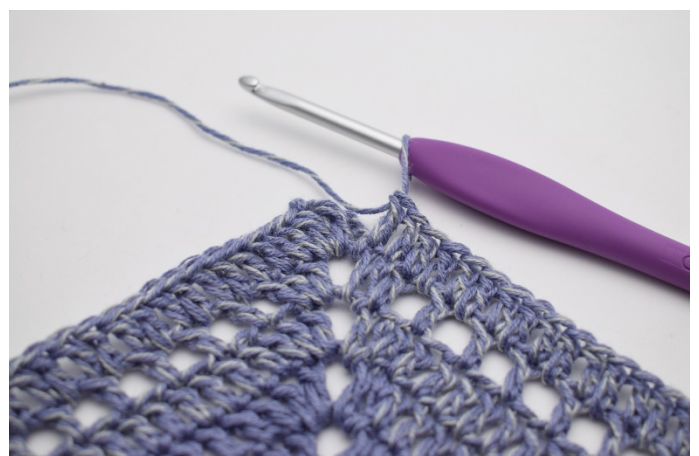
4. Szydełkuj 1 sł w ostatnich 99 o i w oł- dziurkach.