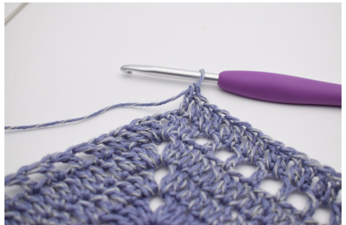
2. Szydełkuj 1 sł w następnych 99 o i w oł- dziurkach.