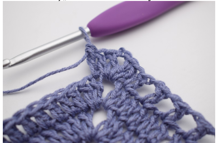
8. Zrób 1 sł w pierwszym o.