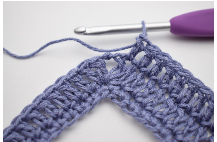
4. Szydełkuj 1 sł w następnych 67 o