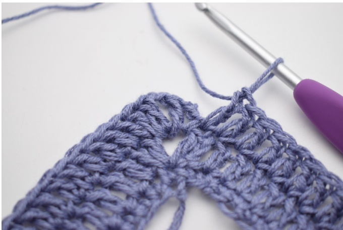
7. Szydełkuj 1 sł w ostatnich 67 o.