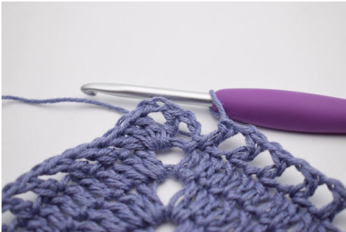
11. Powtarzaj „do” w sumie 41 razy.