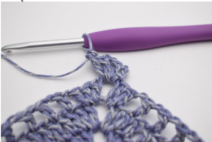
1. Zrób oś w łuku. Zrób 3 oł (zastępują 1.sł). Szydełkuj 1 sł, 2 oł, 2 sł w łuku.