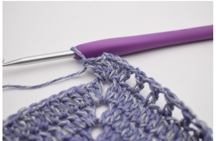
6. W łuku szydełkuj ”2 sł, 2 oł, 2 sł”.