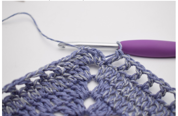
10. Powtarzaj „do” w sumie 47 razy.