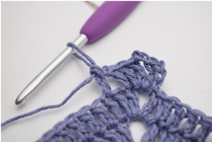
5. szydełkuj 1 sł w następnym o".