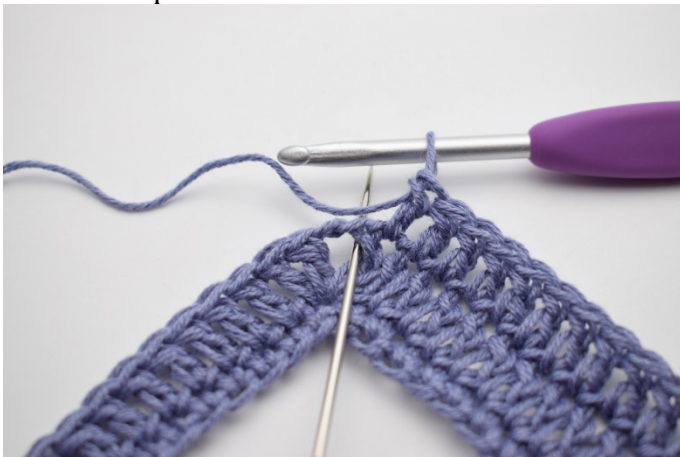
5. W łuku szydełkuj "2 sł, 2 oł, 2 sł".