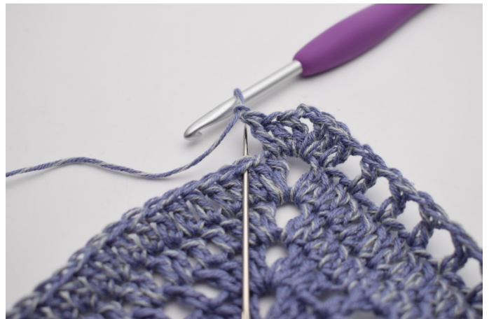
8. ”Zrób 1 oł, omiń 1 o,