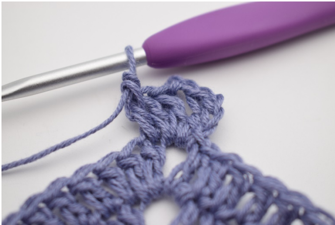
3. Szydełkuj 1 sł w pierwszym o.