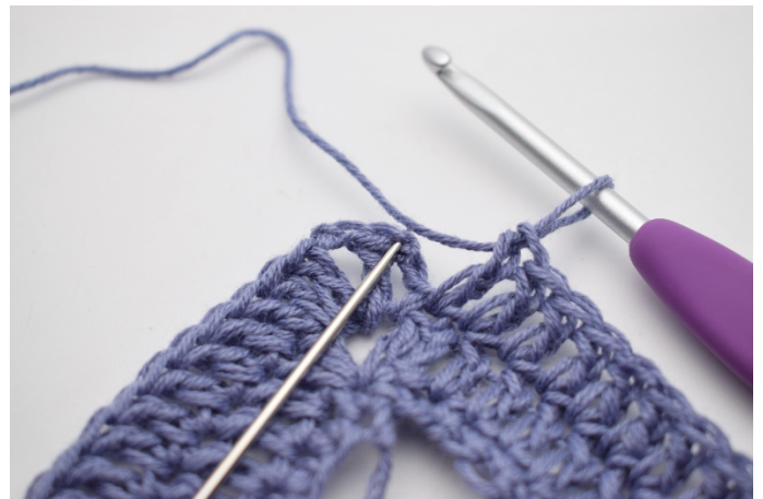
8. Zakończ 1 oś.