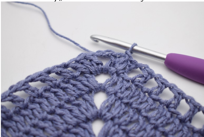
13. W ten sposób.