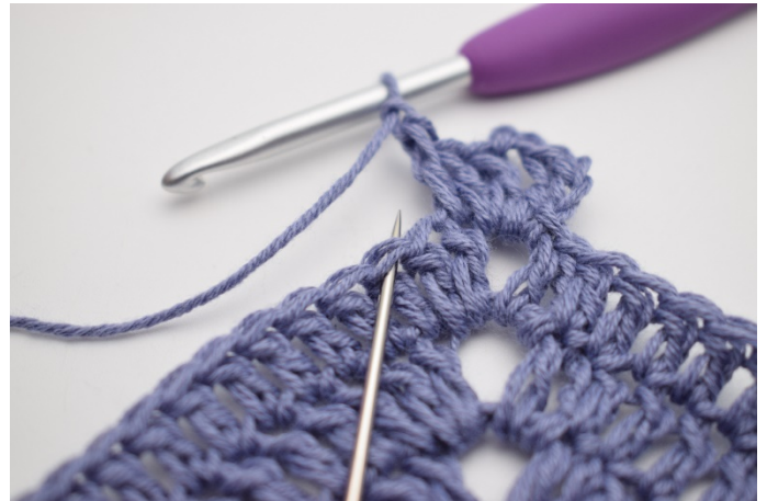
4. "Zrób 1 oł, omiń 1 o,