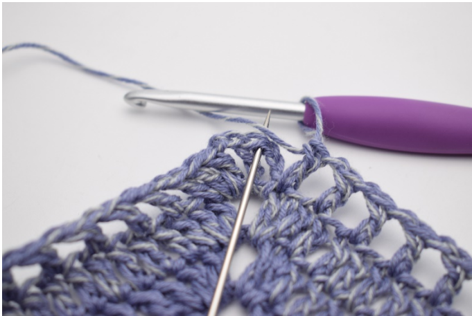
11. Zakończ 1 oś.