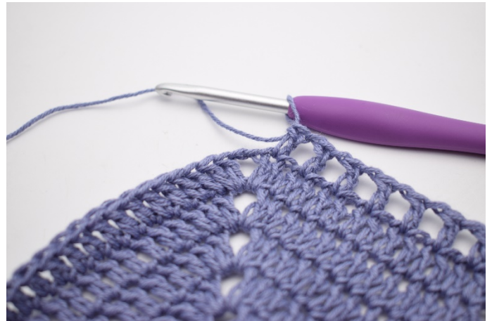
6. Powtarzaj „do” w sumie 41 razy.