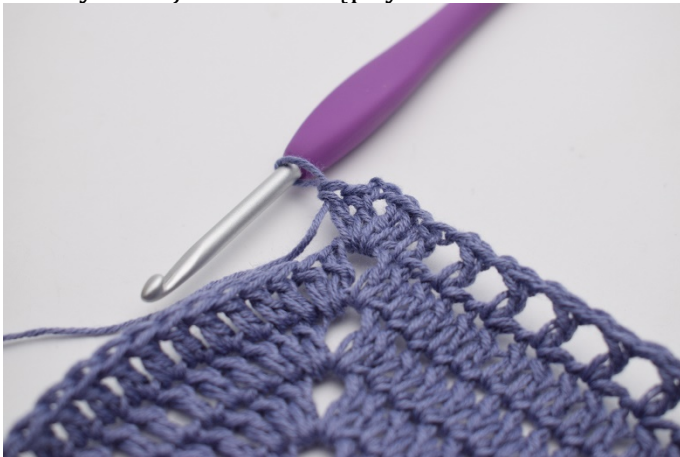
7. W łuku szydełkuj "2 sł, 2 oł, 2 sł".