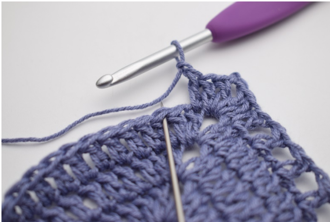
9. "Zrób 1 oł, omiń 1 o,