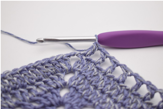
5. Powtarzaj „do” w sumie 47 razy.