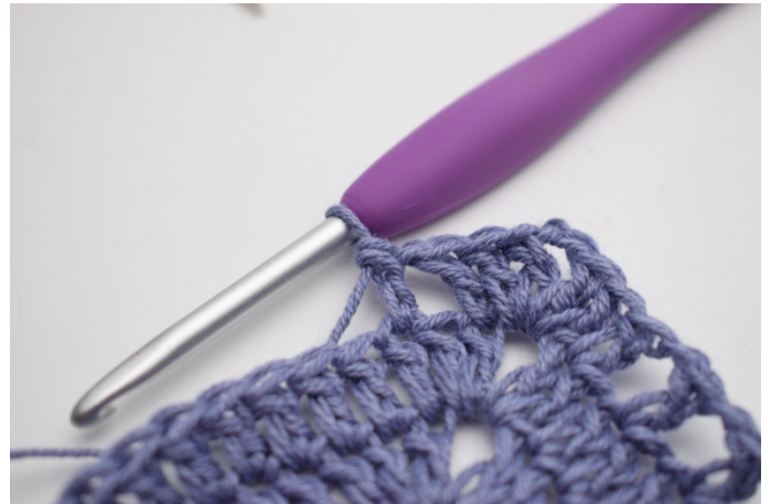
10. szydełkuj 1 sł w następnym o".