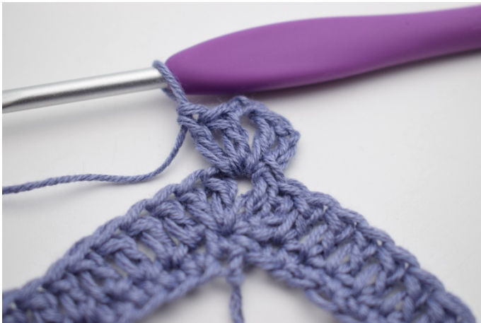
3. W ten sposób.