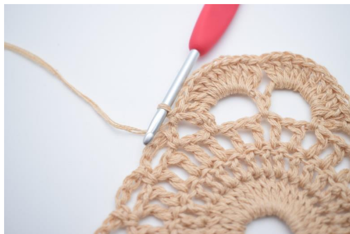
10. W ten sposób.