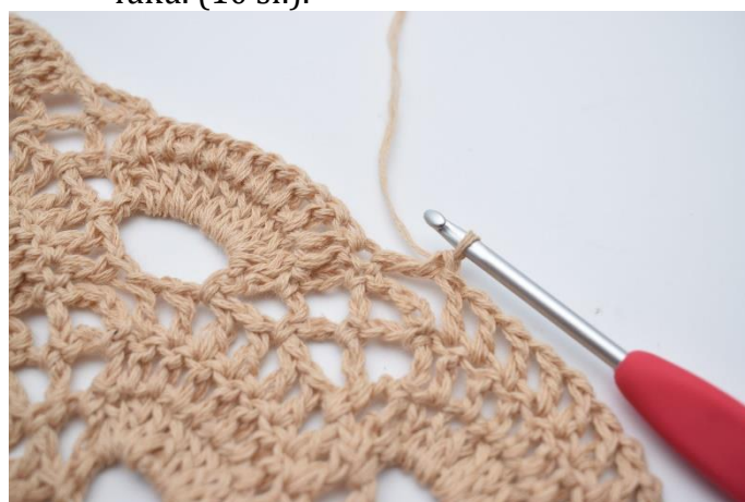
49. W ten sposób.