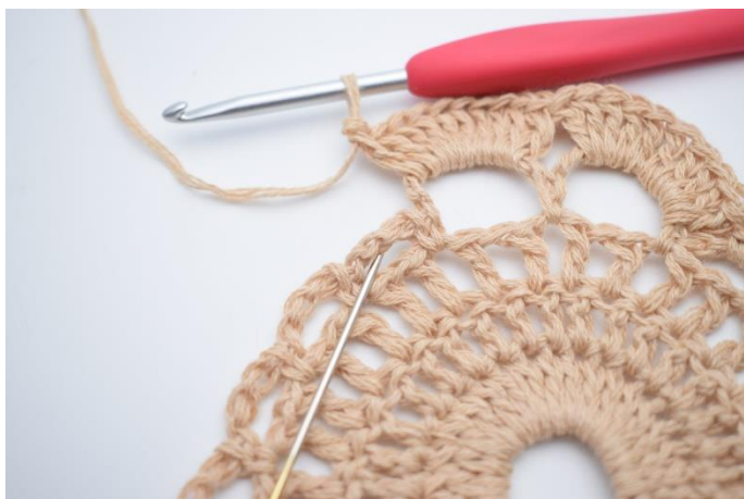
9. Zrób 1 psł. w łuku obok. Igła wskazuje, gdzie wykonać psł.