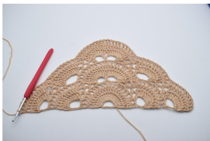
56. Wykonaj "1 oł., 1 sł." we wszystkich sł. wokół ostatniego dużego łuku. (10 sł.).