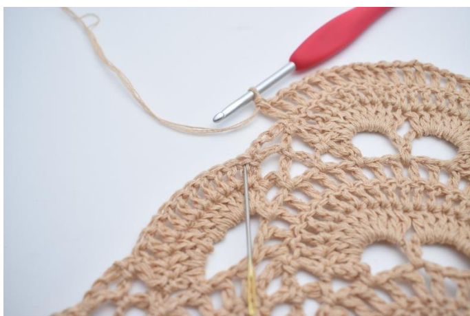
53. Omiń mały łuk i wykonaj 1 sł. w pierwszym sł. wokół następnego dużego łuku. Igła wskazuje, gdzie wykonać sł.