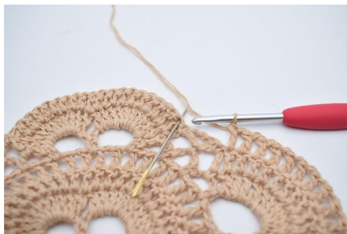
51. Omiń mały łuk i wykonaj 1 sł. w pierwszym sł. wokół następnego dużego łuku. Igła wskazuje, gdzie wykonać sł.