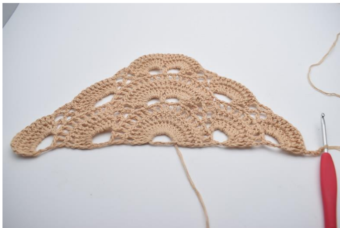
46. Odwróć robótkę 4 oł. (zastępują 1 sł. i 1 oł.).