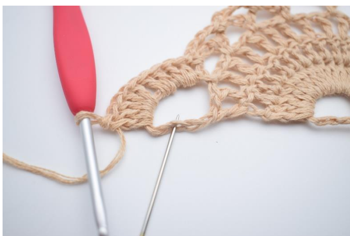
13. Wykonaj 10 sł. w ostatnim dużym łuku. Ostatni sł. wykonaj w 3. oł., które wskazuje igła.