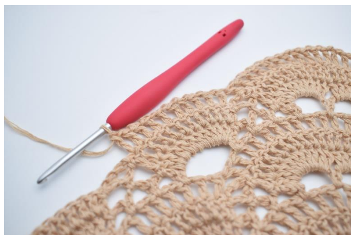
54. Wykonaj "1 oł., 1 sł." we wszystkich sł. wokół dużego łuku. (10 sł.).