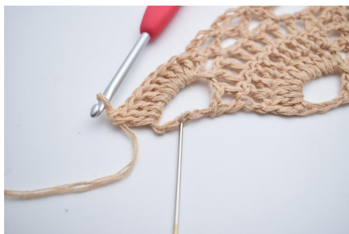
44. Wykonaj 10 sł. wokół ostatniego dużego łuku. Ostatni sł. wykonaj w 3. oł. Igła wskazuje, gdzie wykonać sł.