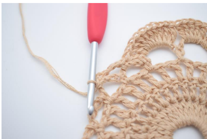
11. Zrób 4 oł. i wykonaj 1 psł. w następnym łuku.