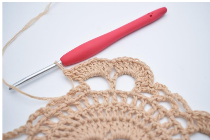
40. Wykonaj 10 sł. wokół dużego łuku obok. Wykonaj 1 psł. w łuku obok.