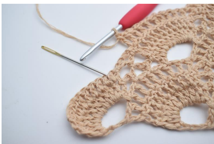
55. Omiń mały łuk i wykonaj 1 sł. w pierwszym sł. wokół następnego dużego łuku. Igła wskazuje, gdzie wykonać sł.