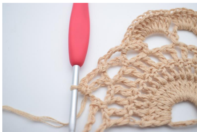
12. Zrób 4 oł. i wykonaj 1 psł. w następnym łuku.