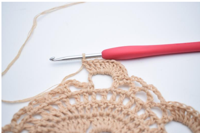
39. Wykonaj 10 sł. wokół dużego łuku.