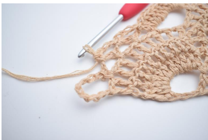
43. Zrób 4 oł. i wykonaj 1 psł. w następnym łuku. Powtórz jeszcze 1 raz, masz 2 małe łuki.