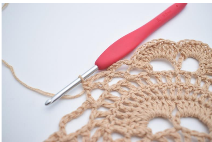
41. Zrób 4 oł. i wykonaj 1 psł. w następnym łuku. Powtórz jeszcze 1 raz, masz 2 małe łuki.