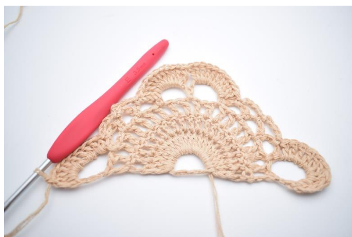
14. W ten sposób.