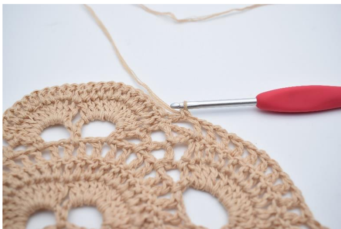
52. W ten sposób.