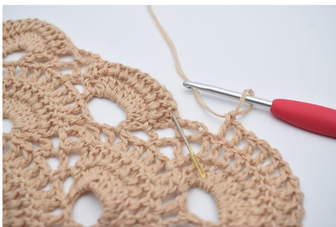
48. Omiń mały łuk i wykonaj 1 sł. w pierwszym sł. wokół następnego dużego łuku. Igła wskazuje, gdzie wykonać sł.