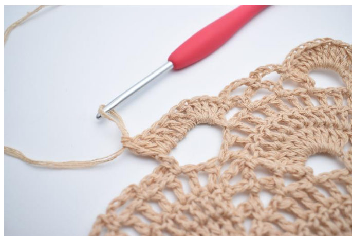
42. Wykonaj 10 sł. wokół dużego łuku.