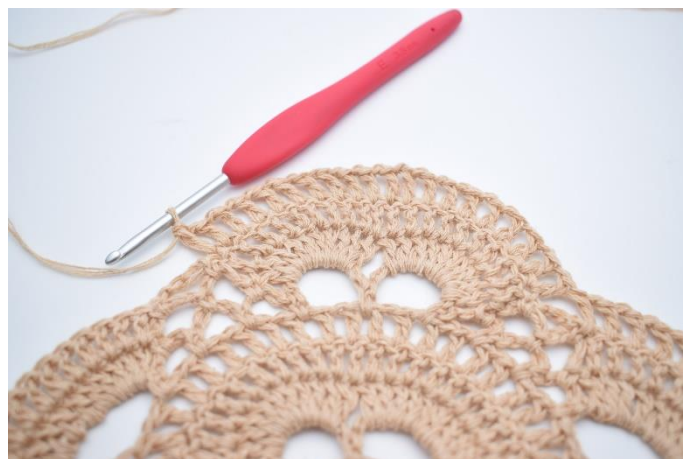
Wykonaj "1 oł., 1 sł." we wszystkich oczkach wokół 2. dużych łuków. (20 sł.).