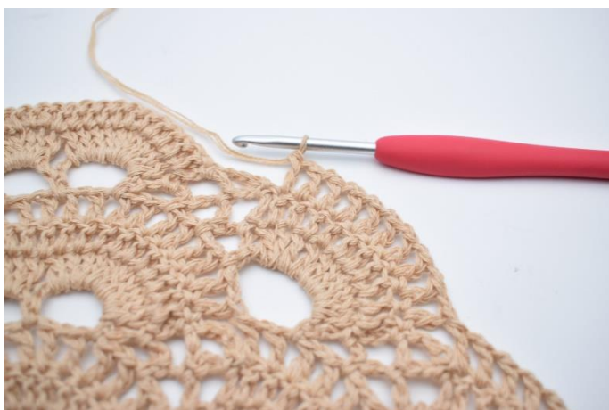
50. Wykonaj "1 oł., 1 sł." we wszystkich sł. wokół dużego łuku. (10 sł.).