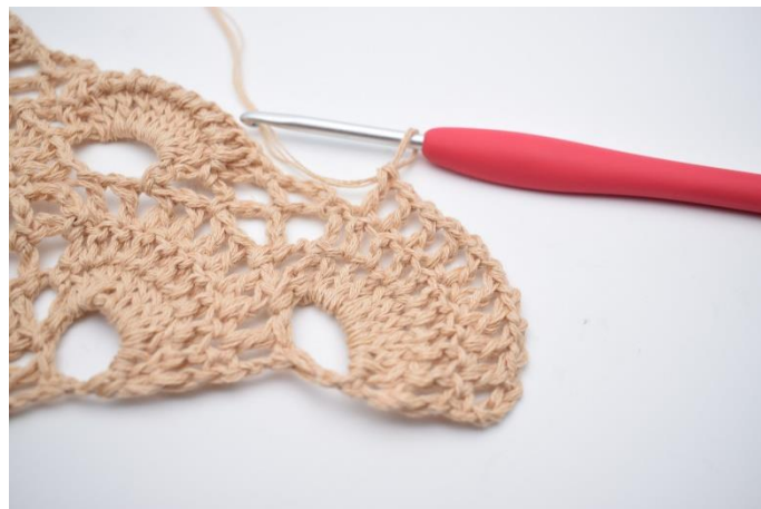
47. Wykonaj 1 sł. w następnym o. Wykonaj "1 oł., 1 sł." we wszystkich sł. wokół dużego łuku. (10 sł.).