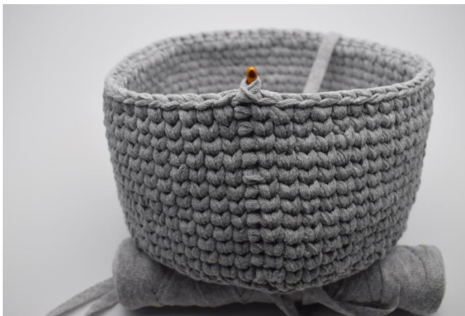
11. Powtarzaj okrążenia aż otrzymasz pożądaną wysokość koszyka.