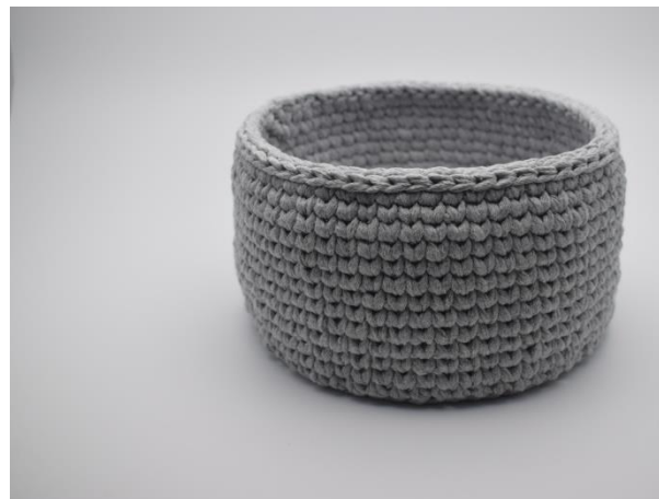
12. Zakończ koszyk jednym okrążeniem oś.