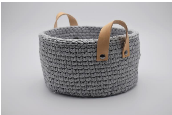
13. Przymocuj uchwyty z każdej strony koszyka.